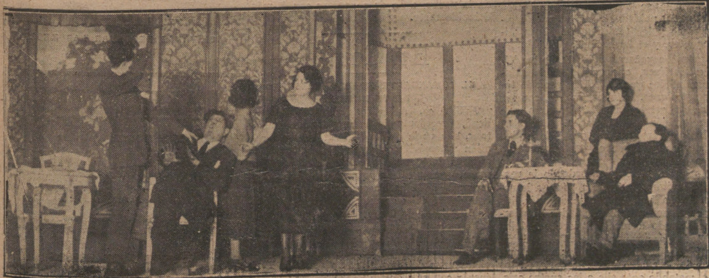
UNA ESCENA DE «SIMEÓN». ACTO I. EN EL ACTO I LOS SRES. NAVARRO Y JAQUETOT, ESTRENADA AYER EN ESLAVA

La familia de Zuloaga ha recibido numerosos telegramas de pésame de artistas españoles.