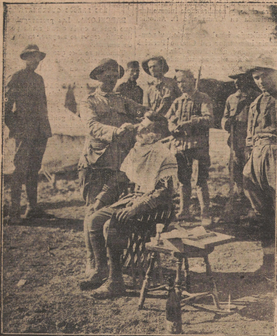
BARBERIA AL AIRE LIBRE