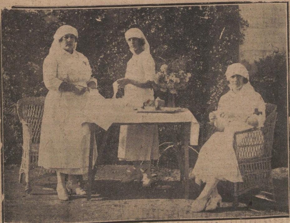
DAMAS ENFERMERAS PREPARANDO EL MATERIAL DE CURA