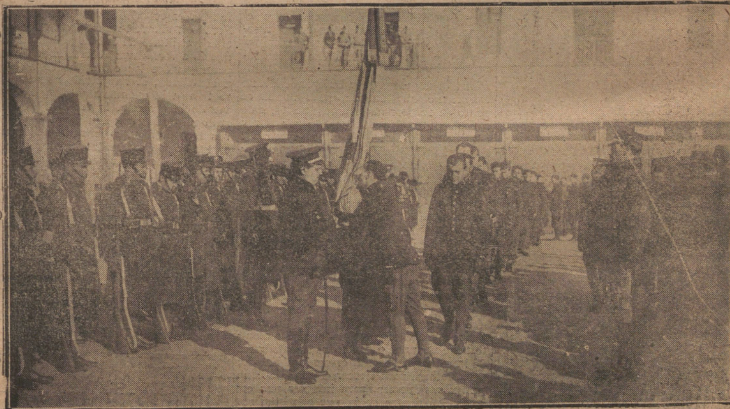
LA JURA DE LA BANDERA POR LOS RECLUTAS DE INGENIEROS EN EL CUARTEL DE LA MONTAÑA

V Y murió también el hijín pequeño. Sólo que como éste había sido la gloria de la familia, murió ya de viejo viejísimo, en su cama, recibiendo como homenaje postremo las alabanzas de los defensores del orden, las informaciones periodísticas, los metros de película empleados en recoger las notas gráficas de su entierro, los honores militares.