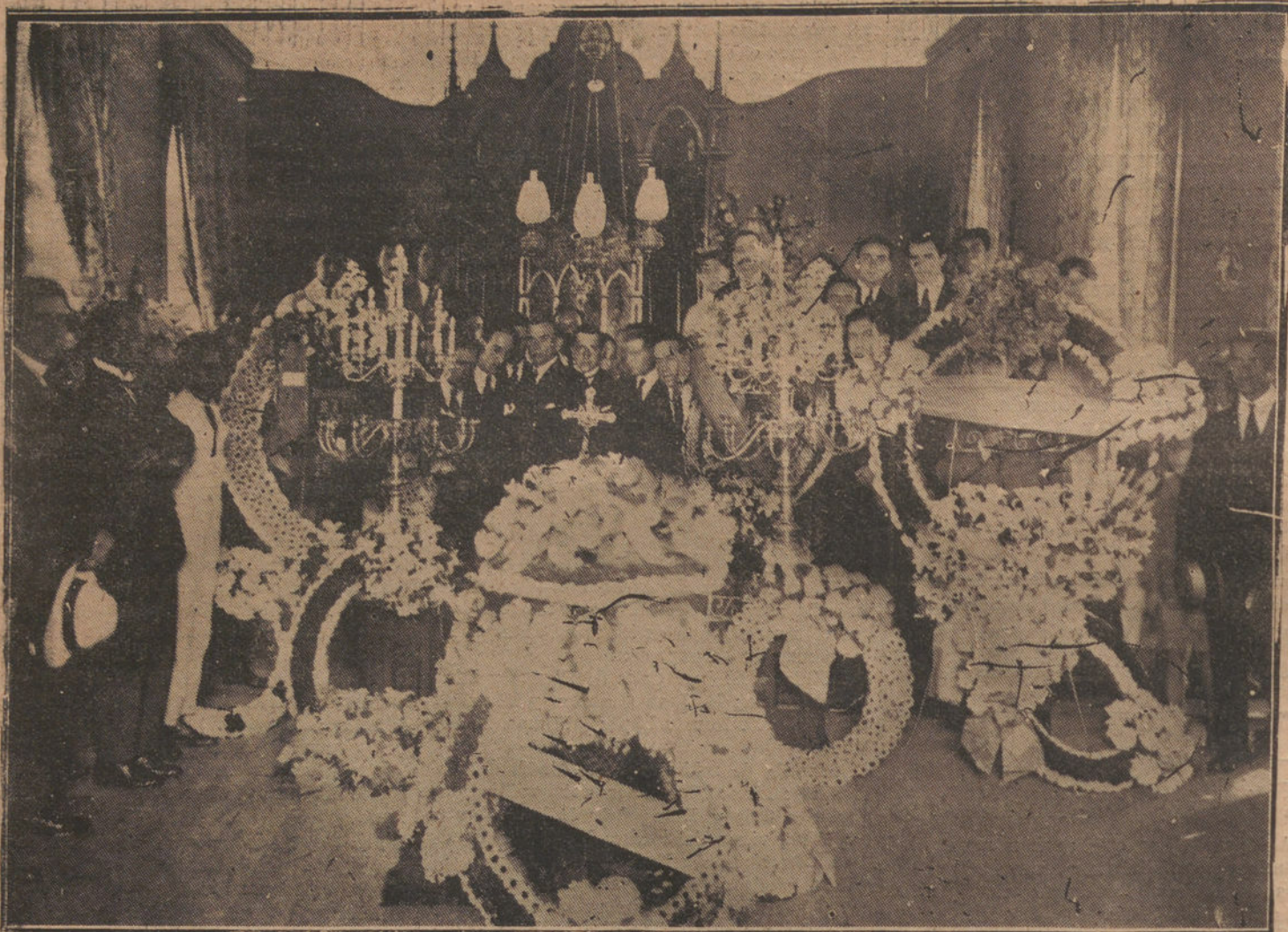
LA CAPILLA ARDIENTE DEL INFORTUNADO DIESTRO VALENCIANO EN CARACAS