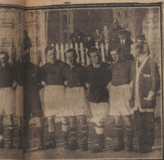
A UNIÓN ATHLETIC RACING