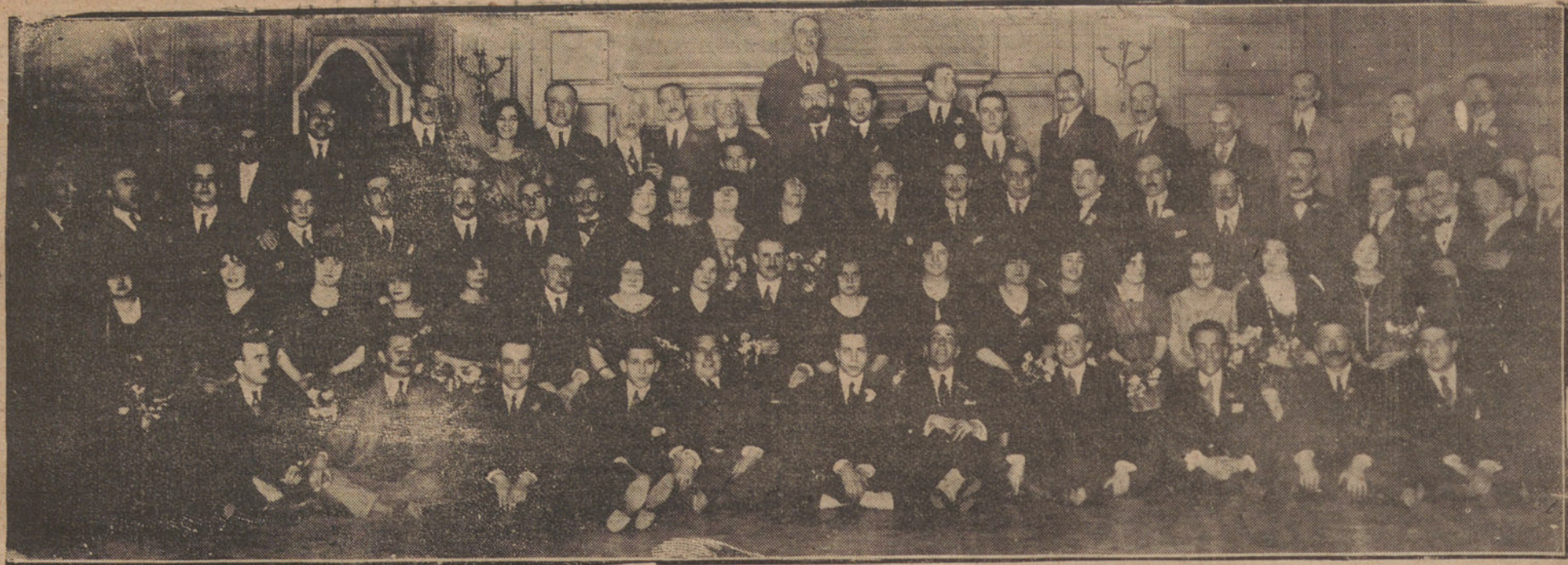
EN EL PALACE HOTEL.—PERSONAL DEL METROPOLITANO ALFONSO XIII QUE CELEBRÓ CON UN BANQUETE LA ENTRADA DE AÑO