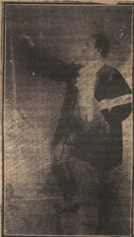
HIPOLITO LAZARO, el famoso tenor español que se presenta esta noche en el teatro Real.

Ayer ha fallecido otro de los heridos a consecuencia de la reciente explosión de varias bombas.