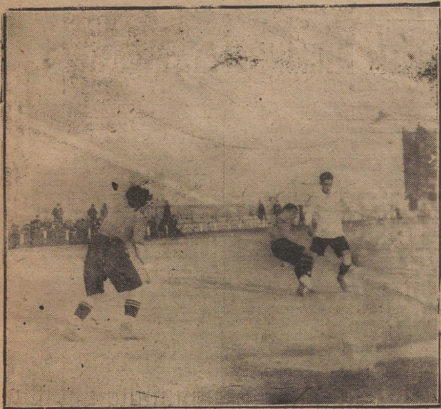
UN MOMENTO DEL PARTIDO JUGADO AYER ENTRE EL RACING DE SANTANDER, Y EL MADRID F. C.