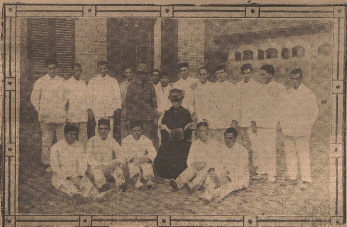
EN SAN SEBASTIAN.—SU MAJESTAD LA REINA DONA MARIA CRISTINA, EN EL HOS PITAO DE LA CRUZ ROJA, RODEADA DE SOLDADOS CONVALECIENTES

Lo que sí pueden hacer es utilizar un derecho que la ley concede a los elementos del Estado Mayor, solicitando determinados destinos para cuya ocupación se sigue un ri-