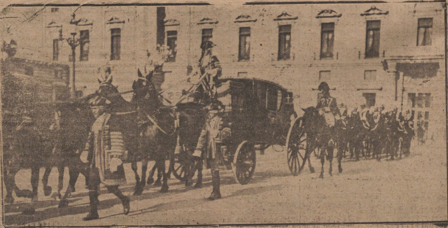
CEREMONIA DIPLOMATICA EN PALACIO.—EL EMBAJADOR EXTRAORDINARIO DE MEXICO SALIENDO DEL REGIO ALCAZAR EN UNA CARROZA DE GALA, DESPUES DE PRESENTAR SUS CREDENCIALES