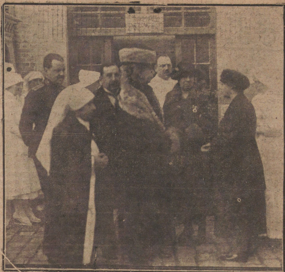
EN SAN SEBASTIAN.—SU MAJESTAD LA REINA DOÑA MARIA CRISTINA CONVERSANDO CON LAS DAMAS ENFERMERAS EN EL HOSPITAL DE LA CRUZ ROJA