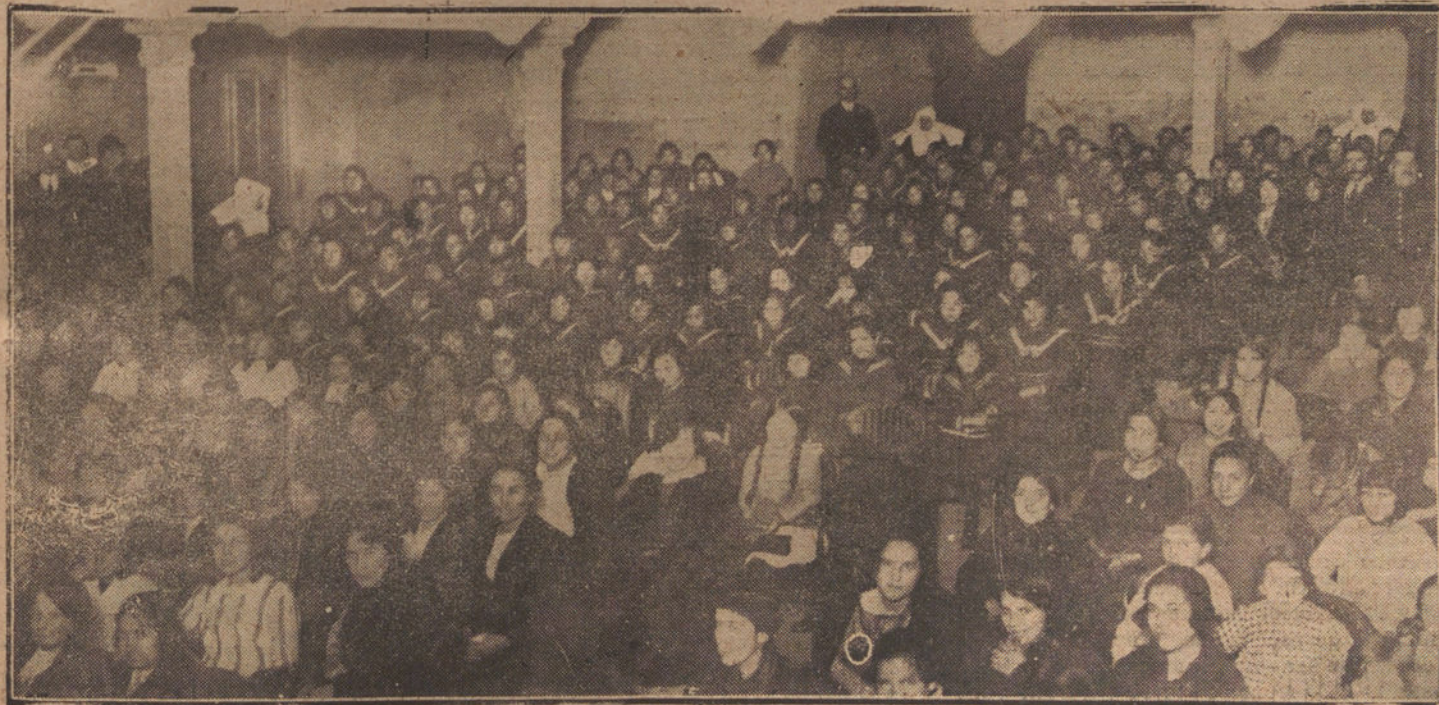
EN EL TEATRO DE ESLAVA.—ASPECTO DE LA SALA DE BUTACAS DURANTE LA FIESTA CELEBRADA AYER EN OBSEQUIO A LOS NIÑOS DE LOS ASILOS DE MADRID

Espera el alcalde que dentro de pocos días estarán mejoradas las actuales dificultades de circulación a ciertas horas por los sitios céntricos, siendo conveniente para ello que los coches y automóviles se acostumbren en las grandes vías a seguir únicamente a los de su clase, confiando el alcalde para todas estas medidas en la eficaz colaboración del vecindario.