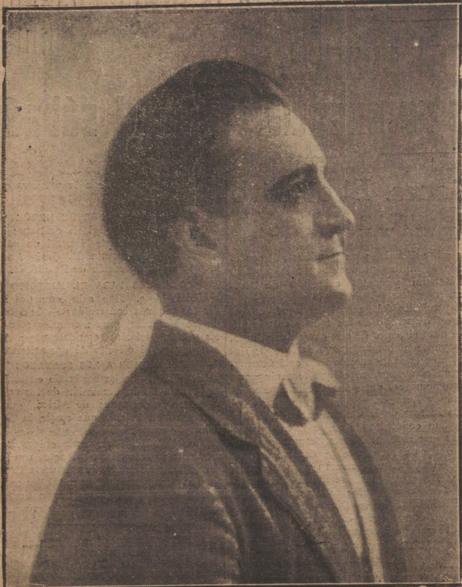
EL TENO... ESPAÑOL HIPOLITO LAZARO, QUE TAN GRAN EXITO ACABA DE OBTENER EN EL TEATRO REAL