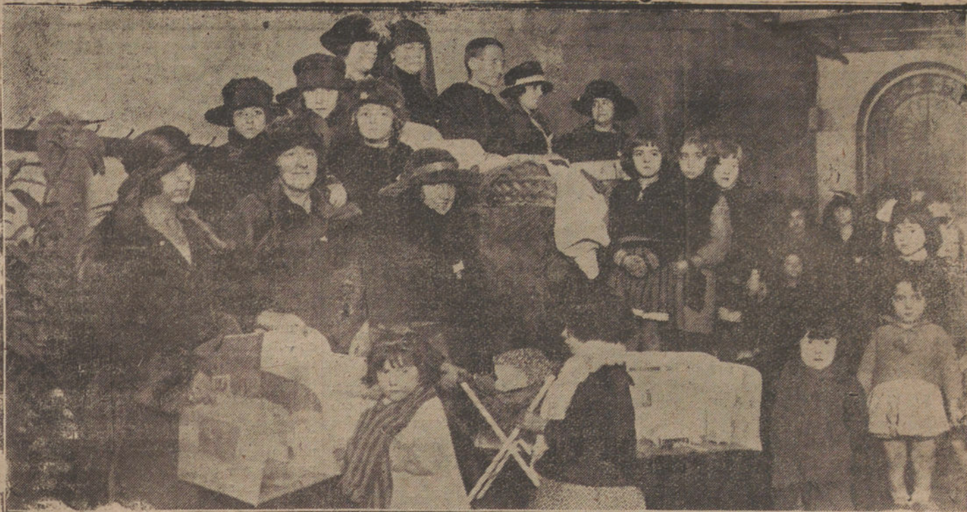
LA FIESTA DE REYES.—REPARTO DE JUGUETES EN EL COLEGIO NUEVO DE SAN AGUSTÍN

A Sus Majestades y altezas seguían las Infantas de San Carlos, Vistahermosa, Medinaceli, Dural y Pastrana; marquesas de Rafal, Hoyos, Comillas y Bondad Real; con-