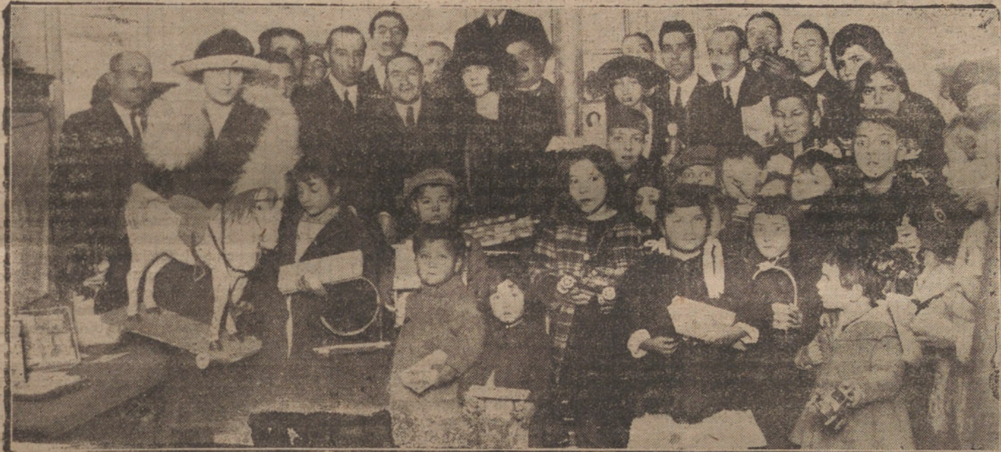
LA FIESTA DE REYES.—REPARTO DE JUGUETES EN EL CENTRO MAURISTA

Al pasar frente al edificio del Ateneo, se paró, y, descendiendo de su caballo, el rey negro entregó artísticos juguetes a los infantes, que, acompañados de sus altezas don Carlos y doña Luisa, presenciaban el desfile.