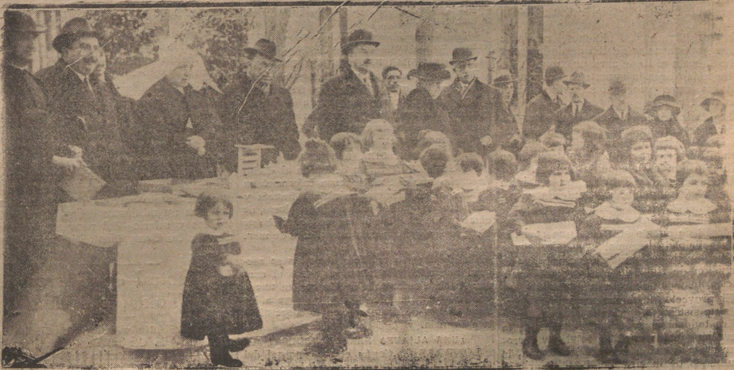
LA FIESTA DE REYES.—REPARTO DE JUGUETES EN EL ASILO DE VALLEHERMOSO