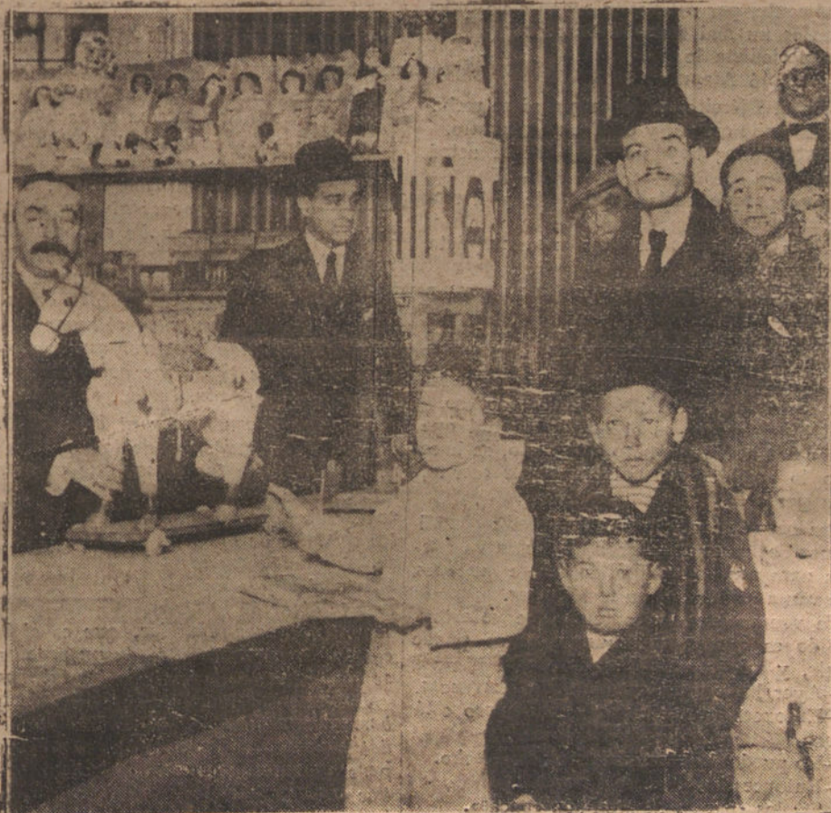
LA FIESTA DE REYES.—REPARTO DE JUGUETES EN EL CENTRO DE HIJOS DE MADRID

Con hornos y elementos para fabricar 2.000 raciones de pan al día, se hacen 4.000 y, como es natural, sus condiciones son pésimas. No facilitan carne, ni vino, ni pastas, y como no existe carretera a ninguna parte, y no pueden venir camiones ni carros,