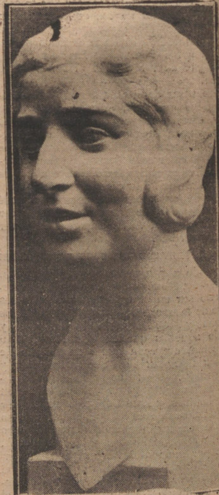
BUSTO DE LA APLAUDIDA BALARINA PAGANINI, MODELADO EN ROMA POR EL NOTABLE ESCULTOR ESPAÑOL E. ORDUÑA

Recientemente, a su vuelta de Europa, el «rey de la risa», ha refused la proposición del empresario de un gran teatro de Nueva York, que le ofrecía 15.000 dólares por representar en el escenario, todas las noches durante una semana.