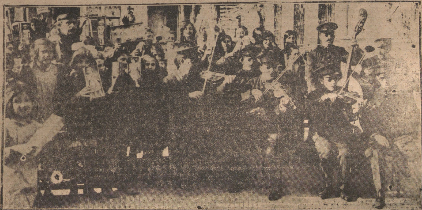
LA FIESTA DE REYES.—CONCIERTO EN LOS COMEDORES DE LA INMACULADA

El estado del general es de suma gravedad.