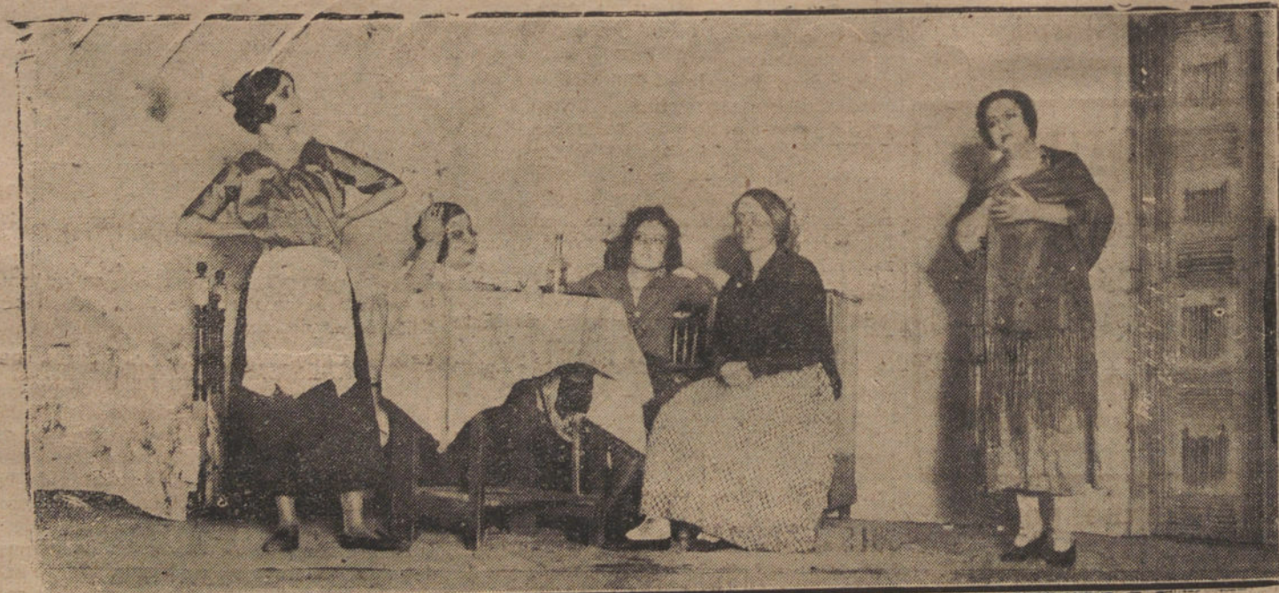
UNA ESCENA DEL ÚLTIMO ACTO DE «SANTA ISABEL» DE CERES, QUE SE ESTRENA ESTA NOCHE EN ESLAVA

Nuestros corresponsales en diversas provincias nos telegrafían que se ha celebrado con gran brillantez la fiesta de los Reyes Magos.