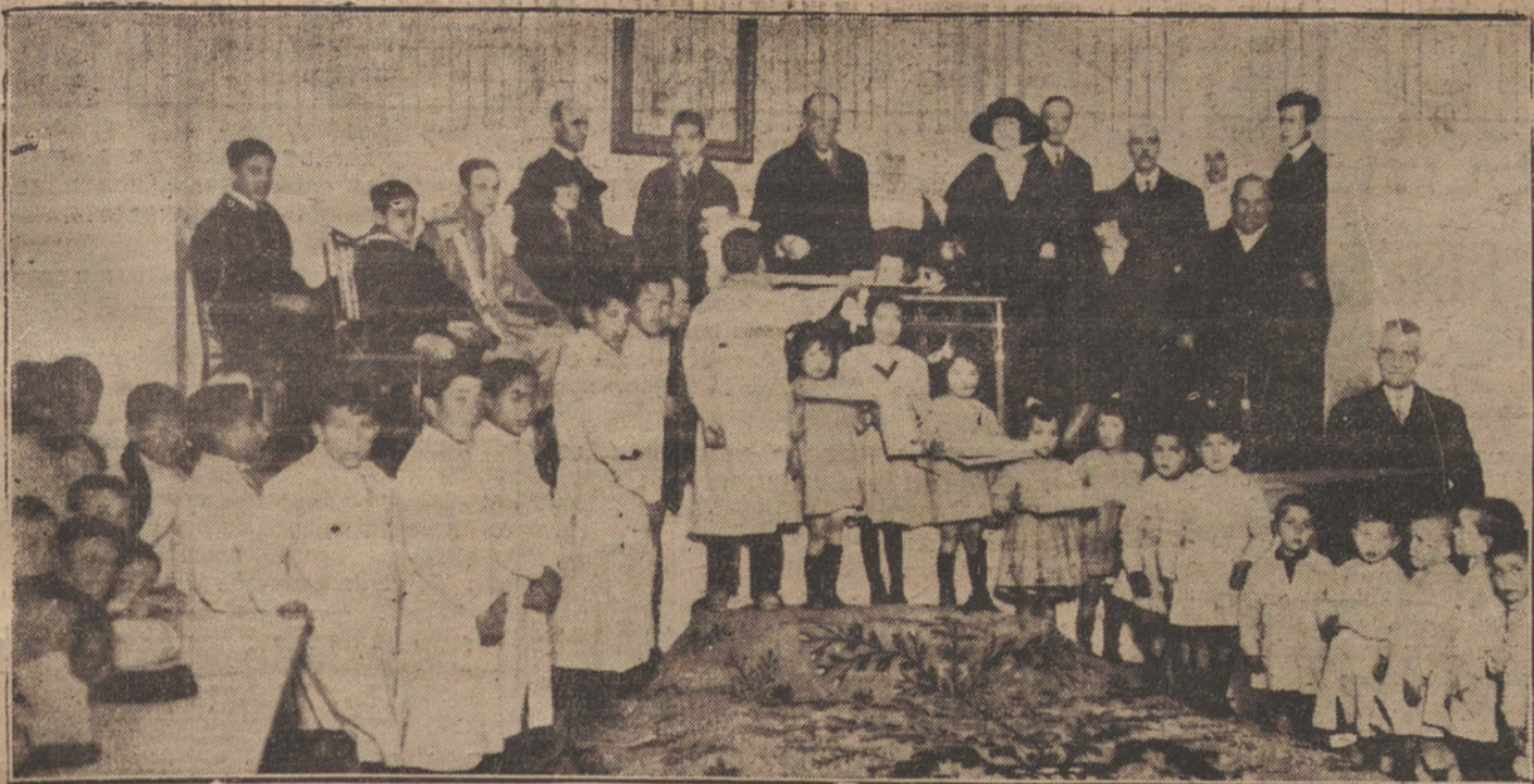
LA FIESTA DE REYES.—REPARTO DE JUGUETES EN EL ASILO DE SANTA CRISTINA