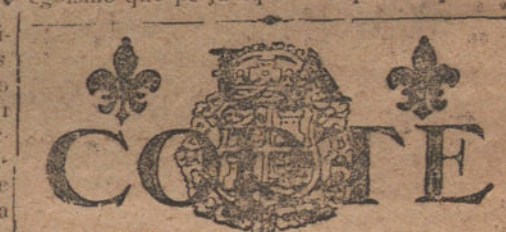
LA CORTE DE GALA

Partiendo de esta base la solución favoreciendo a los industriales de papel no perjudica en nada a la Prensa. Todo aquel que opine en contra no podrá probar en ningún terreno que le asiste la razón, y hasta podemos añadir que pretende hacer mal uso de la fuerza periodística, que en ningún caso puede ni debe ponerse al servicio de ningún egoísmo que perjudique la riqueza española.