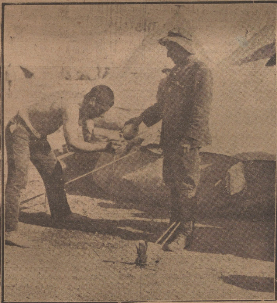
ASI SE LAVAN NUESTROS SOLDADOS!

«En cuanto a la Comisión informativa del Arma de Infantería, es necesario consignar que mantuvo su anterior actitud durante el día de ayer. Era ésta de una absoluta irreductibilidad. La decisión señalada en los primeros artículos del colega militar—decisión de ir a todo trance contra la actuación del ministro de la Guerra—según siendo firme. Mostraban asimismo su resolución