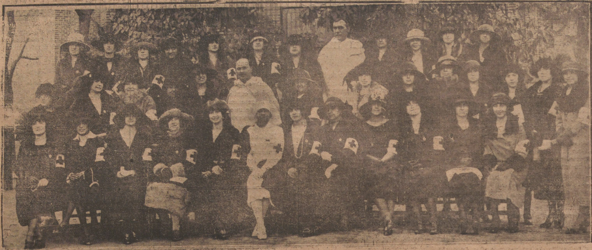
GRUPO DE NUEVAS DAMAS ENFERMERAS DE LA CRUZ ROJA, DESPUES DE LA IMPOSICION DE BRAZALETES POR S. M. LA REINA DOÑA VICTORIA.