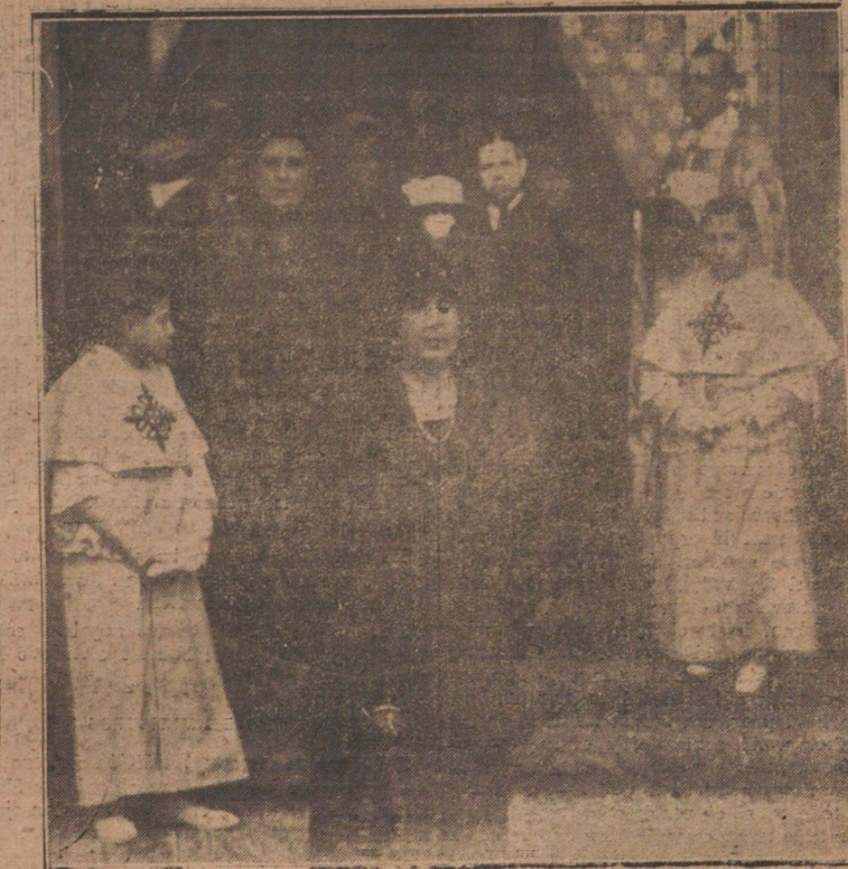
SU MAJESTAD LA REINA DOÑA VICTORIA AL SALIR DEL HOSPITAL DE SAN JOSE Y SANTA ADELA, DESPUES DEL ACTO DE IMPOSICION DE BRAZALETES A LAS NUEVAS DAMAS ENFERMERAS DE LA CRUZ ROJA