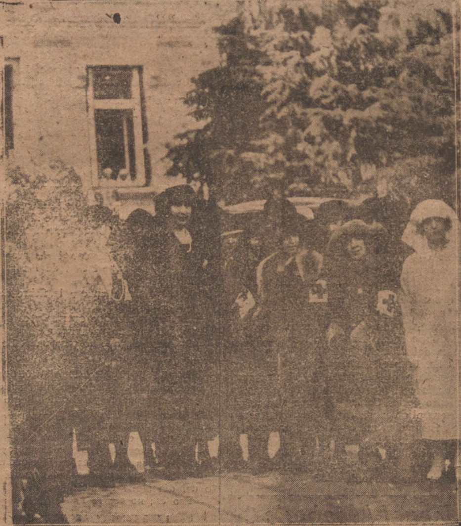
SU MAJESTAD LA REINA DOÑA VICTORIA AL SALIR DE LA IGLESIA DE LAS CALATRAVAS, DESPUES DE OIR UNA MISA EN SUFRAGIO DE LAS DAMAS ENFERMERAS DE LA CRUZ ROJA FALLECIDAS EL AÑO PASADO.

(Fotografía obtenida antes de la salida de la ex emperatriz para Suiza, y)