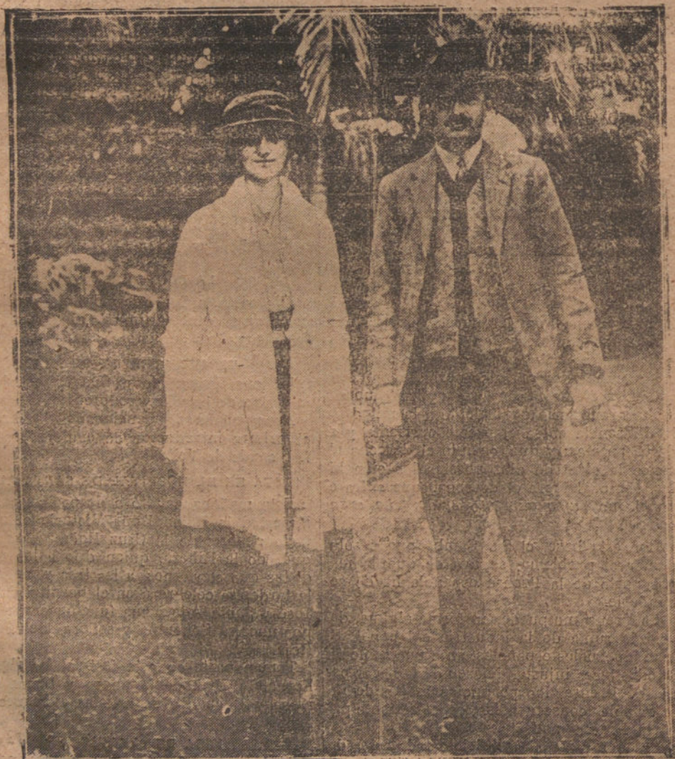
FUNCHAL (ISLA DE MADERA).—LOS EX EMPERADORES DE AUSTRIA, CARLOS Y ZITA, EN EL JARDIN DE SU VILLA VICTORIA.

Dios te guarde, Raquel; llena eres de gracia, la emoción es contigo, divina eres entre todas las estrellas, y divino es el fruto de tu arte: el cuplé. Adorable Raquel, madre del arte, canta para nosotros, ahora y siempre, por los siglos de los siglos. Amén. Alvaro RETANA.