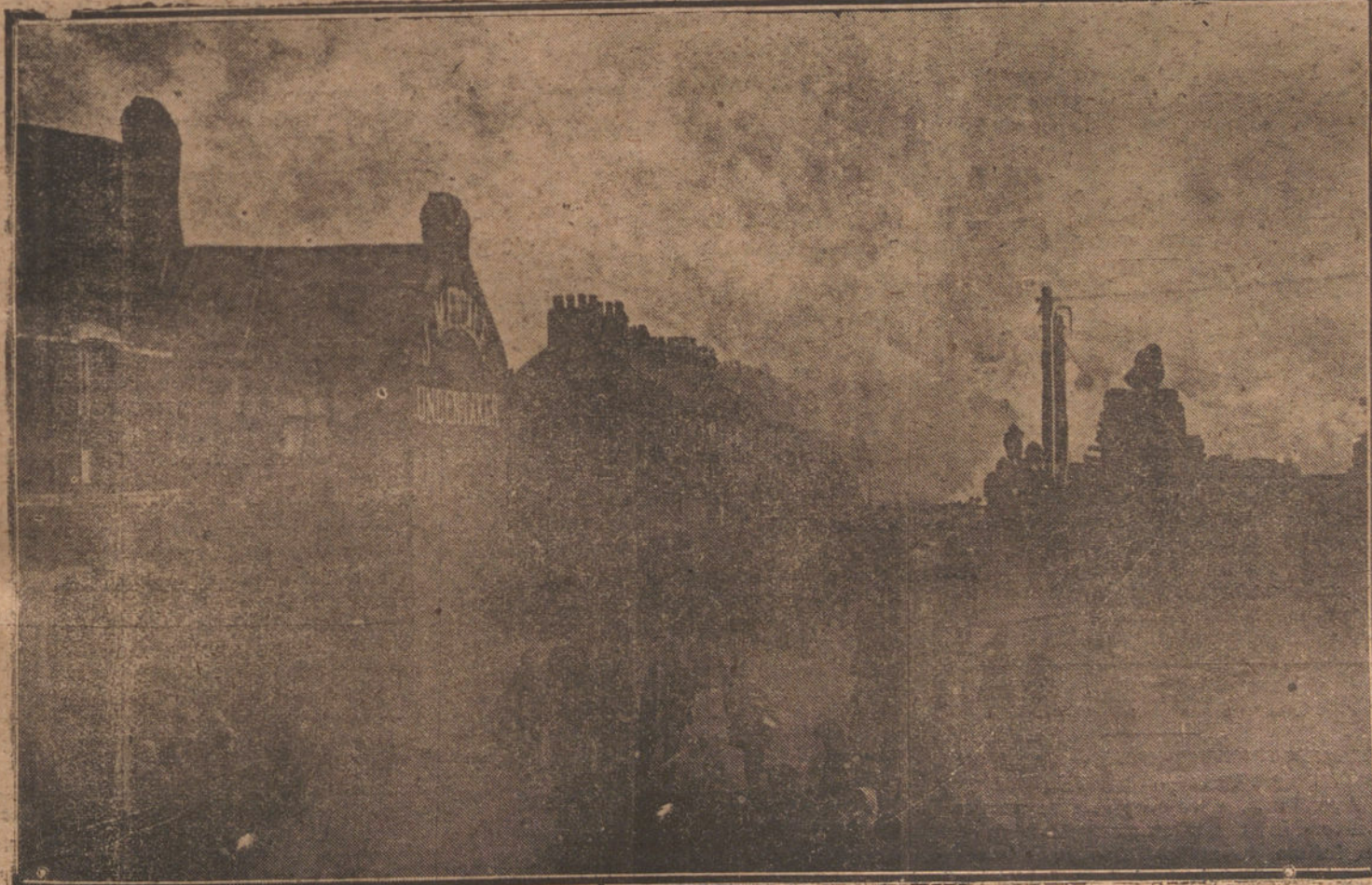
INGLATERRA.—UN ASPECTO DEL INCENDIO DE LA CIUDAD DE HARTLEPOOL, QUE HA DESTRUIDO CINCUENTA CASAS Y OCASIONADO PERDIDAS POR VALOR DE VEINTICINCO MILLONES DE LIBRAS ESTERLINAS