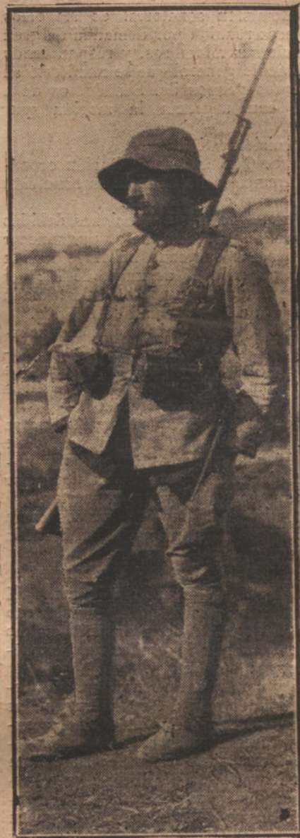
UN CENTINELA VIGILANDO EL CAMPO ENEMIGO EN EL KERT

ne gran importancia, pues establece una línea fortificada que sube por el río Land hasta la divisoria del Sidi Mohan, y siguiendo por la meseta cuya vertiente cae sobre el río Lucus, frente a la posición francesa de Rehana, que se divisa cerca, deja separada la zona occidental al separar las regiones de Gomara y del Rif.