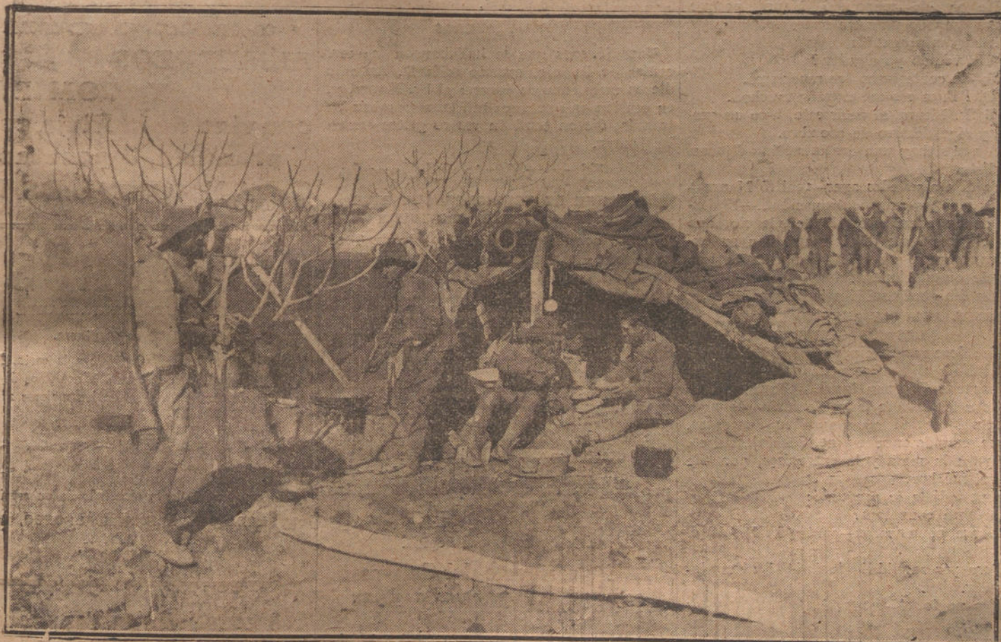
COCINA DE OFICIALES EN EL CAMPAMENTO