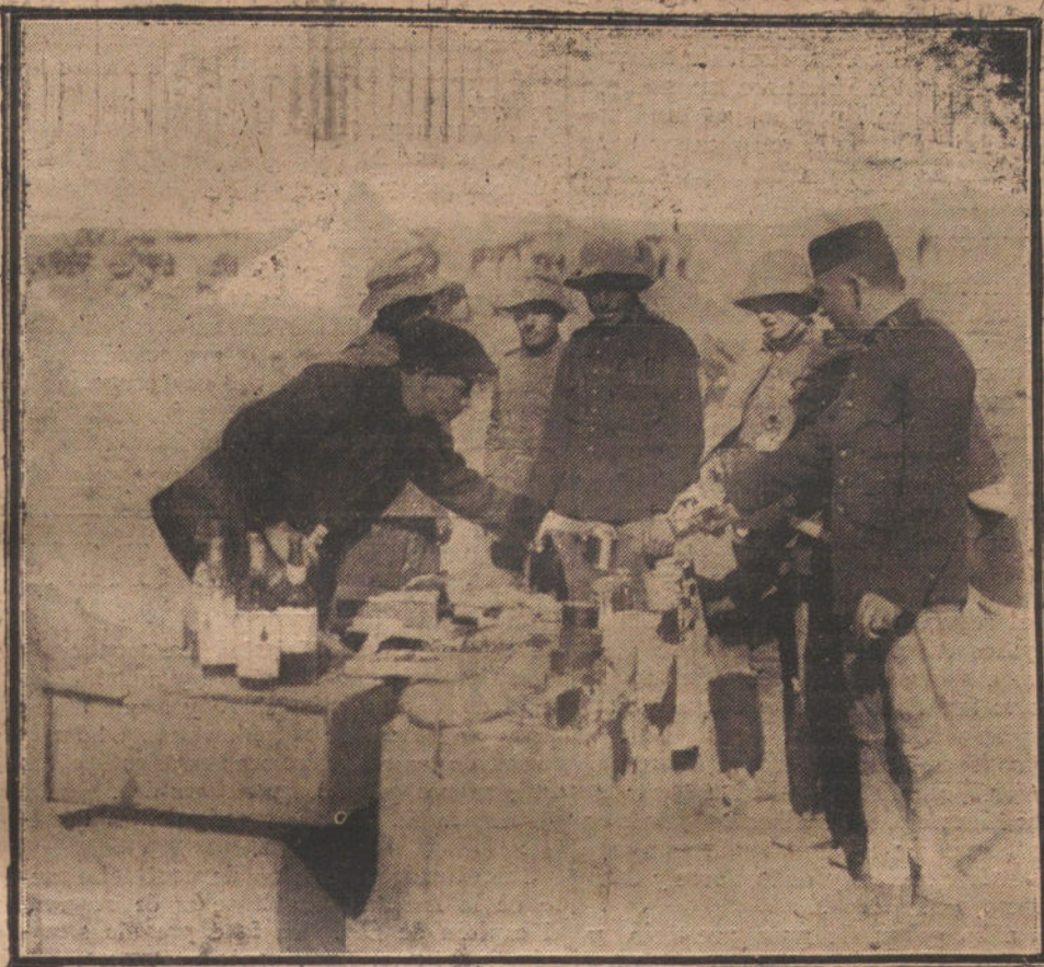
UNA CANCHA EN UN PUESTO AVANZADO

do de los capitanes de Alcántara Liniets y Balmori, dieron la carga gloriosa que ya hemos referido en anteriores despachos.