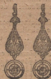
Núm. 10. — Pendientes 4 brillantes y diamantes. Ptas. 575.