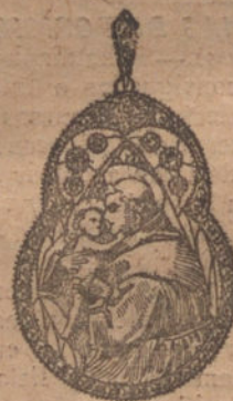
Núm. 5. — Medalla 6 brillantes y diamantes. Ptas. 450.