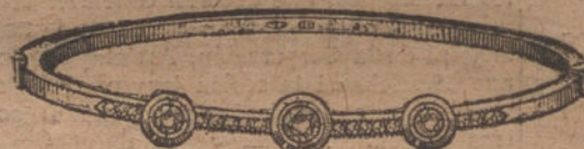
Núm. 3. — Pulsera 3 brillantes y diamantes. Ptas. 425.