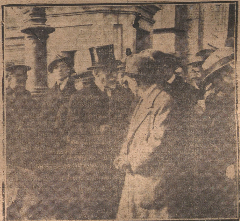
EL PRESIDENTE DIMISIONARIO DEL CONSEJO AL SALIR ESTA MAÑANA DE PALACIO DESPUES DE CELEBRAR UNA CONFERENCIA CON EL REY

PABLO LUNA hará crónicas musicales en LA TRIBUNA