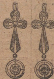
Núm. 8. — Pendientes 6 brillantes y diamantes. Ptas. 475.