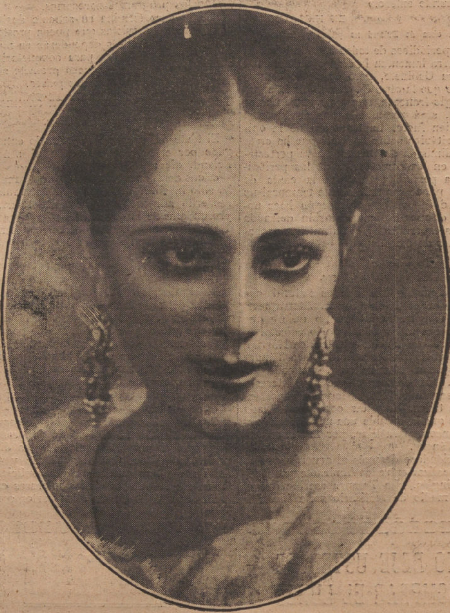
Raquel Meller, soberana, legítima e indiscutible del arte de la canción, que actúa en Maravillas, obteniendo clamorosos éxitos