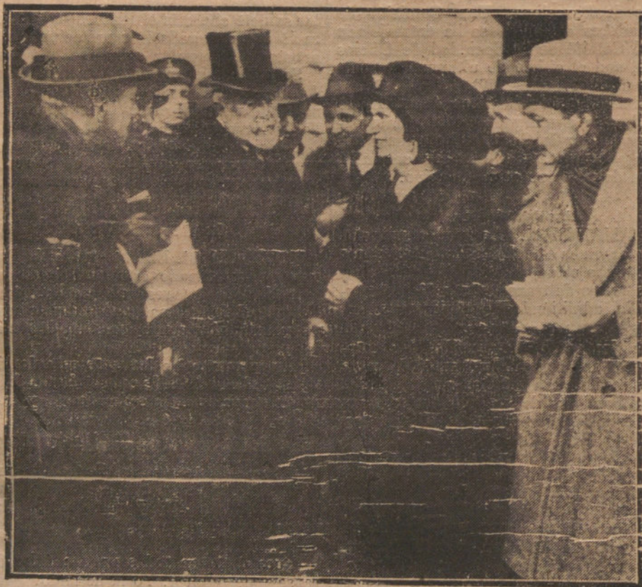
EL SR. CIERVA ENTONANDO SU CANTO A LOS RUISEÑORES Y A LOS PINOS DE MURCIA

El conferenciante fue muy aplaudido por el público, numerosísimo y selecto.