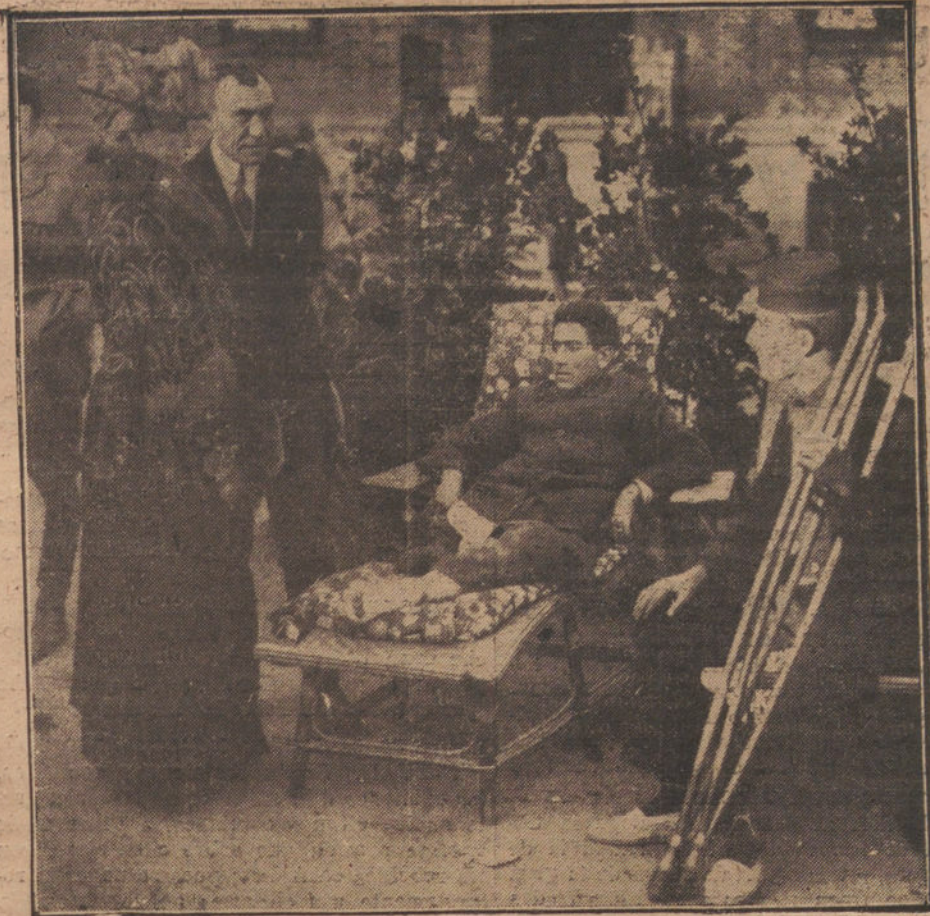
EN EL HOSPITAL DE LA CRUZ ROJA.—SU MAJESTAD LA REINA DONA CRISTINA CONVERSANDO CON LOS SOLDADOS HERIDOS

Este proceso fue instruido en 1918, siendo Gobierno el marqués de Alhucemas, que leñó a los que más se distinguieron en el movimiento.