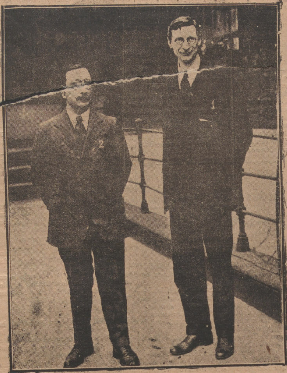
EL SR. DE VALERA (1) DESPUES DE ENTREGAR LOS PODERES AL NUEVO PRESIDENTE DE IRLANDA, MR. ARTHUR GRIFFITH (2)