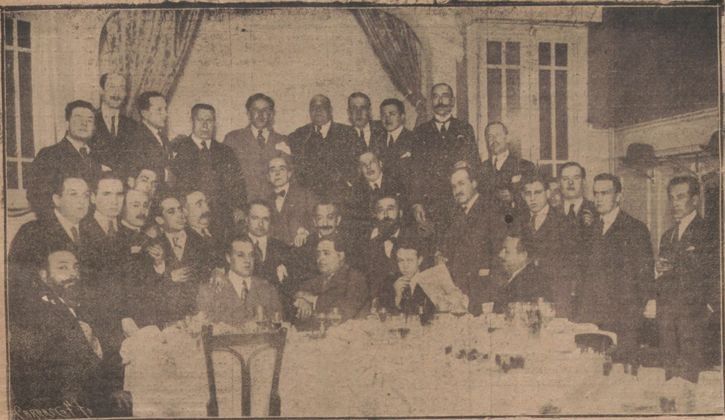
EL GERENTE, EL DIRECTOR Y LOS REDACTORES DE «LA TRIBUNA», REUNIDOS EN BANQUETE INTIMO EN LOS BURGALSES, PARA FESTEJAR EL COMIENZO DE LA NUEVA ETAPA DE NUESTRO PERIÓDICO