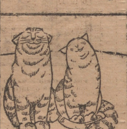
NOCHE DE ENERO