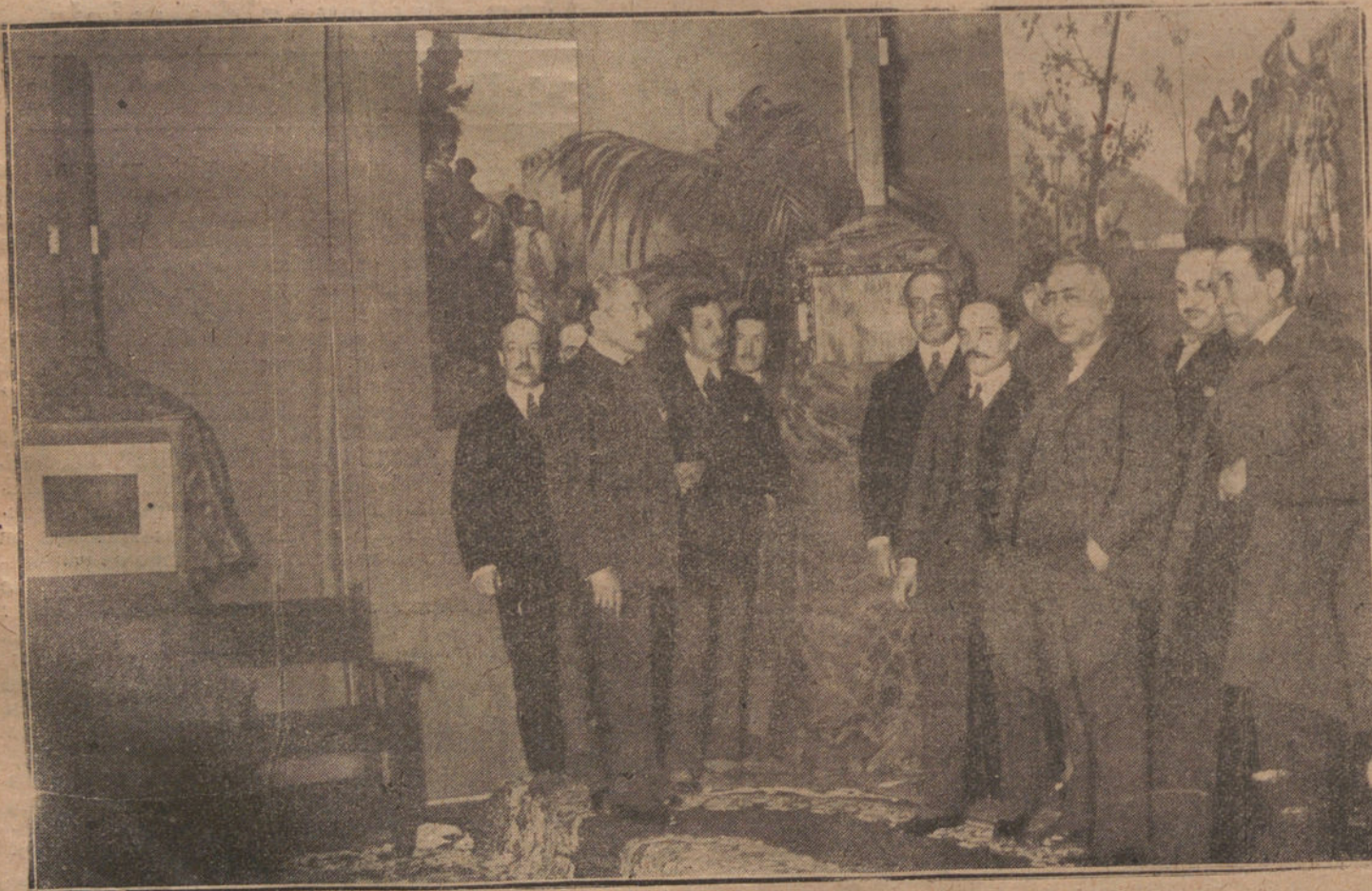
“INAUGURACION DE LA QUINCENA DE GOYA” CELEBRADA AYER TARDE