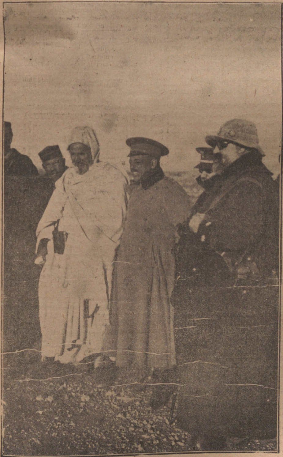
EL COMANDANTE GENERAL SANJURJO, EN DAR-DRIUS. PRESENCIANDO LA ENTRADA DE LAS COLUMNAS