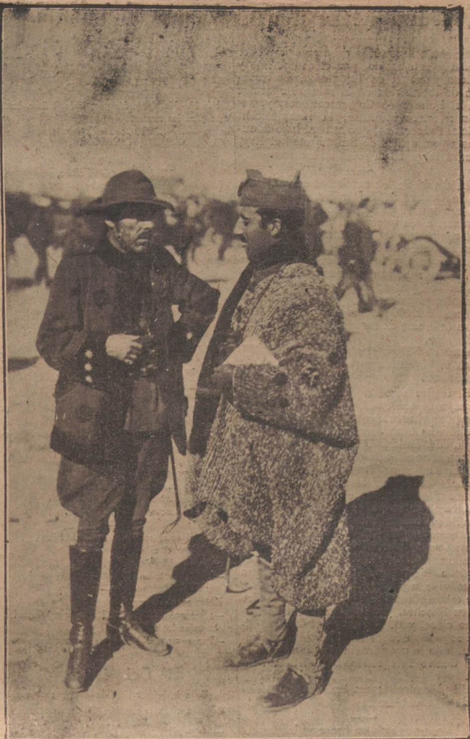
EL COMANDANTE DEL TERCIO, SR. FRANCO, RECIBIENDO ORDENES EN DAR-DRIUS

Continuaba diciendo que era necesario y urgente crear en los dos países un estado de opinión que representara una buena dosis de voluntad por parte de todos, con el