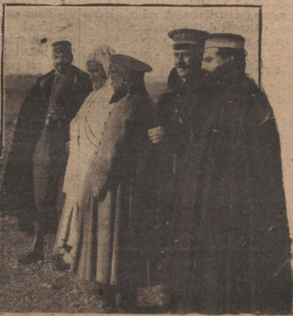
EL GENERAL SANJURJO CON SU ESTADO MAJOR, FRENTE A DAR-DRIS