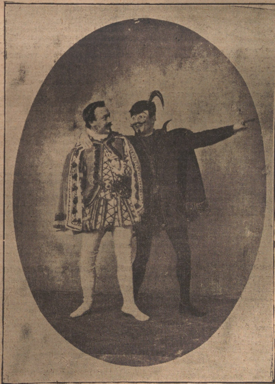
BAJO EL DISFRAZ DE FAUSTO Y MENISTOFELAS ALIENTAN DOS FIGURAS GLO- RIOSAS DEL ARTE DRAMÁTICO ESPAÑOL: RAFAEL CALVO, EL MAS FIRME PUN- TAL DEL TEATRO ROMANTICO, Y VICTORINO TAMAYO Y BAUS, INIMITABLE CREADOR DEL YORIK DE «UN DRAMA NUEVO»

go que «La hoja de parral» y por toda mutación de boca una «juicia». ¡No hay derecho!