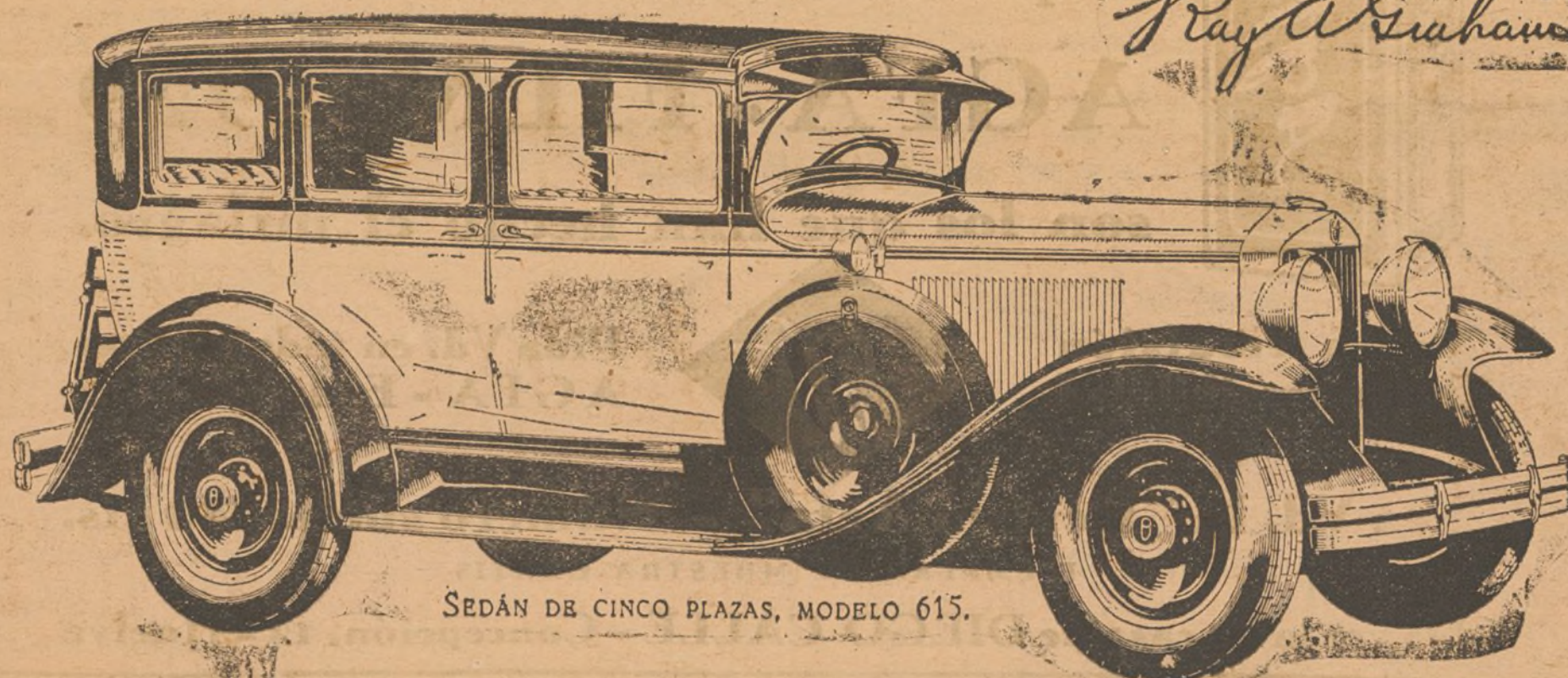
SEDÁN DE CINCO PLAZAS, MODELO 615.