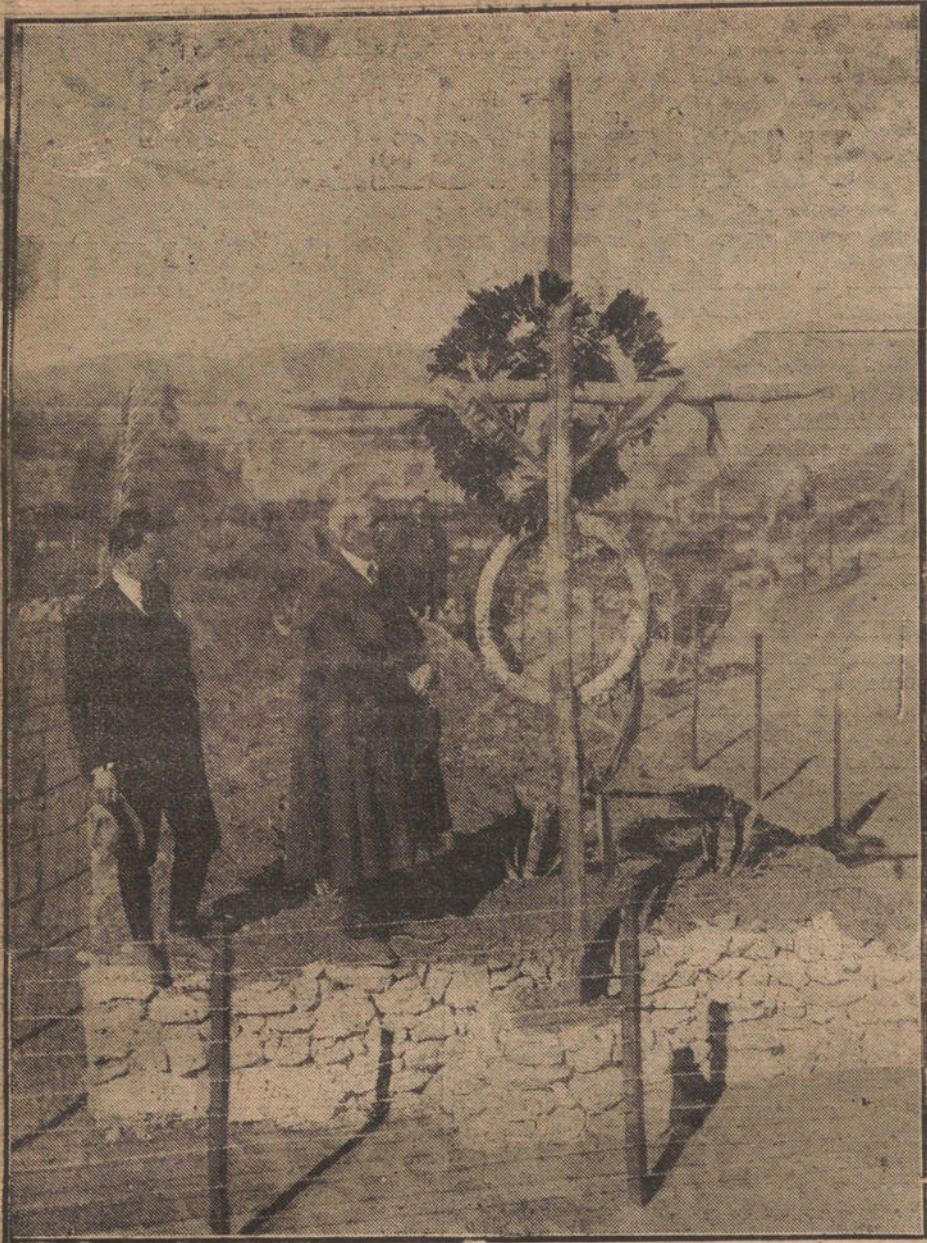
EL ALCALDE DE MANZANARES VISITA NDO LAS TUMBAS DE MONTE ARRUIT