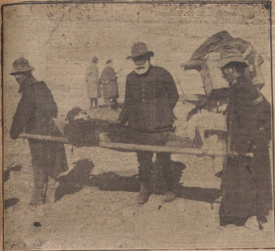
EL GENERAL CABANELLAS ANIMANDO A UN SOLDADO GRAVEMENTE HERIDO EN UNO DE LOS ULTIMOS COMBATES