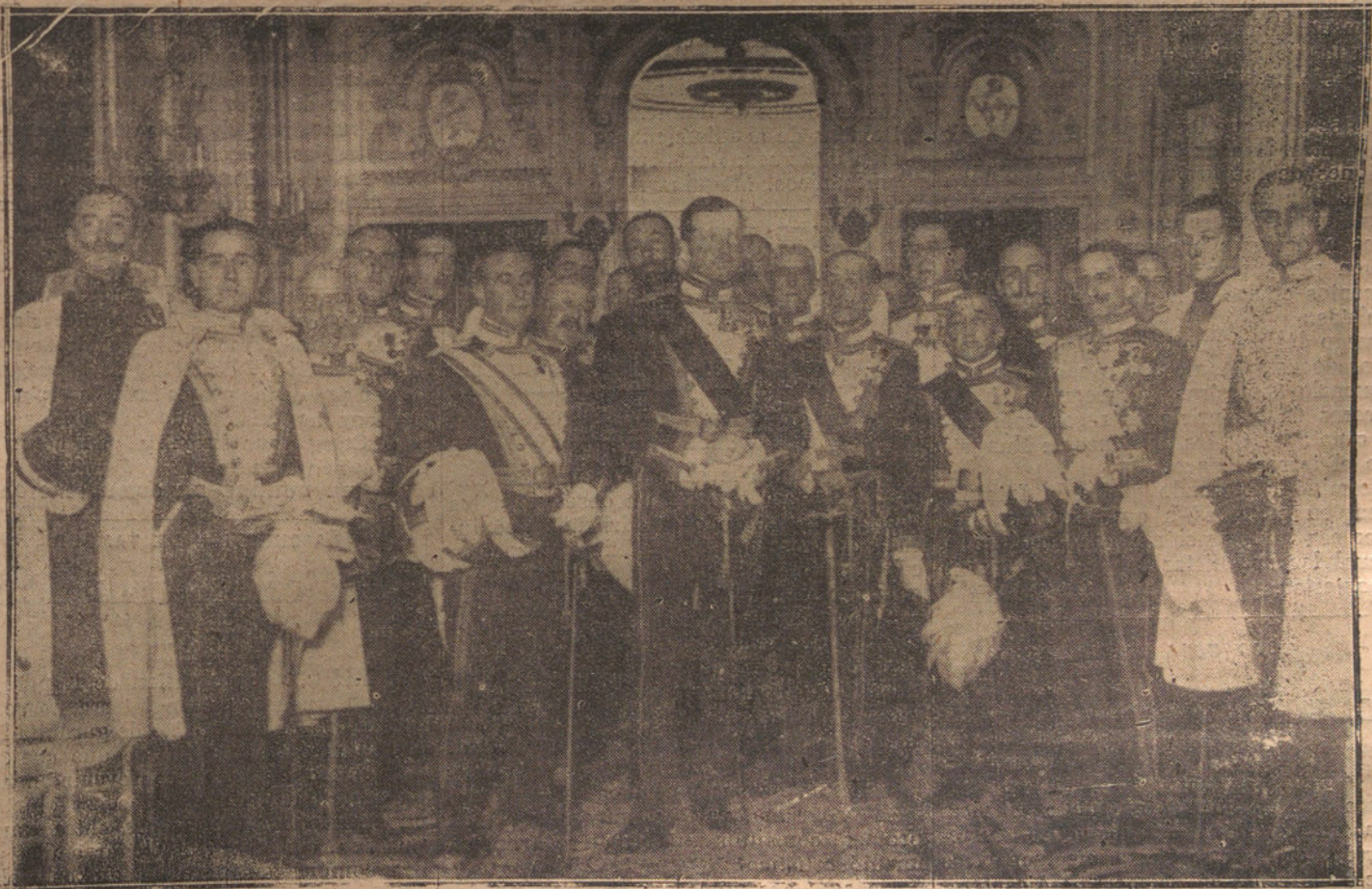
LOS CABALLEROS HIJOSDALGO DE LA NOBLEZA DE MADRID, REUNIDOS EN EL PALACIO DEL INFANTE D. FERNANDO, BAJO LA PRESIDENCIA DE ESTE, PARA DAR POSESION A LOS CABALLEROS RECIENTEMENTE ADMITIDOS EN LA CORPORACION.

EL NUMERO DEL TELEFONO DE «LA TRIBUNA» ES EL M.21-21. LLAMENOS SIEMPRE QUE NECESITE ALGO DE NUESTRO PERIODICO