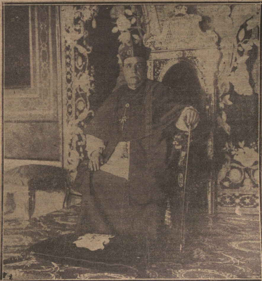
EL CARDENAL ARZOBISPO DE TOLEDO, PRIMADO DE ESPAÑA, EMINENTISIMO SEÑOR DON ENRIQUE ALMARAZ, FALLECIDO AYER EN MADRID

Mientras esperamos que el próximo Conclave designe sucesor al morado Pontífice,