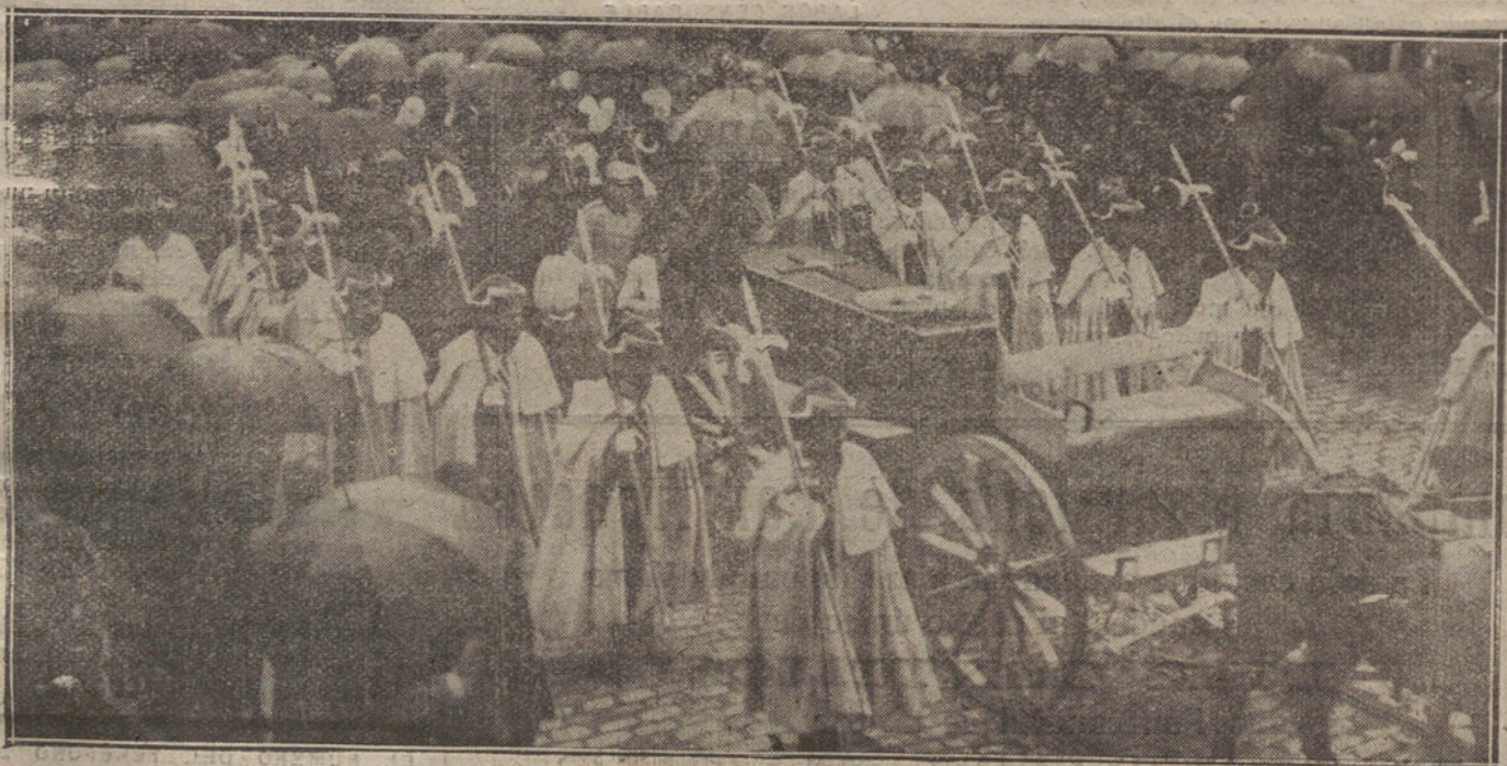
REMOQUE DE ARTILLERIA EN QUE FUERON CONDUCHOS A LA ESTACION DEL MEDIO DIA LOS RESTOS DEL CARDENAL PRIMAÑO

ADVERTIMOS AL PUBLICO QUE NO DEVOLVEMOS LOS ORIGINALES QUE ESPONTANEAMENTE SE NOS REMITAN, Y QUE, EN NINGUN CASO, MANTENDREMOS CORRESPONDENCIA ACERCA DE :: :: :: EL 99 :: ::