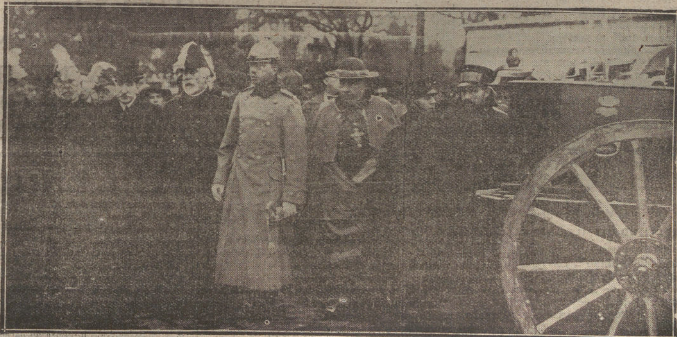
LA PRESIDENCIA DEL DUELO.—EL INFANTE D. FERNANDO, EL CARDENAL AZOBISPO DE BURGOS DOCTOR BEULLOCH Y LOS SRES. MAURA, CIERVA Y SANCHE GUERRA