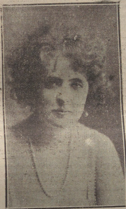
HORTENSIA GELABERT, NOTABLE PRIMERA ACTRIZ DEL TEATRO REY ALFONSO