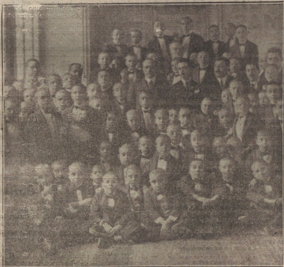
EL DIRECTOR, LOS PROFESORES Y LOS ALUMNOS DEL COLEGIO DE SAN ILDEFONSO, DESPUES DE CELEBRAR AYER LA FIESTA EN HONOR DE SU PATRONO

A la estación acudió a despedirlos multitud de público, familias de los mozos soldados y gran número de jefes y oficiales. Una banda militar ejecutó antes de partir el tren varias piezas, entre ellas, «La canción del soldado».