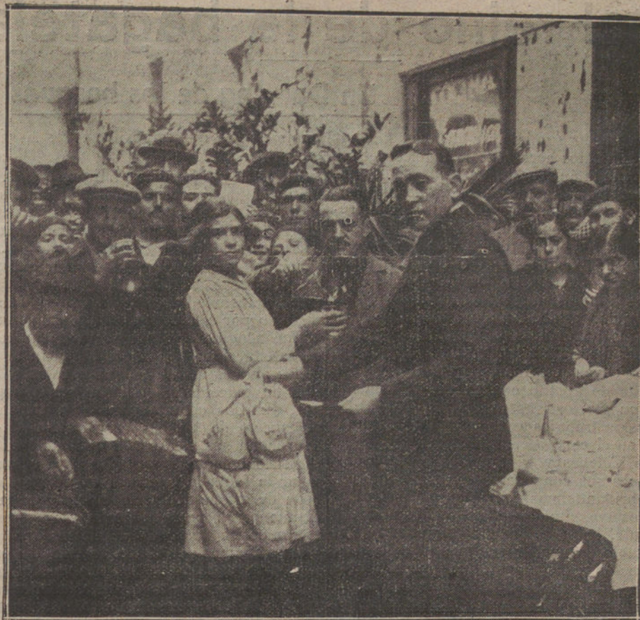
REPARTO DE COMIDAS A LOS POBRES POR EL DUEÑO DEL POPULAR CLUB GUERRITA, CON MOTIVO DEL SANTO DE SU MAJESTAD EL REY