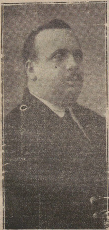
EL DIPUTADO SOCIALISTA INDALICIO PRIETO