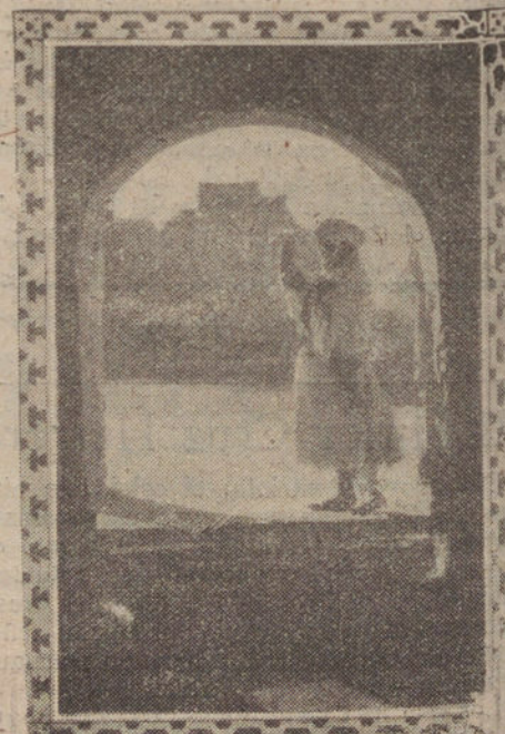
MORA SALIENDO DEL MORABO DESPUES DEL REZO