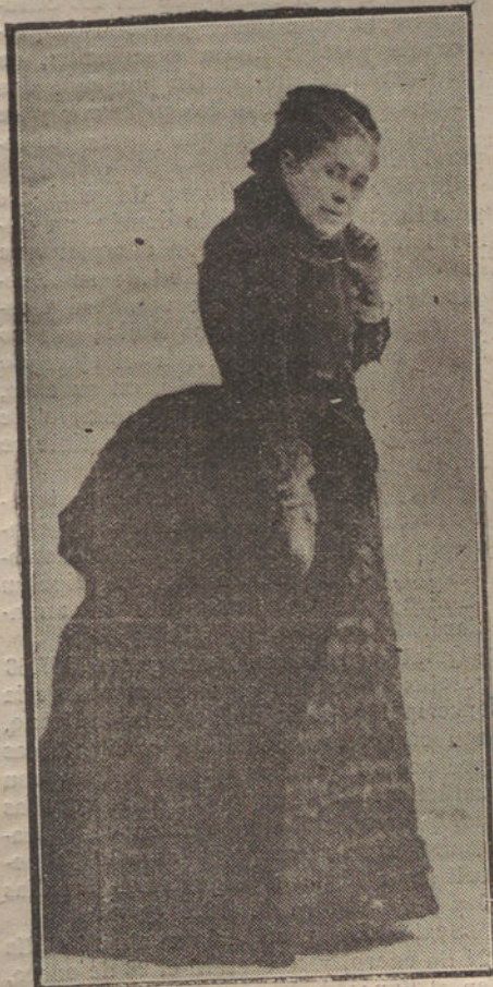
TEODORA LAMADRID, INIMITABLE CREADORA DE «ANGELA», «ADRIANA», «VIRGINIA», «LOCURA DE AMOR», «EL TANTO POR CIENTO», «EL TEJADO DE VIDRIO», «UN HOMBRE DE MUNDO» Y TANTAS OTRAS JOYAS DEL TEATRO ESPAÑOL EN EL SIGLO XIX

con el puño de plata y marfil. Y una galga de pelo brillante, cierra el broche de la evocación, cuando, presa de un miedo expectante, se levanta, en silencio, el telón.