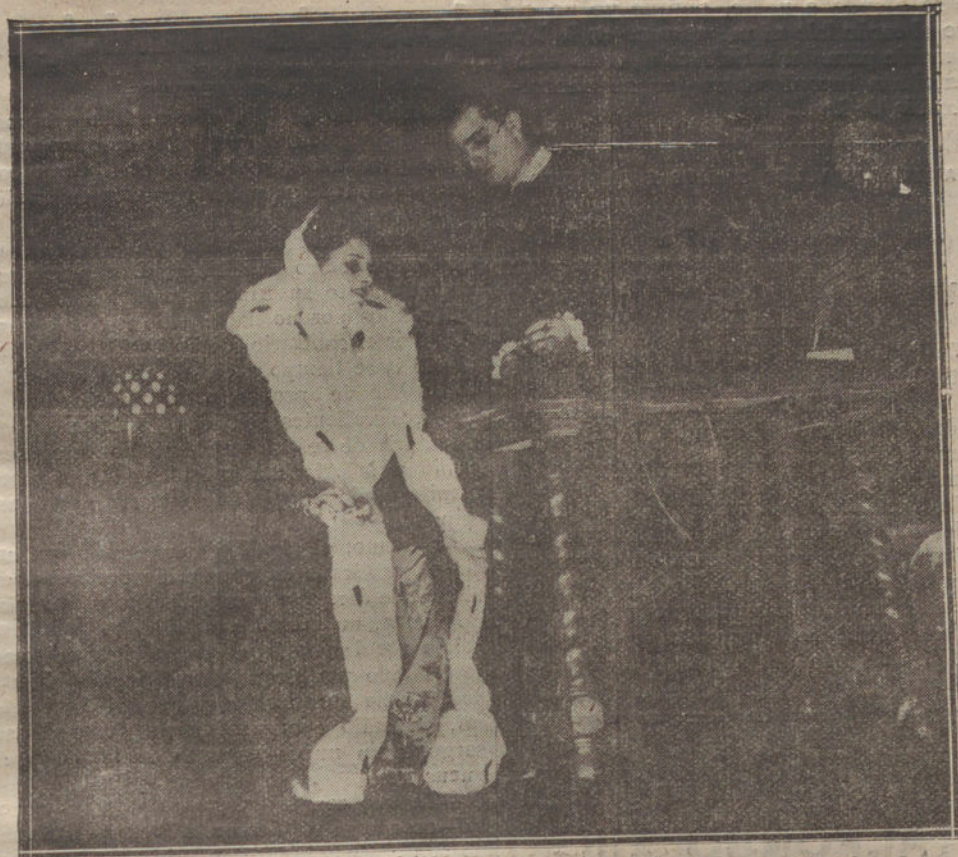
UNA ESCENA DEL TERCER ACTO DE «LA DAMA DEL ARMIÑO»

que remata en un arco apuntado. Dividiendo la escena, da entrada al taller un zaguán, que en el muro se recorta por fuera, cual fauce de un dragón que acechase en lo oscuro. Junto al negro zaguán se abre el hueco de una airosa ventana con reja, que, al través de una clara vidriera, a los rayos de luz paso deja. Como a modo de un escaparate, el orfebre, en la airosa ventana, tiene expuestas sus joyas mejores de incrustados y de filigrana. En el fondo hay un horno encendido, y a la mano siniestra una puerta, que da entrada al hogar del orfebre y que está por la sombra encubierta. La otra parte de escena, es la calle. En el barrio de la Judería tiene el hosco carácter villano que tomase de su artesanía.