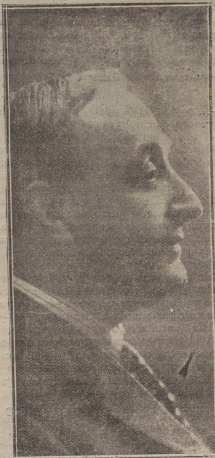
EMILIO THUILLIER, UNO DE LOS MAS ALTOS PRESTIGIOS DE LA ESCENA ESPAÑOLA CONTEMPORANEA

Arrieta y tantos autores ilustres que pusieron todo su entusiasmo y gastaron todas sus energías en crear nuestra incomparable zarzuela española!