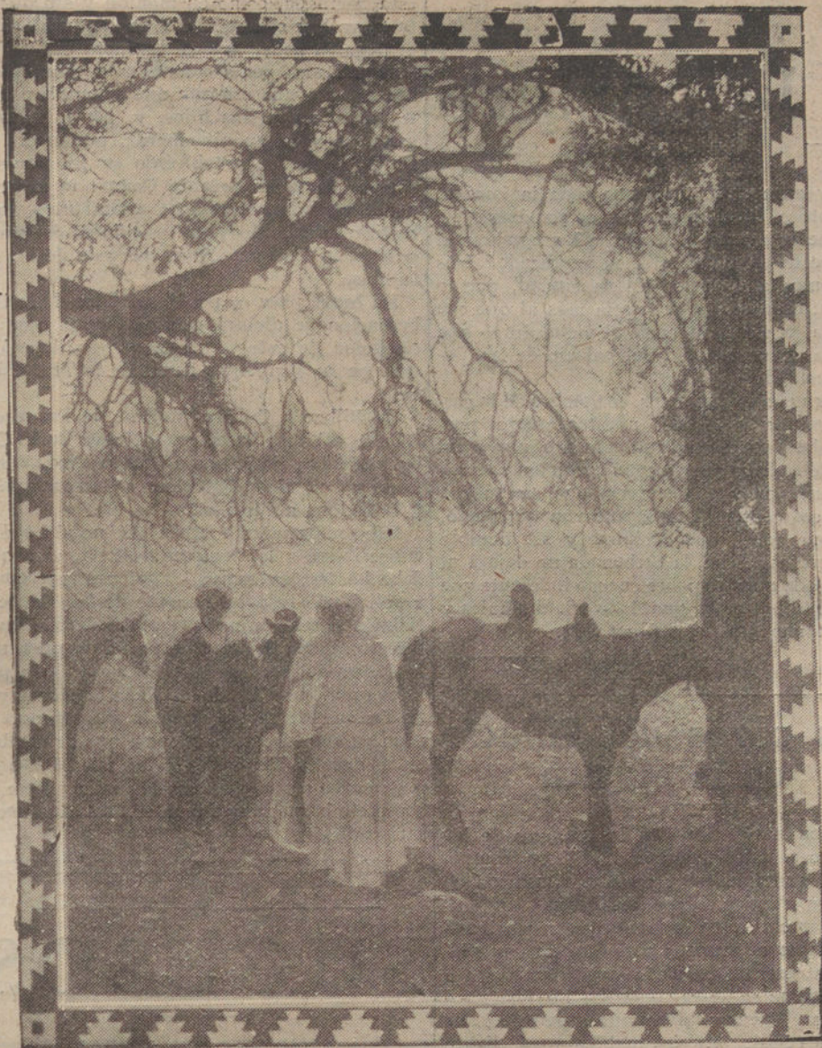
EL NUEVO CAID DE QUEBDANA, MULEY BUSFAA, DESIGNADO PARA TAN IMPORTANTE CARGO POR SU BUEN COMPORTAMIENTO DURANTE LOS SUCESOS JULIO

Por iniciativa del alcalde se telegrafió a los Reyes de Inglaterra, felicitándoles.