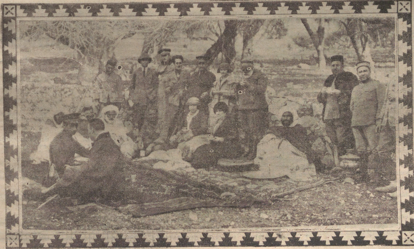
LA MARQUESA DEL MERITO CON LOS GENERALES CABANELLAS Y FRESNEDA, EN LA AGUADA DE ZAIO, TOMANDO EL TE A QUE FUERON INVITADOS POR EL CAID DE QUEBDANA

La excursión por aquellos parajes durará varios días.