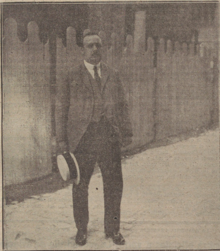
... Y DESDE QUE EL VERANO ULTIMO ME HICIERON LAS PRIMERAS PROPOSICIONES, NO HE DEJADO DE PENSAR QUE LAS OBRAS LITERARIAS TIENEN TANTA IMPORTANCIA COMO CUALQUIERA OTRA...

Nos da pena ver la angustia del señor Prieto, que se aburre, se aburre de una manera denodada y heroica. A fuerza de