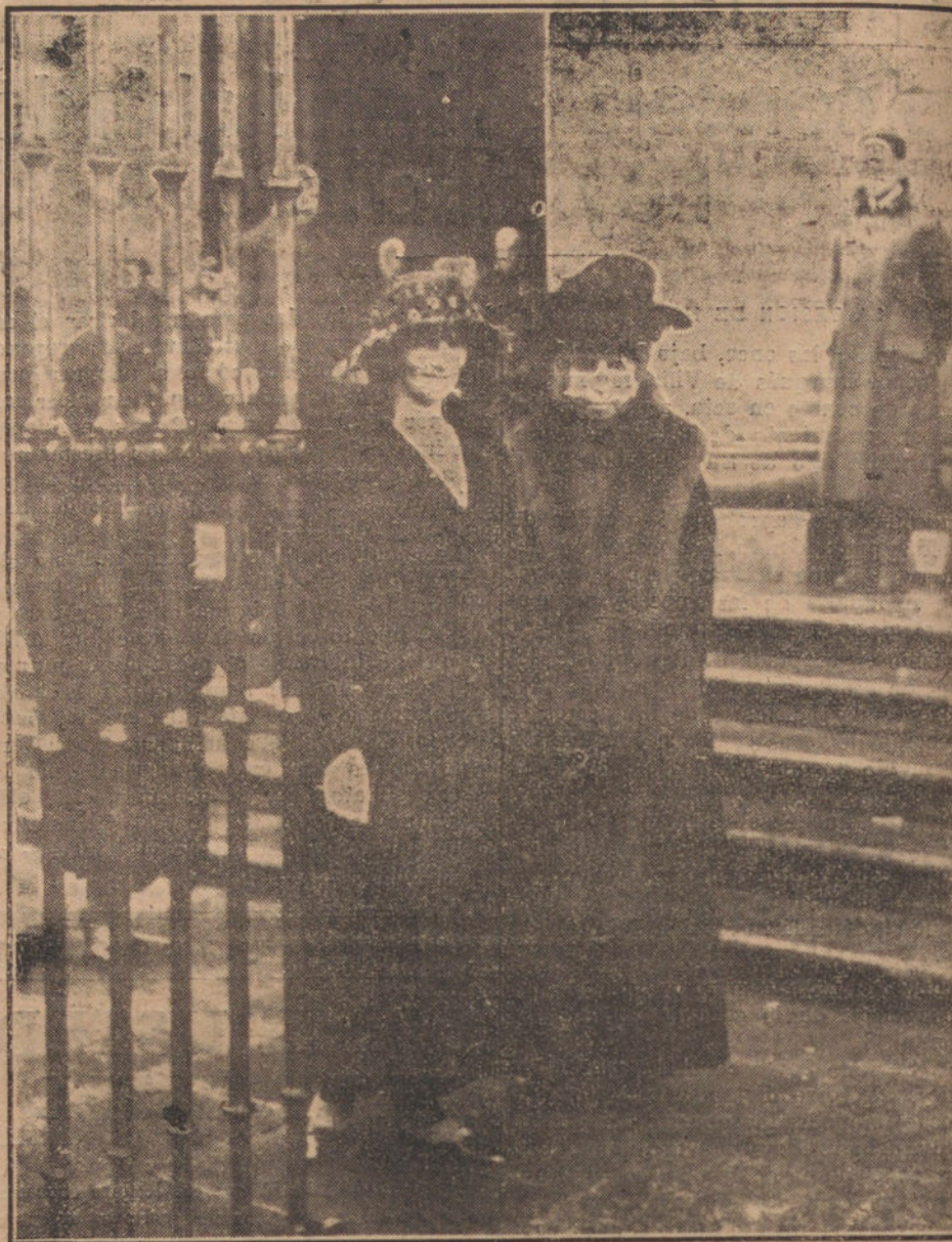
LA EX EMPERATRIZ ZITA, ACOMPAÑADA DE LA REINA DOÑA CRISTINA, AL SALIR ESTA MAÑANA DE SAN FRANCISCO EL GRANDE

Abría marcha la Cruz Alzada, seguía el féretro, rodeado por los guardias nobles, los cardenales, los dignatarios palatinos y el Cuerpo diplomático, siendo trasladado aquí