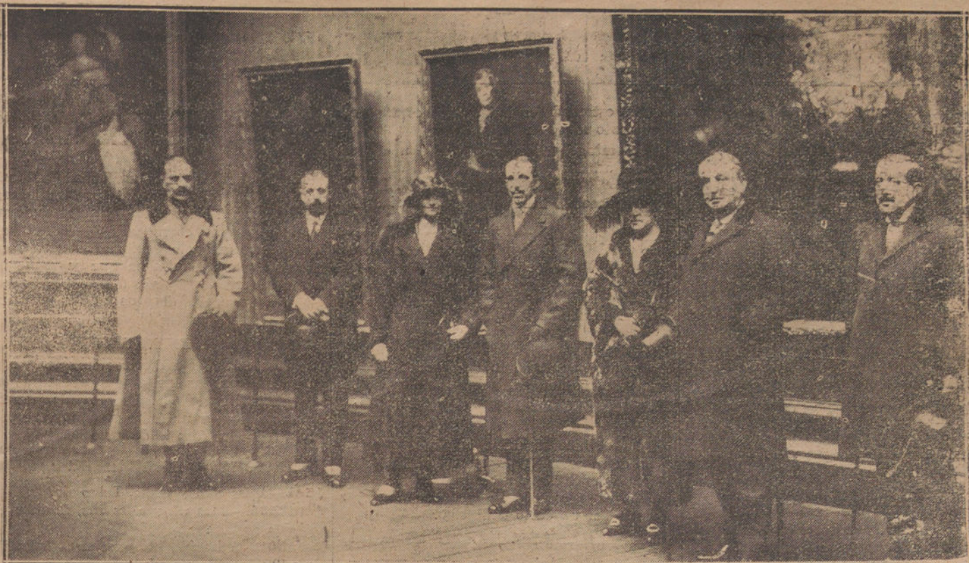
LA EX EMPERATRIZ ZITA EN LA SALA DE VELAZQUEZ, DURANTE LA VISITA QUE HIZO AYER AL MUSEO DEL PRADO.

Se asegura que el marqués de la Frontera ha presentado al Gobierno un informe sobre la reglamentación del juego.