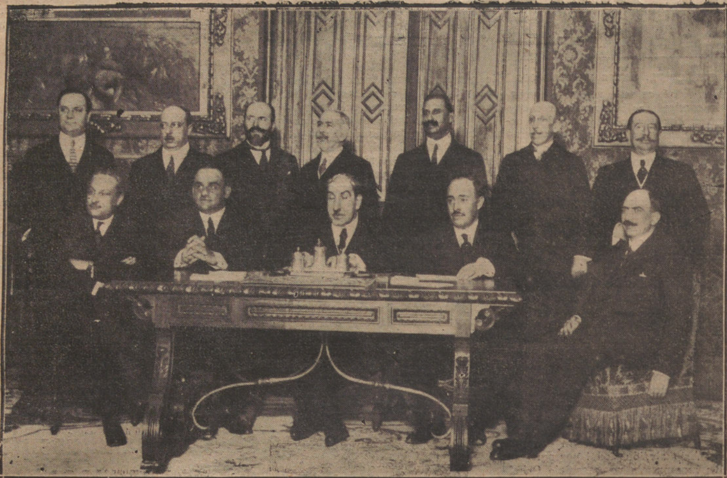
PRIMERA REUNION DE LA COMISION QUE ENTIENDE EN LOS TEMAS PARA LA PROXIMA CONFERENCIA INTERNACIONAL DE GENOVA