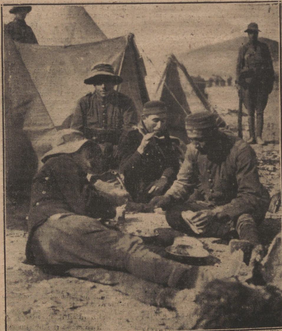
SOLDADOS DEL REGIMIENTO DEL REY COMIENDO EL RANCHO EXTRAORDINARIO CON QUE FUERON OBSEQUIADOS EL DIA DEL SANTO DE SU MAJESTAD