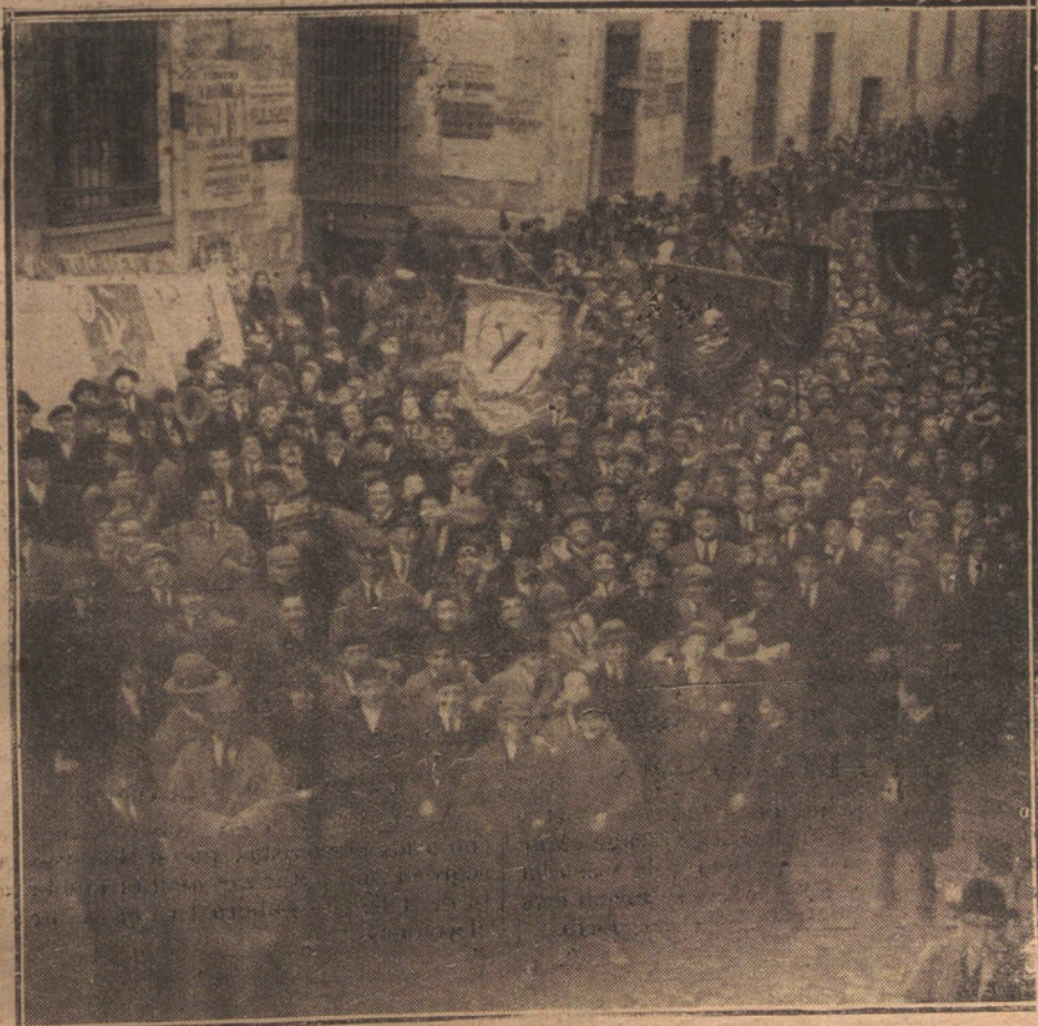
LA MANIFESTACION ESTUDIANTIL DIRIGIENDOSE AL MINISTERIO DE INSTRUCCION PUBLICA PARA ENTREGAR LAS CONCLUSIONES ACORDADAS