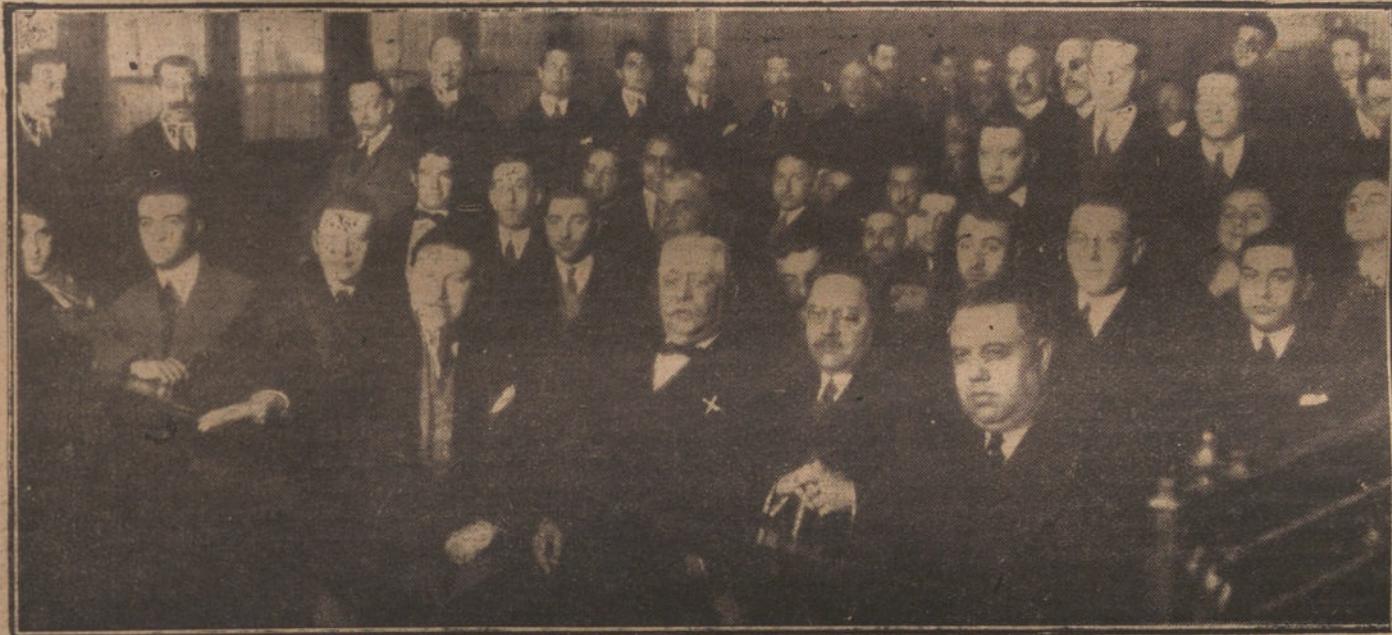
EL DECANO DE LA FACULTAD DE DERECHO Y CATEDRATICO DE LITERATURA JURIDICA, QUE HA SIDO JUBILADO Y HOY EXPLICO SU ULTIMA CLASE EN LA UNIVERSIDAD CENTRAL

RECORDAMOS A NUESTROS LECTORES QUE NO DEVOLVEMOS LOS ORIGINALES QUE SE NOS ENVIEN ESPONTANEAMENTE, NI SOSTENEMOS CORRESPONDENCIA ACERCA DE ELLOS