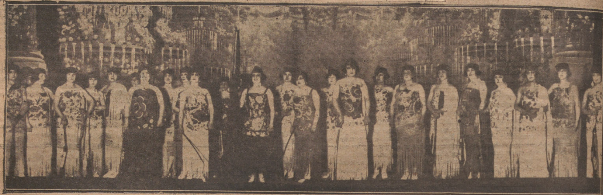
LAS TIPLES Y COROS DE LOS TEATROS DE MADRID EN LA CANCIÓN DE LA «BANDERITA», UNO DE LOS NUMEROS DE LA FUNCION CELEBRADA A BENEFICIO DE LOS SOLDADOS MADRILEÑOS DEL EJERCITO DE AFRICA