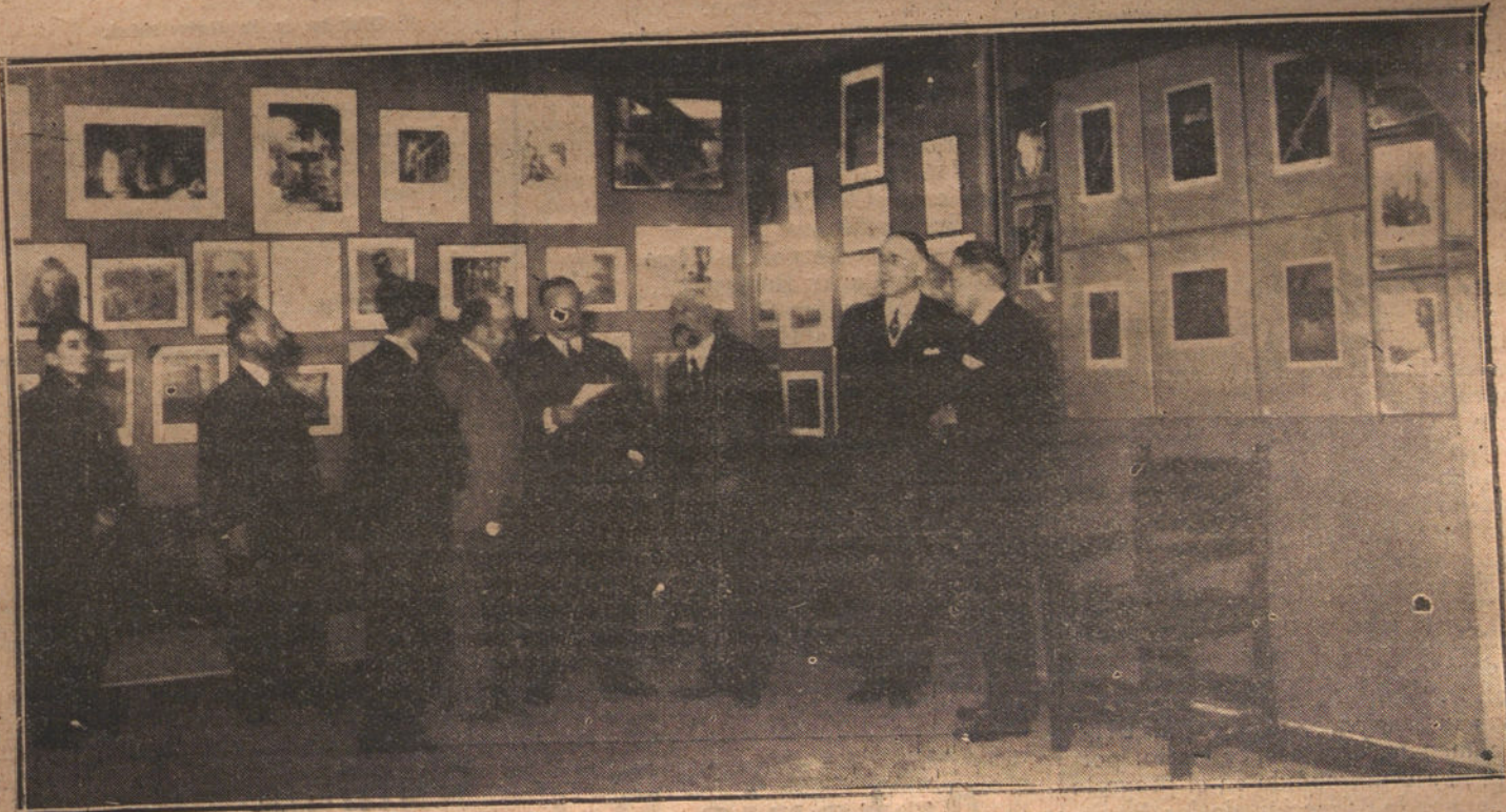
INAUGURACION DE LA EXPOSICION DE FOTOGRAFIAS EN EL SALON DEL CIRCULO DE BELLAS ARTES