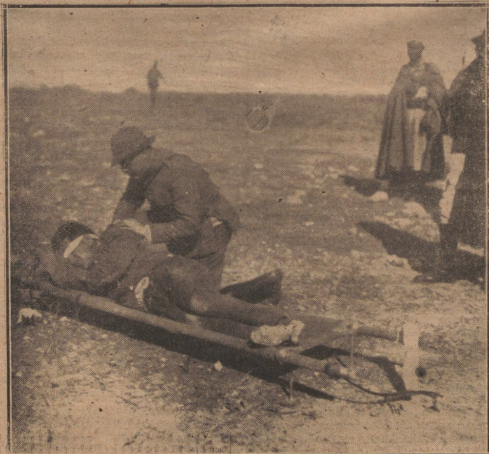
ESTAMPAS DE LA GUERRA—CURANDO A UN HERIDO EN LA LINEA DE FUEGO

OPPELN 6. Los registros llevados a cabo en Gleiwitz han dado por resultado la detención del director de los talleres de ferrocarriles y el director de las fábricas donde fueron descubiertas las armas ocultas.