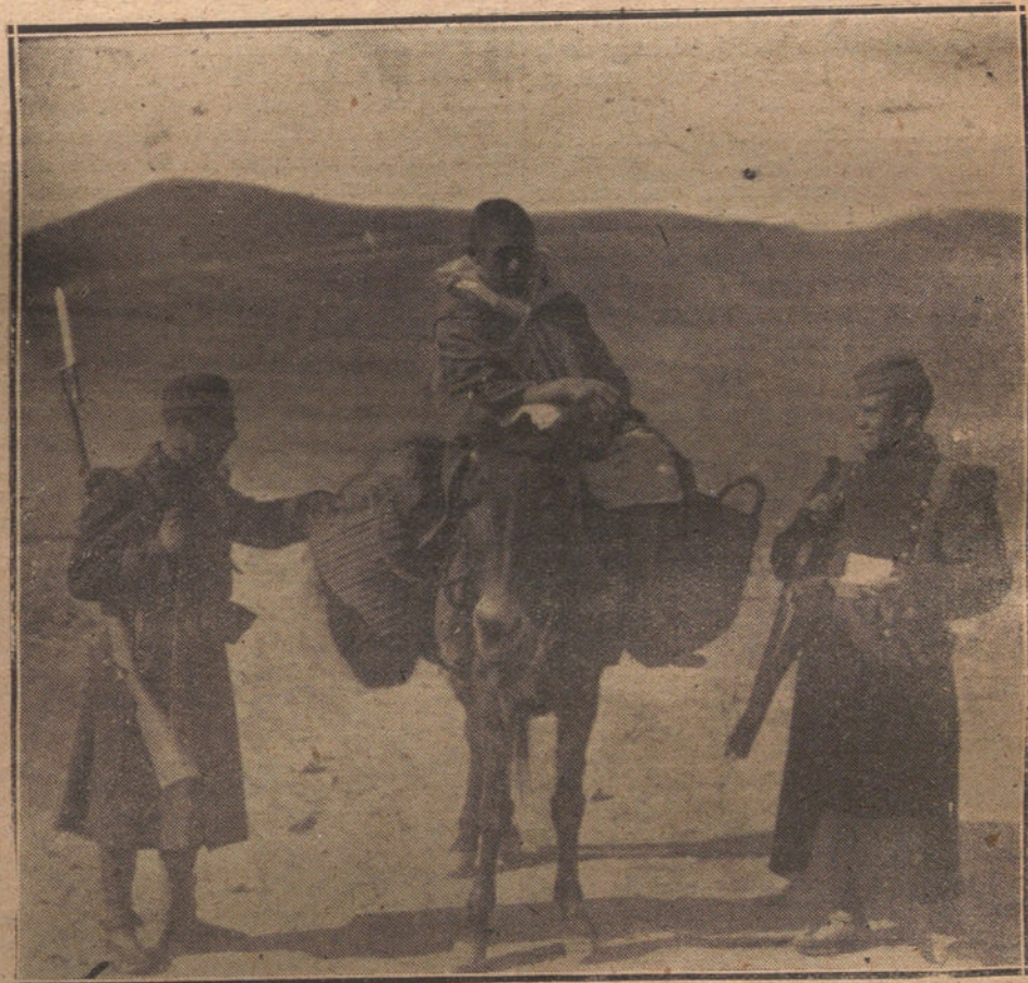
ESTAMPAS DE LA GUERRA.—REGISTRANDO A UN «MORO AMIGO»

Finalmente se acordó enviar un telegrama a los socialistas alemanes, declarando que con motivo de su ausencia, la Conferencia terminará hoy lunes, y que la próxima reunión se celebrará en fecha muy próxima en Francfort, donde se procederá a la discusión definitiva y se adoptarán decisiones en su consecuencia.