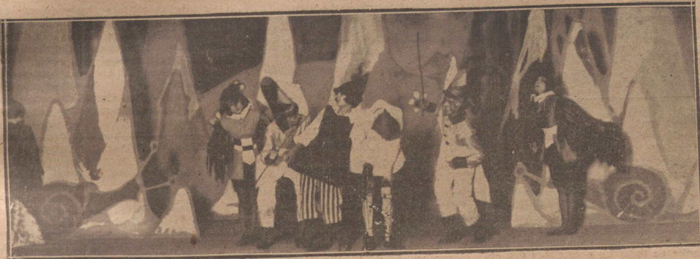
TEATRO PARA LOS NIÑOS.—UNA ESCENA DEL «VIAJE A LA ISLA DE LOS ANIMALES», ESTRENADO EN ESLAVA