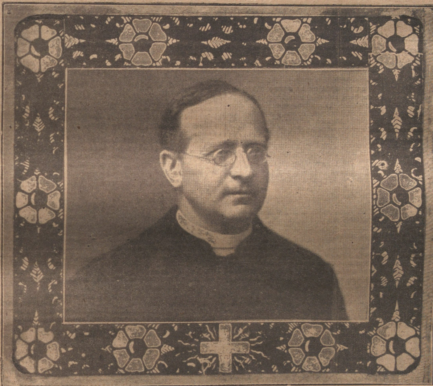
SU SANTIDAD PÍO XI (Cardenal Aquiles Ratti)

El nuevo Papa elegido por el Cónclave en la votación de esta mañana, es el car-