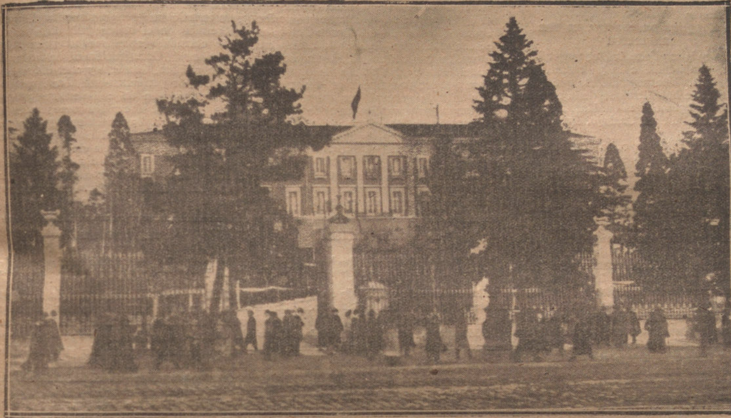
HE AQUÍ AL MINISTERIO DE LA GUERRA, DONDE TRIUNFA EL CRITERIO DE CONTINUAR LA LUCHA EN MARRUECOS, HASTA QUE LOGRE DOMINAR EL PEÓN DE ALHUCEMAS

Una de Maura, otra de Cierva y otra del marqués de Cortina