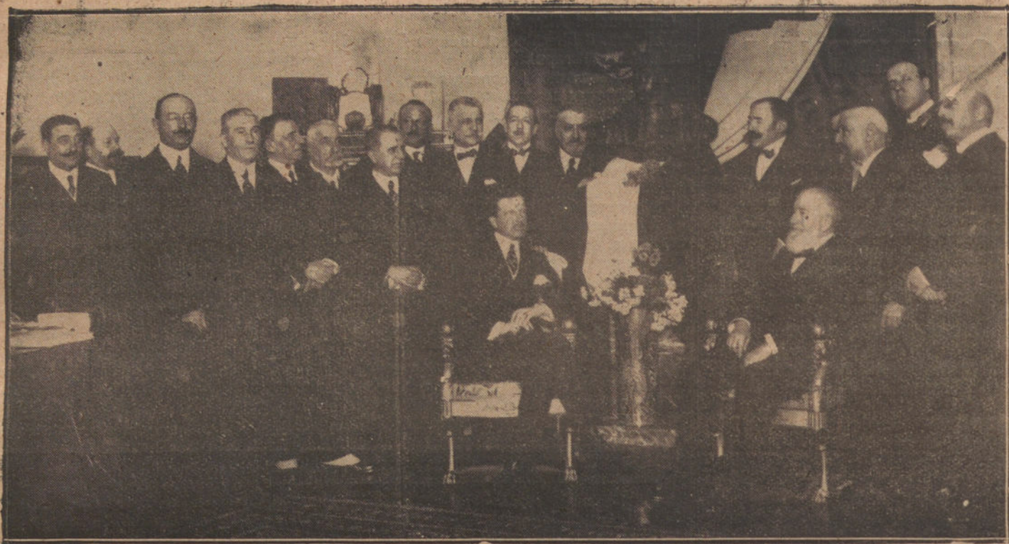
ACTO DE ENTREGAR AL EX MINISTRO DE CHILE EN ESPAÑA, SR. FERNÁNDEZ BLANCO, UN BUSTO DEL REY ALFONSO XIII, QUE LE REGALAN SUS AMIGOS