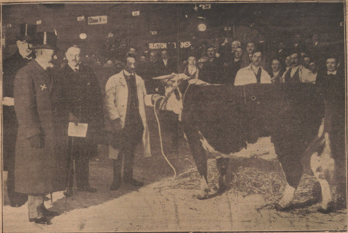
LONDRES.—EL REY DE INGLATERRA (X) VIENDO LOS EJEMPLARES BOVINOS QUE HA ENVIADO A LA EXPOSICIÓN DE GANADOS DEL SALÓN DE AGRICULTURA

A su distinguida familia enviamos nuestro sentido pésame en tan doloroso trance. Descanse en paz el ilustre hombre público.