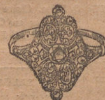
Núm. 8.—Sortija 5 brillantes y dia- mantes. Plas. 650.