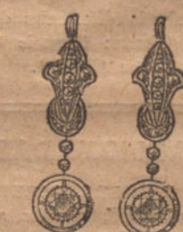
Núm. 4.—Pendien- tes 8 brillantes y diamantes. Plas. 650.