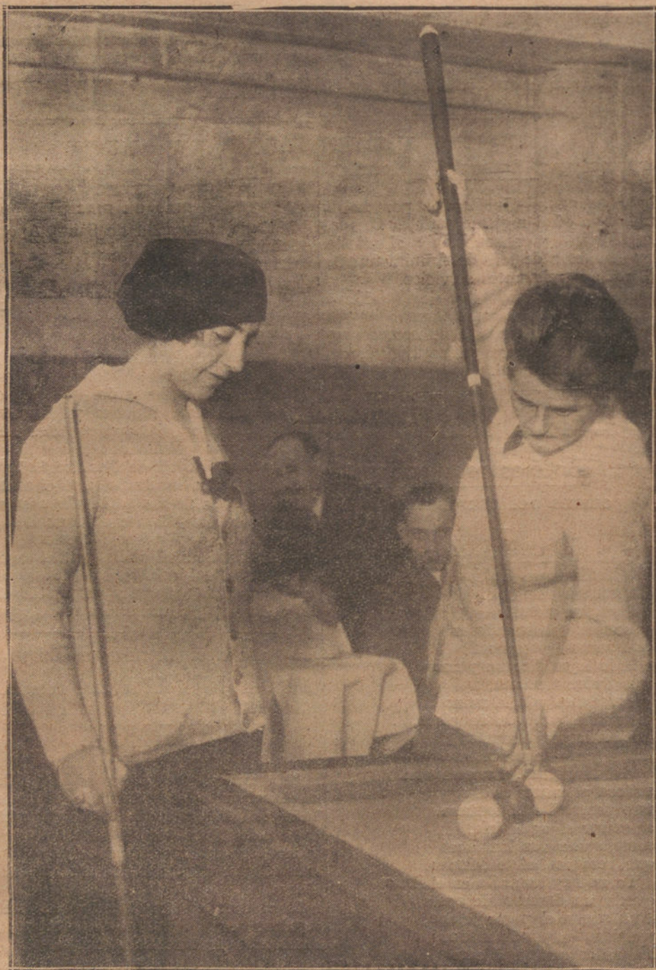
BERLIN.—CAMPEONATO MUNDIAL FEMENINO DE BILLAR. LAS SENORITAS CAMPEONES DE HOLANDA Y SUIZA. DURANTE EL PARTIDO EN QUE SE DISPUTARON EL CAMPEONATO

homenaje a los insignes artistas María Guerrero y Fernando Díaz de Mendoza. Es de esperar que ese homenaje se lleve pronto a efecto...»