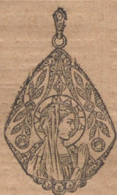
Núm. 1.—Medalla 5 bri- llantes y diamantes. Plas. 450.

con brillantes de primera calidad :-: Diamantes rosas de Holanda :-: Monturas de platino fino y oro de ley 18 quilates, contrastado.