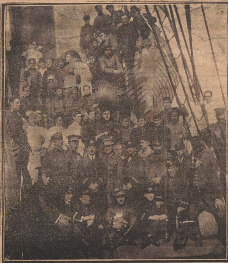
LA DOTACION DEL NUEVO BUQUE-HOSPITAL «BARCELO», CEDIDO PARA ESTE FIN POR LA TRANSMEDITERRANEA