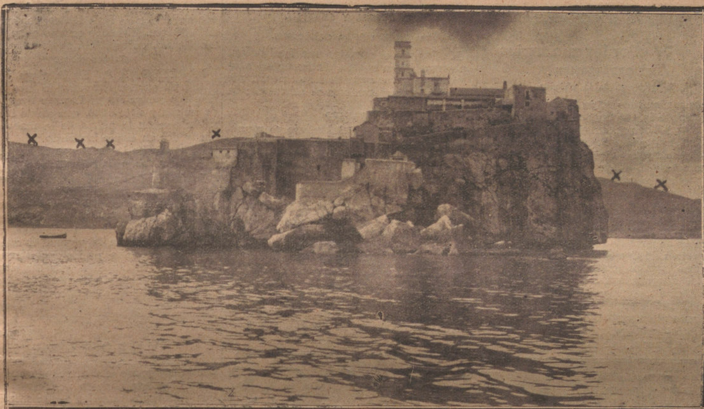
AL FONDO Y MARCADAS CON ASPAS SE DISTINGUEN CLARAMENTE LAS COSTAS DE AXDIR, OCUPADAS POR EL ENEMIGO. ELLO INDICA QUE EL DOMINIO DE ALHUCEMAS NO PUEDE HACERSE MAS QUE POR MAR