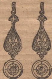
Núm. 2.—Pendien- tes 4 brillantes y diamantes. Plas. 575