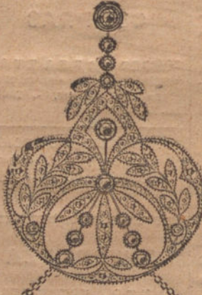
Núm. 3.—Pendentif 12 brillantes y diamantes. Plas. 850.