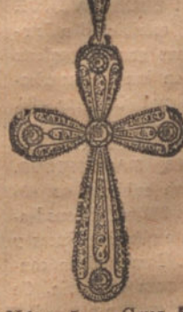
Núm. 5.—Cruz 5 brillantes y dia- mantes. Plas. 450.