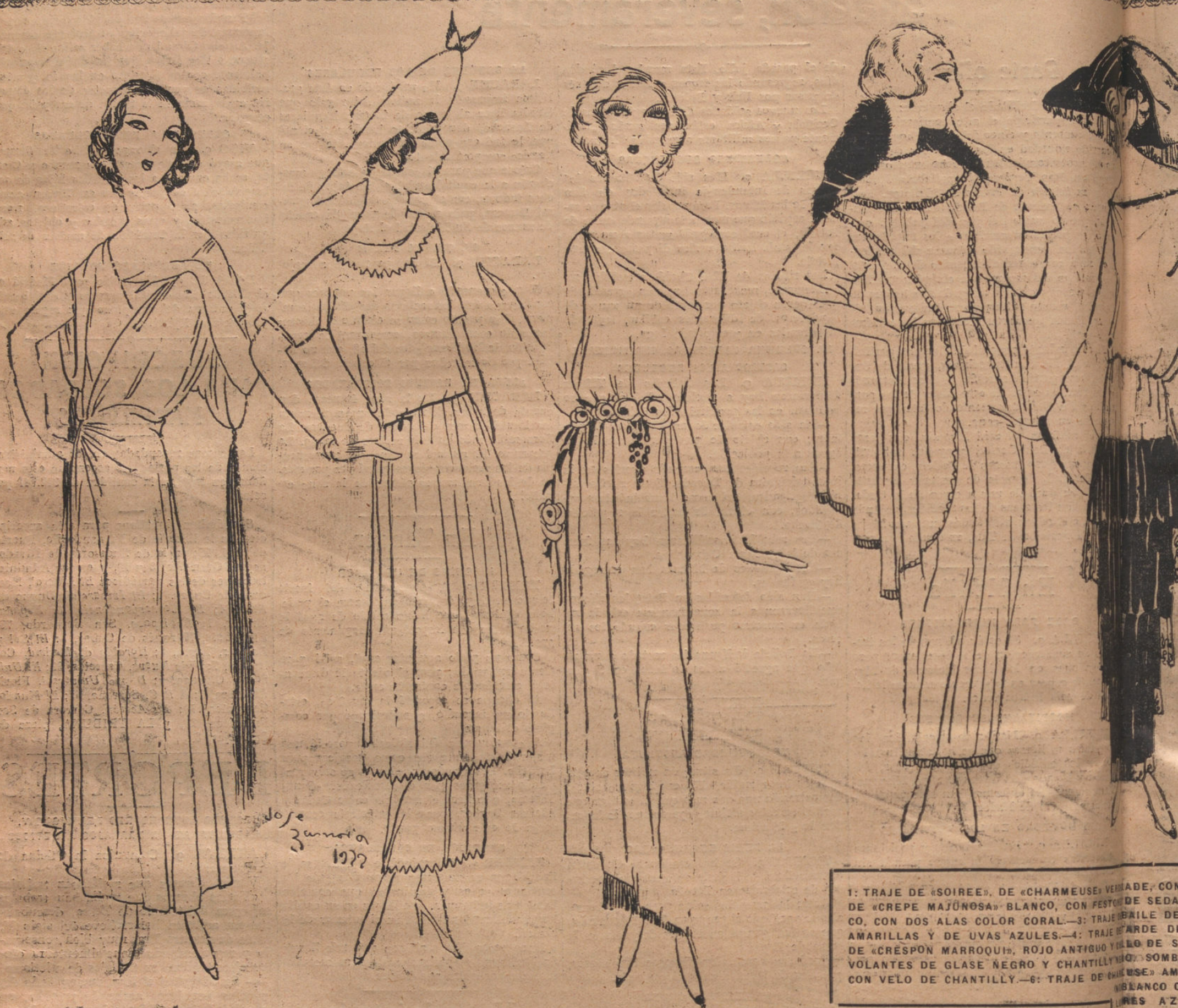
1: TRAJE DE «SOIREE». DE «CHARMEUSE» VERMATE, CON DE «CREPE MAJUNOSA» BLANCO, CON FLETON DE SEDA CO. CON DOS ALAS COLOR CORAL.—3: TRAJE DE «BAILE DE AMARILLAS Y DE UVAS AZULES.—4: TRAJE DE «ARDE DE DE «CRÉSPON MARROQUIN», ROJO ANTIGUO Y LILLO DE S VOLANTES DE GLASE NEGRO Y CHANTILLY.—5: SOMB CON VELO DE CHANTILLY.—6: TRAJE DE «CHARMEUSE» AM BLANCO C

I En la casa de modas de M. Henry, el célebre modisto, que hace pagar diez mil pesetas por un harapo con su firma, y que según su capricho de tiranuelo transforma a las elegantes en emperatrices legendarias, en danzarinas del «meke» taitiano, en Amazonas de la Frouda o en aldeanas de Zeelandia. M. Henry, en el que se alían extrañamente una barba de pirata, un perfil de judío ruso, una silueta majestuosa de sátrapa y una elegancia muy 1860, está entregado a la meditación más trascendental, de pie ante su enorme y auténtica mesa de trabajo estilo Imperio, agobiada de dibujos, de muestras de telas fastuosas, de collares, de pieles y de perfumes. Ante él, y también de pie, respetuosamente, están las «vendedoras»—Mlles. Melisanda, Alice, Germaine, Madeleine, Nora—vestidas como para un coro de ópera, con sus «chemises» de raso negro y sus collares de abar, y la gracia traslúcida y demasado