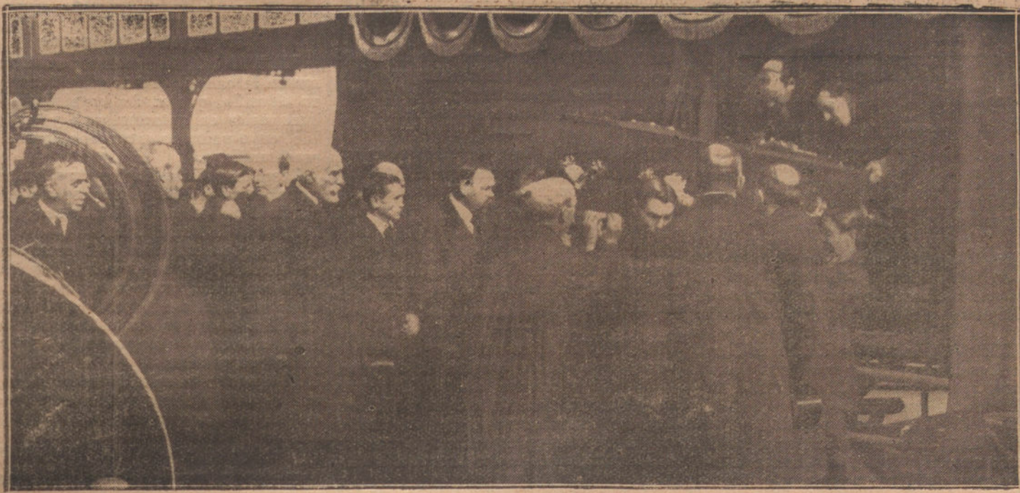
MOMENTO DE SACAR EL FERETRO DEL FURGON PARA SER TRASLADADO A LA CARROZA FUNEBRE.