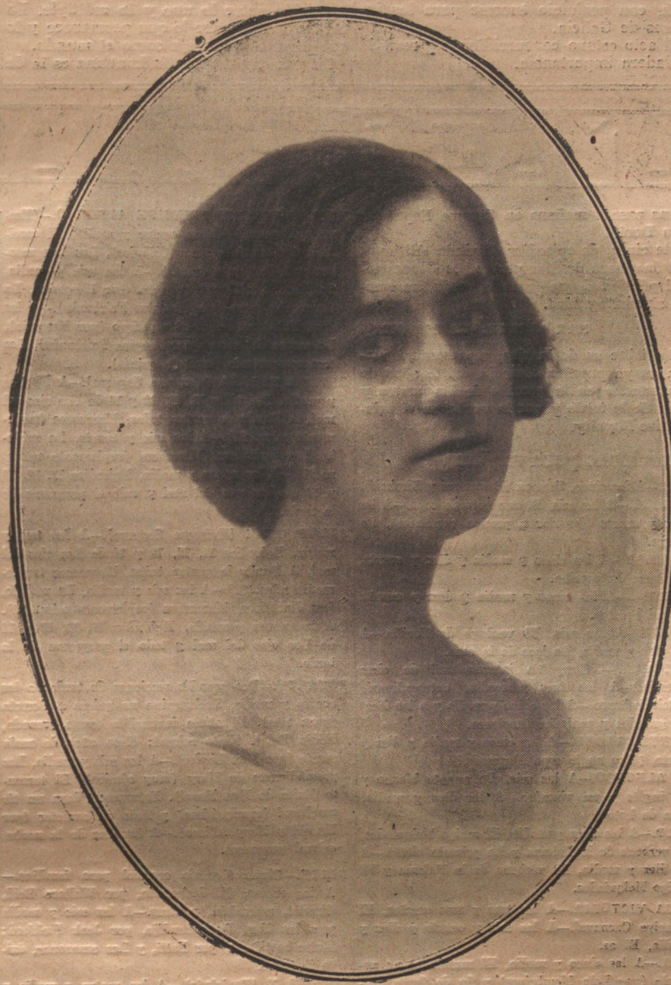
GLORIA DE ESPAÑA