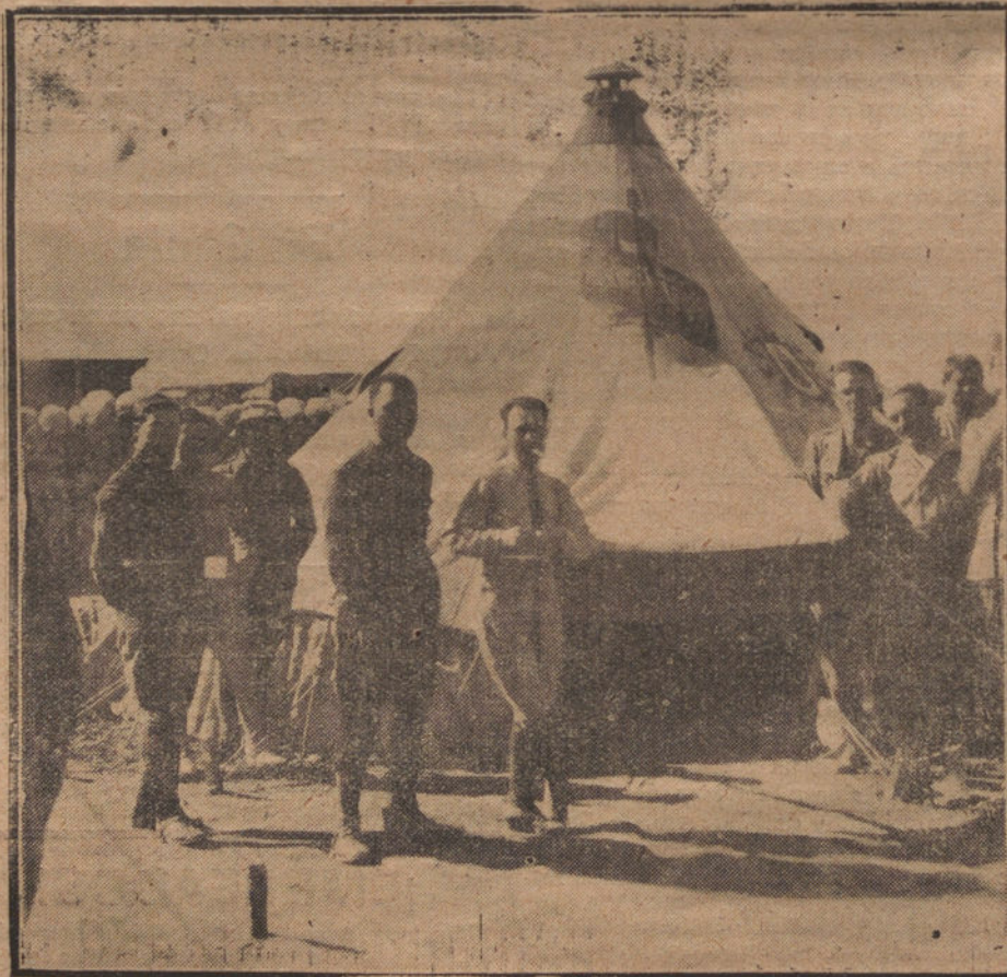
UNA DE LAS TIENDAS DE CAMPAÑA REGALADAS POR SUSCRIPCION POPULAR AL EJERCITO DE OPERACIONES EN AFRICA

Perdone, señor alcalde, la extensión de esta carta y el procedimiento que empleo; pero como nada existe oculto en este mundo, bastaría saber mi nombre para tener a todos los alquiladores de casas en contra mía, y, sin remedio, tendría que emigrar de Madrid.—Un peregrino.