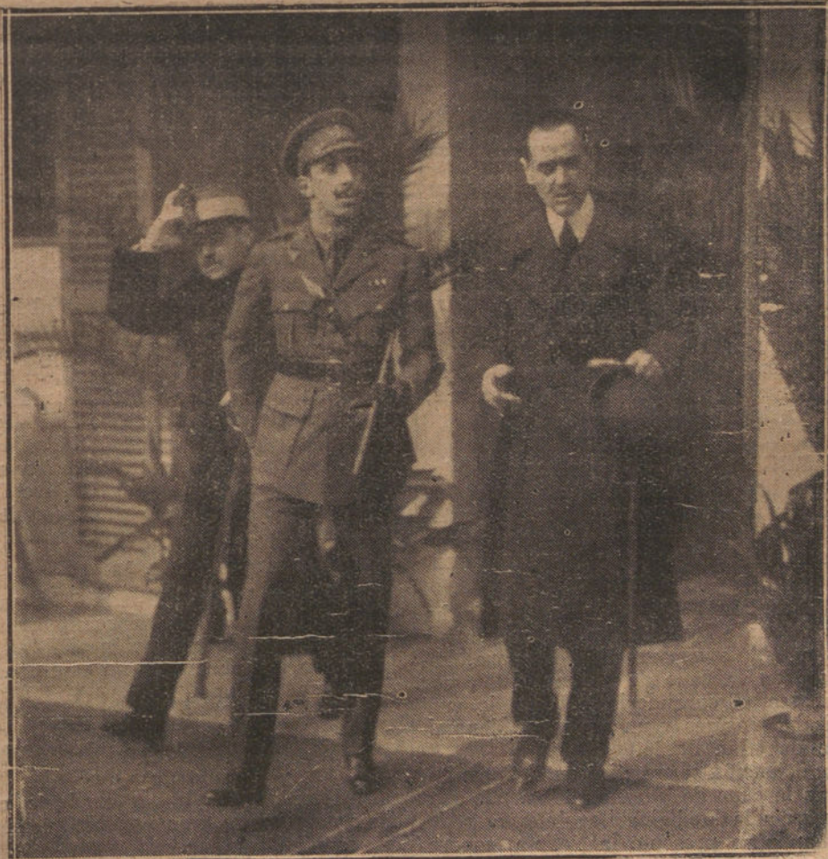
DON ALFONSO AL SALIR DE LA VILLA CHILLAR-DEYUNI, DESPUES DE LA VISITA QUE HIZO A LOS ENFERMOS

PARIS 11. Después de haber examinado el atestado del asunto Landru, cuyo curso de gracia fué preterido anoche, guardasellos ha entregado el asunto a la decisión del presidente de la República.