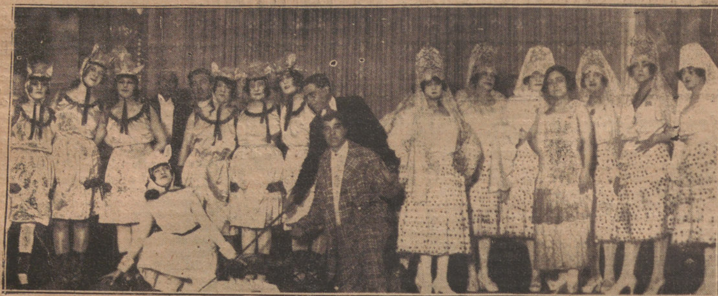
UNA ESCENA DE «¿AY... QUE TENDRÁ MI MARIDO?», QUE SE ESTRENO ANOCHE EN LA LATINA.