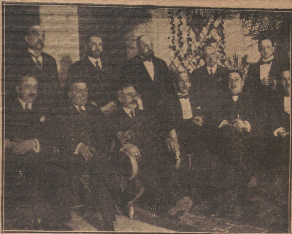
EL SR. BARON CON ALGUNOS DE LOS CONCEJALES QUE ASISTIERON AL BANQUETE EN SU HONOR

El conferenciante comenzó a desarrollar el tema de su conferencia estudiando el antagonismo de productores y consumidores, y puso de relieve la necesidad de que el comercio y el Gobierno, unidos, busquen en el mercado la compensación de la producción nacional por