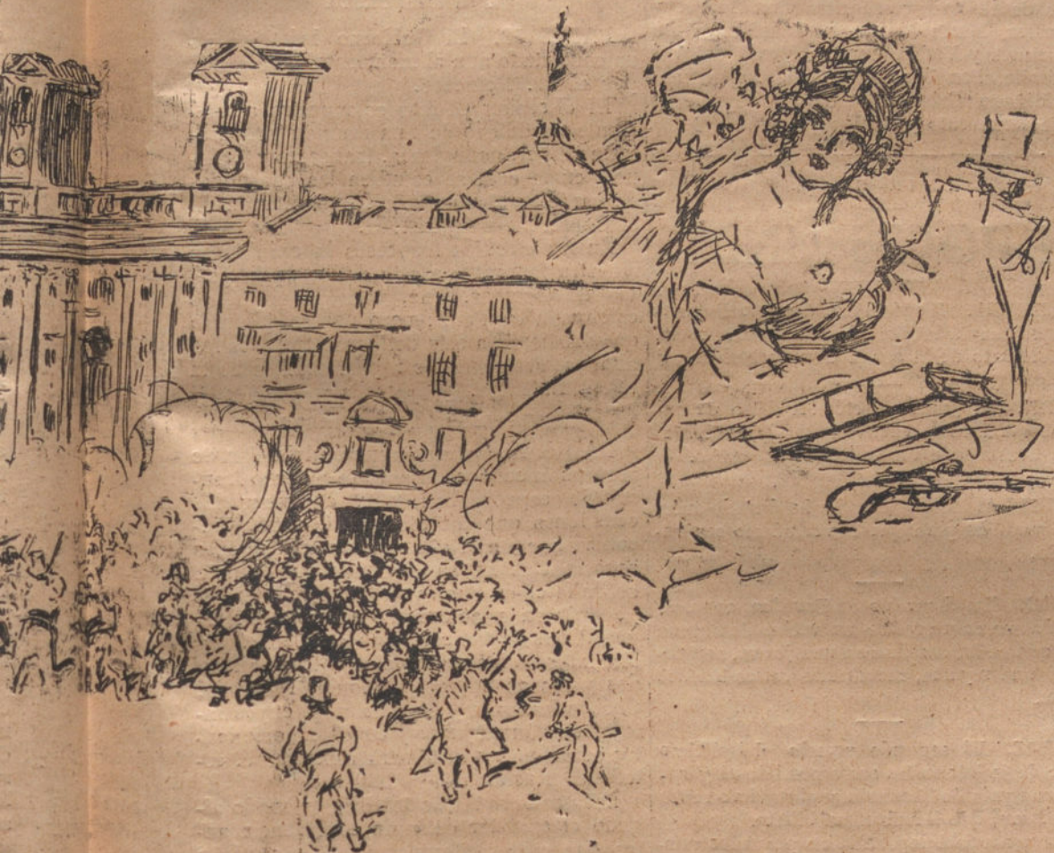
Alegoría de RICARDO MARIN