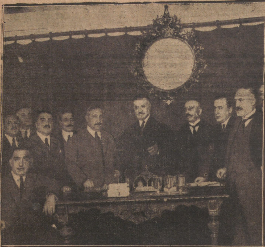
EL MINISTRO DE GRACIA Y JUSTICIA, D. JOSE FRANCO RODRIGUEZ, EN EL ACTO DE LA TOMA DE POSESION DE LA PRESIDENCIA DE LA ACADEMIA HISPANO-AMERICANA