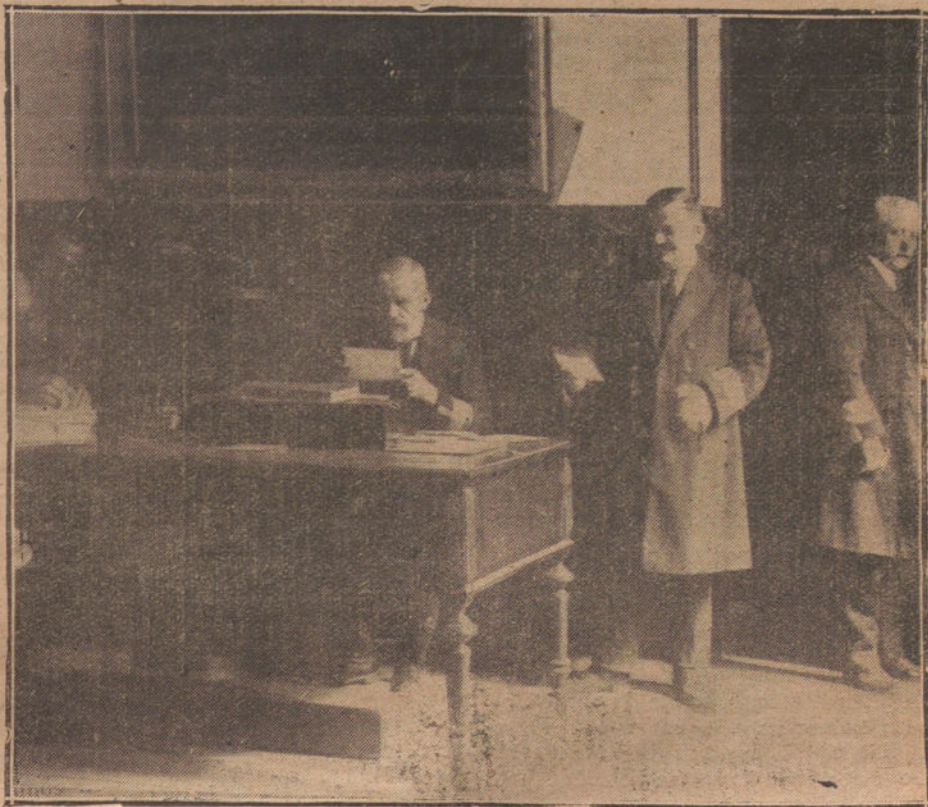
EL PORTERO MAYOR DE LA DIRECCIÓN GENERAL DEL TESORO Y ALGUNOS DE LOS ORDENANZAS A SUS ÓRDENES

La sección de Alumbrado y Transportes la forman tres Negociados. En uno hay tres empleados, 800 expedientes de contratos y 200 de reclamaciones que se resuelven inmediatamente. Otro tiene 1.800 expedientes referentes al alumbrado y 150