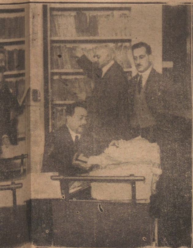
EN LOS ESTANTES QUE SE VEN AL FONDO HAY DE MIL MILLONES DE PESETAS. ESTA ES LA PI SE HACER DE LA NUEVA CAJA CENTRAL