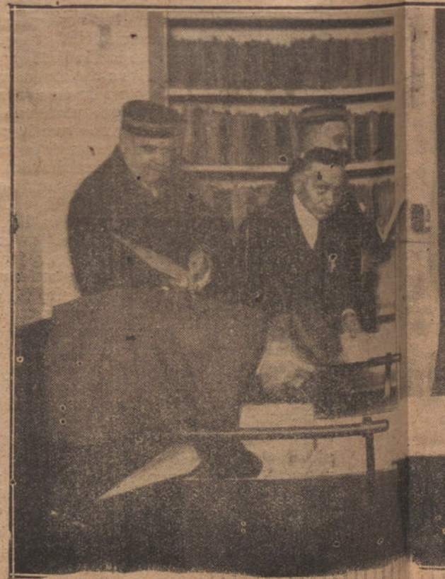
LA CAJA CENTRAL DE DEPOSITOS. EN LOS ESTANTES DEPOSITADOS VALORES POR MAS DE MIL MILLONES. MERA FOTOGRAFIA QUE SE HACE DE...

Sin embargo, no se respeta a dicho personal en sus puestos. Por el contrario, los empleados que quieren pasar de una categoría a otra necesitan ir