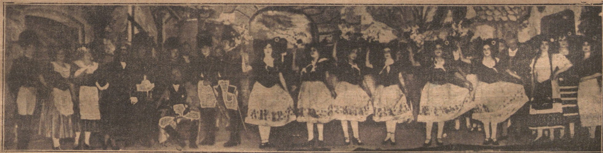
1. Una escena de "Manolito Pamplinas", que se estrena esta noche en Eslava.—2 y 3. Visita del ministro de la Gobernación y del alcalde de Madrid a la Patriarcal.—4. Una escena de "La alsaciana", estrenada anoche en Apolo.