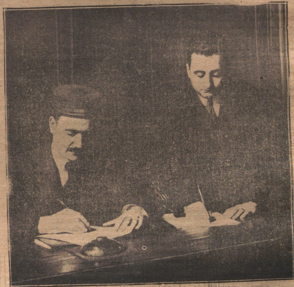
UN EMPLEADO FIRMANDO EL PARTE DE ENTRADA