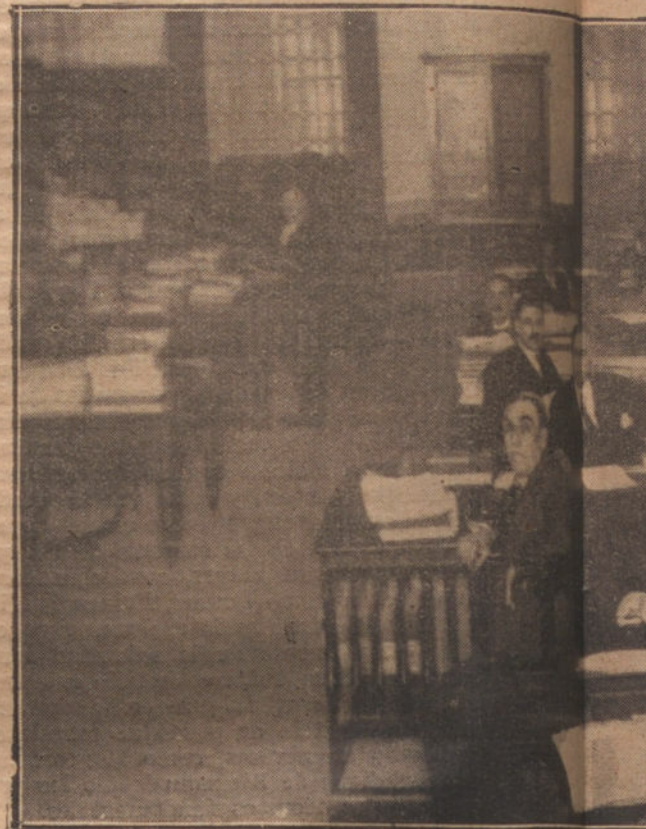
UN ASPECTO DE LAS OFICINAS DE LA SERVEN

TODA LA CORRESPONDENCIA DEBE DIRIGIRSE AL GERENTE DE «LA TRIBUNA»