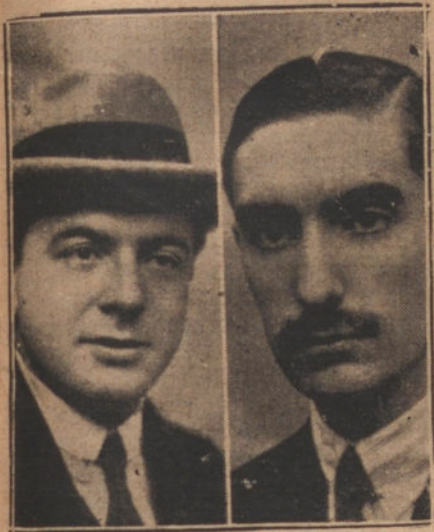
EL MAESTRO JACINTO GUERRERO Y JOSE RAMOS MARTIN, AUTORES DE «LA ALSACIANA»

Por fin! Ya logró Apolo un éxito... No éxito clamoroso, porque con la compañía que hay en ese teatro no es posible conseguirlo; pero sí de los que enorgullecen a los autores, Ramos Martín y el maestro Guerrero triunfaron anoche «a palo seco», gracias a su gracia y a su maestría, y al auxilio del escenógrafo, ni del sastre, de los artistas, ni de ninguno de esos elementos que, en otros sitios, ayudan a ir con bien del amargo trance de un estreno. «La alsaciana» gustó mucho al público, porque tiene un libro sencillo y radable, en el que se traza habilísimamente una fábula de no escaso interés, y, sobre todo, porque la música es sonora, moniosa, llena de inspiración y de medida. Una gran partitura, de la que fueron repetidos todos los números, y que le da a Jacinto Guerrero en la primera de nuestros compositores. ¡Bien lo merece el notabilísimo maestro, que, anclado desde su sitio de la orquesta, recibía lleno de emoción el homenaje caluroso y entusiasta de esa multitud temible y