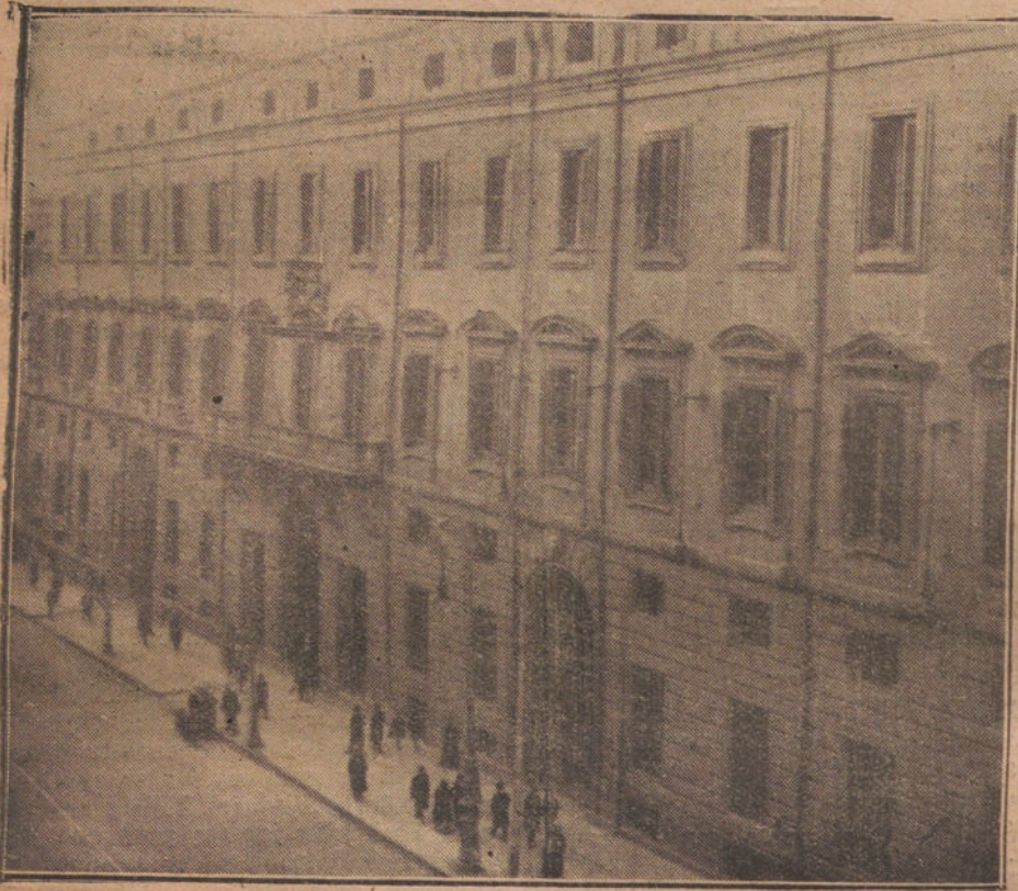
VISTA EXTERIOR DEL MINISTERIO DE HACIENDA

Hace tiempo que domina en la opinión pública una idea equivocada de que el empleado público es como un parásito en los presupuestos del Estado. Se piensa de él que es holgazán por naturaleza, tiene por vicio faltar a la oficina, y que, cuando asiste a ella, es para entretenerse en la lectura de los periódicos, mientras que se acumula el polvo sobre fabulosas cantidades de expedientes olvidados, en cuyos amarillentos legajos no hay más huellas que las del cotidiano servicio de café.