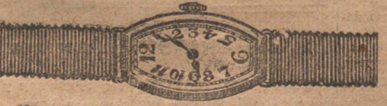
Núm. 3.—«Tonneau», áncora de precisión, oro de ley 18 quilates con pulsera de moiré. Ptas. 250.