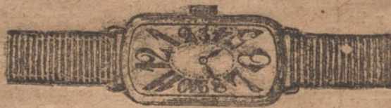
Núm. 1.—Áncora de forma, oro de ley 18 quilates con pulsera de moiré. Ptas. 175.

Formas modernas y elegantes.—Máquinas finas de precisión.—Garantía efectiva de buena marcha por cinco años.