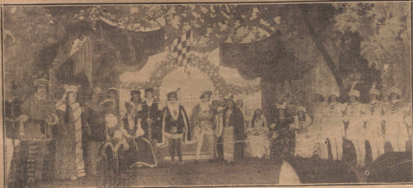
OTRA ESCENA DEL «CANTO DEL TROVADOR»

Éxito del día, verdad e indiscutible LOLA MEMBRIVES, EN LARA