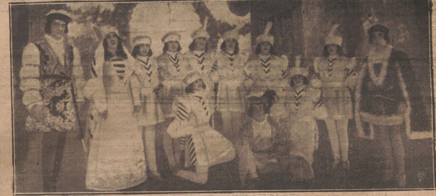
UNA ESCENA DE LA ZARZUELA «EL CANTO DEL TROVADOR», DE OLIVEROS Y CASTELVÍ Y EL MAESTRO EMILIO ACEVEDO, ESTRENADA CON GRAN ÉXITO EN EL TEATRO VICTORIA, DE BARCELONA.

El público aclamó entusiasmado al autor de «Manolito Pamplinas», especialmente en el segundo acto, que es, sin disputa el mejor de la obra. Muchos chistes