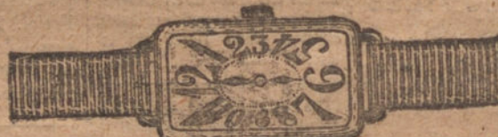
Núm. 2.—Rectangular, áncora 16 rubíes, oro de ley 18 quilates con pulsera de moiré. Ptas. 200.