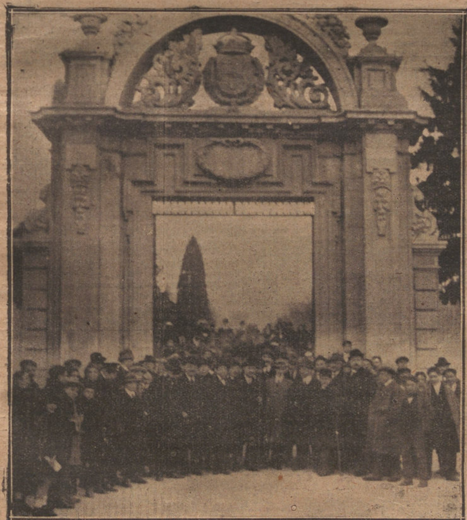
ACTO INAUGURAL DE LA NUEVA PUERTA DE FELIPE IV, EN EL RETIRO, VERIFICADO AYER CON ASISTENCIA DEL ALCALDE Y DISTINGUIDAS PERSONALIDADES

D. Gregorio Martínez Sierra pide desde las prestigiosas columnas de «El Sol»