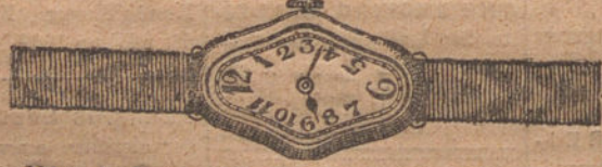
Núm. 5.—Festoneado, áncora de precisión, oro de ley 18 quilates con pulsera de moiré. Ptas. 300.