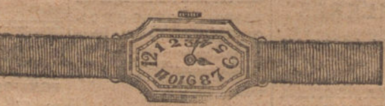
Núm. 6.—Áncora de precisión, oro de ley 18 quilates con pulsera de moiré. Ptas. 325.