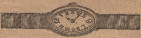
Núm. 4.—Ovalado, áncora de forma, oro de ley 18 quilates con pulsera de moiré. Ptas. 275.