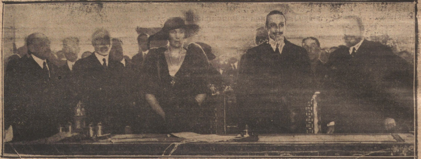
LOS REYES DON ALFONSO Y DONA VICTORIA EN LA PRESIDENCIA DEL ACTO

El Cuerpo de Telégrafos, al igual que el de Correos, acordó dejar a beneficio de la Cruz Roja el importe de un día de haber. Y su dignísimo director general hizo entrega a la Reina de un cheque por 38.534,03 pesetas a que asciende la recaudación.