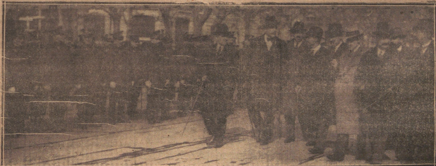
EL ALCALDE Y CONCEJALES DEL AYUNTAMIENTO DE MADRID PASANDO REVISTA A LOS GUARDIAS MUNICIPALES; ACTO VERIFICADO ESTA MAÑANA EN LA PLAZA DE SAN ESTEBAN

Teniendo el Instituto que proceder a la preparación de la reforma de los reglamentos vigentes en materia de accidentes de trabajo, a fin de armonizarlos con la nueva ley de 10 de enero último («Gaceta del 11»), el Consejo de dirección de dicho