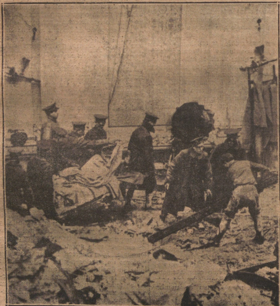
WASHINGTON (ESTADOS UNIDOS).—RECOGIDA DE CADAVERES ENTRE LOS ESCOMBROS DEL «HINOTHEATERS», DESPUES DEL FORMIDABLE INCENDIO QUE CAUSO NUMEROSAS VICTIMAS.

Ahora que ha pasado me río y casi las disculpo, pensando en la triste figura que realmente debía yo hacer con semejante traje, mi actitud encogida y mi aturdimiento ridículo. Entré tan azorada que tropecé dos veces y al sentarme en el pupitre que me correspondía, estuve a punto de caerme porque, sin darme cuenta, en un movimiento instintivo en busca del respaldo, me eché hacia atrás. Gracias a que unas manos compativas me sostuvieron; si no, me doy la gran costalada. Esto provocó nuevas risitas y nuevos cuchicheos... y acabó de aturdirme. Afortunadamente, se me ocurrió abrir un libro y abis-