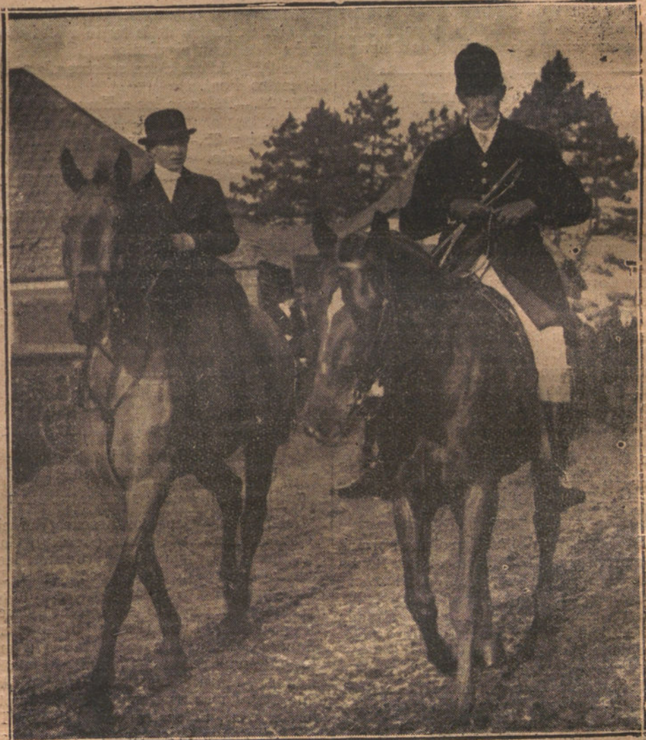
EN WEST NORFOLK (INGLATERRA).—LA PRINCESA MARY, HIJA DE LOS REYES DE INGLATERRA, PASEANDO A CABALLO ACOMPAÑADA DE SU PROMETIDO, LORD LASCELLES, CON EL QUE CONTRAERA MATRIMONIO DENTRO DE POCOS DÍAS.

El Sumo Pontífice interrogó también a monseñor De Andrea, que acaba de visitar España, respecto de la acción social realizada y dirigido por el episcopado español, añadiendo que contemplaba con gran simpatía ese movimiento.