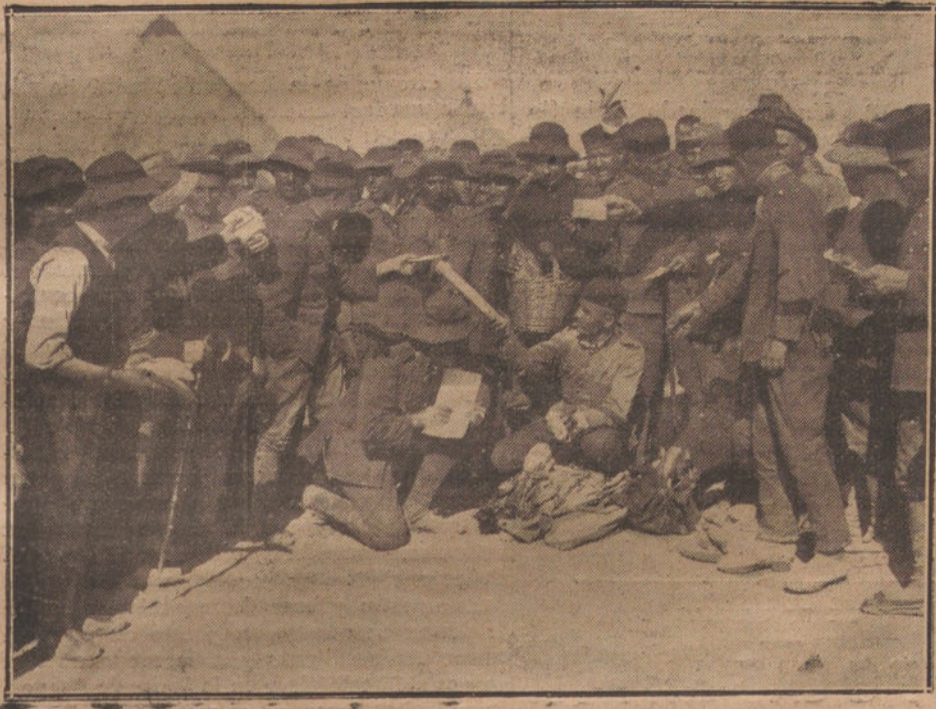
REPARTO DE LA CORRESPONDENCIA EN UNA DE LAS POSICIONES AVANZADAS