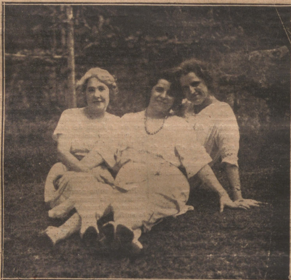
ESPERANZA IRIS, LA NOTABLE ACTRIZ MEXICANA, QUE TAN GRATOS RECUERDOS DEJO EN SUS ANDANZAS ARTISTICAS POR ESPAÑA, SIENTE LA NOSTALGIA DE NUESTRO PAIS Y EN RIO JANEIRO, DONDE A SORPRENDIO LA NOCHE DEL 31 DE DICIEMBRE, AÑORA EN LA FINCA DE UNOS HACENDADOS ESPAÑOLES, LOS TRIUNFOS Y ALEGRÍAS GOZADOS EN EL VIEJO SOLAR HISPANO

—¿Toma! No va a tener abierto un teatro con una compañía de mujeres guapas sólo para las cosas de los demás. Algo una vez tenía que tocarle a él.