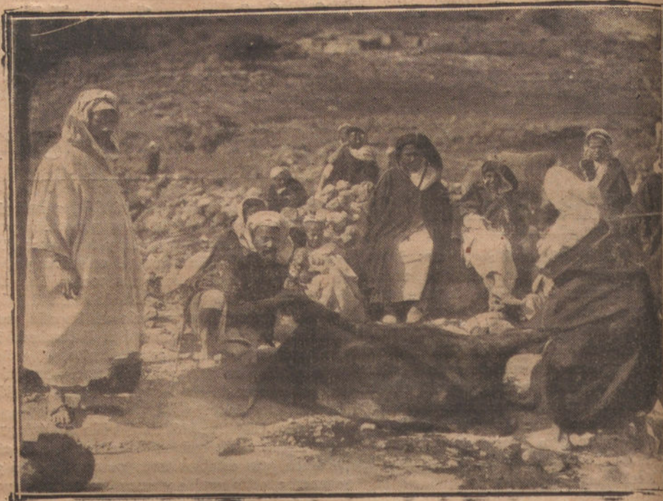
MATADERO DE RESES EN EL ZOCO DEL TELAT, DE BENI SIDL

marne en él. A los diez minutos nadie en la clase se ocupaba de mí.