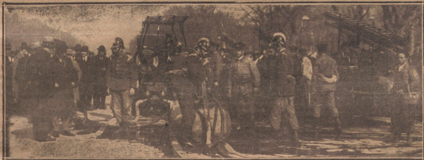
EL CUERPO DE BOMBEROS DURANTE LAS MANIOBRAS VERIFICADAS ESTA MAÑANA EN PRESENCIA DEL ALCALDE

Fundador: S. CANOVAS GERVANTES. - Información - Literatura - Ciencias - Artes - Deportes - Teatros. - Oficinas: Plaza de Canalejas, 8