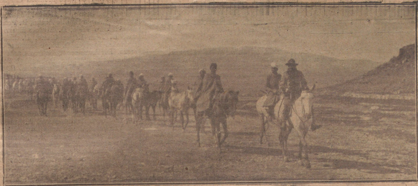
FUERZAS DE REGULARES DE LA COLUMNA RIQUELME, ENTRANDO EN LA POSICION DE HASSI-BERTRAN, RECIENTEMENTE OCUPADA POR NUESTRAS TROPAS