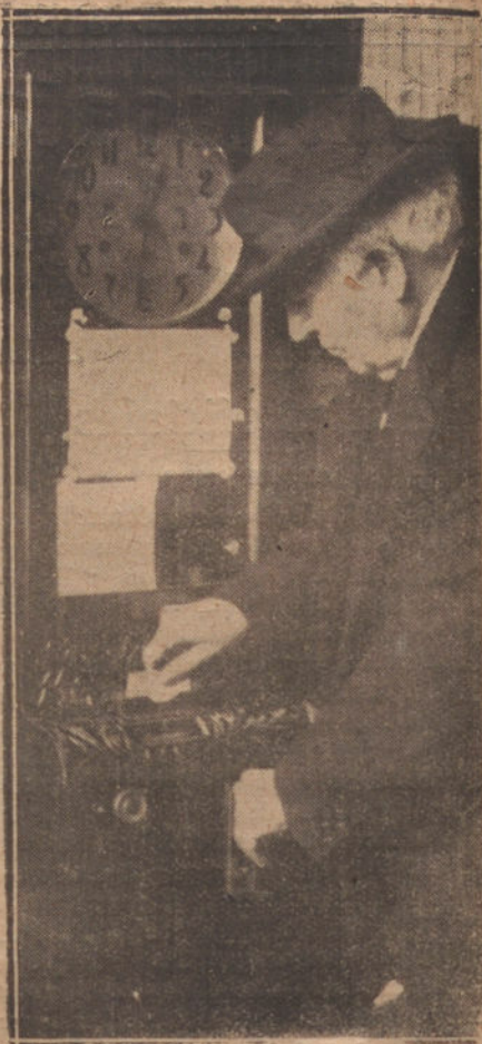
EDISON, AL LLEGAR A SU FÁBRICA, DEPOSITA EN EL RELOJ MECÁNICO EL «TICKET» QUE DEMUESTRA SU PUNTUALIDAD.

Edisson es una gloria universal, de la que todos debemos sentirnos orgullosos. Por eso, LA TRIBUNA se complace en ofrecer a sus lectores estas notas gráficas,