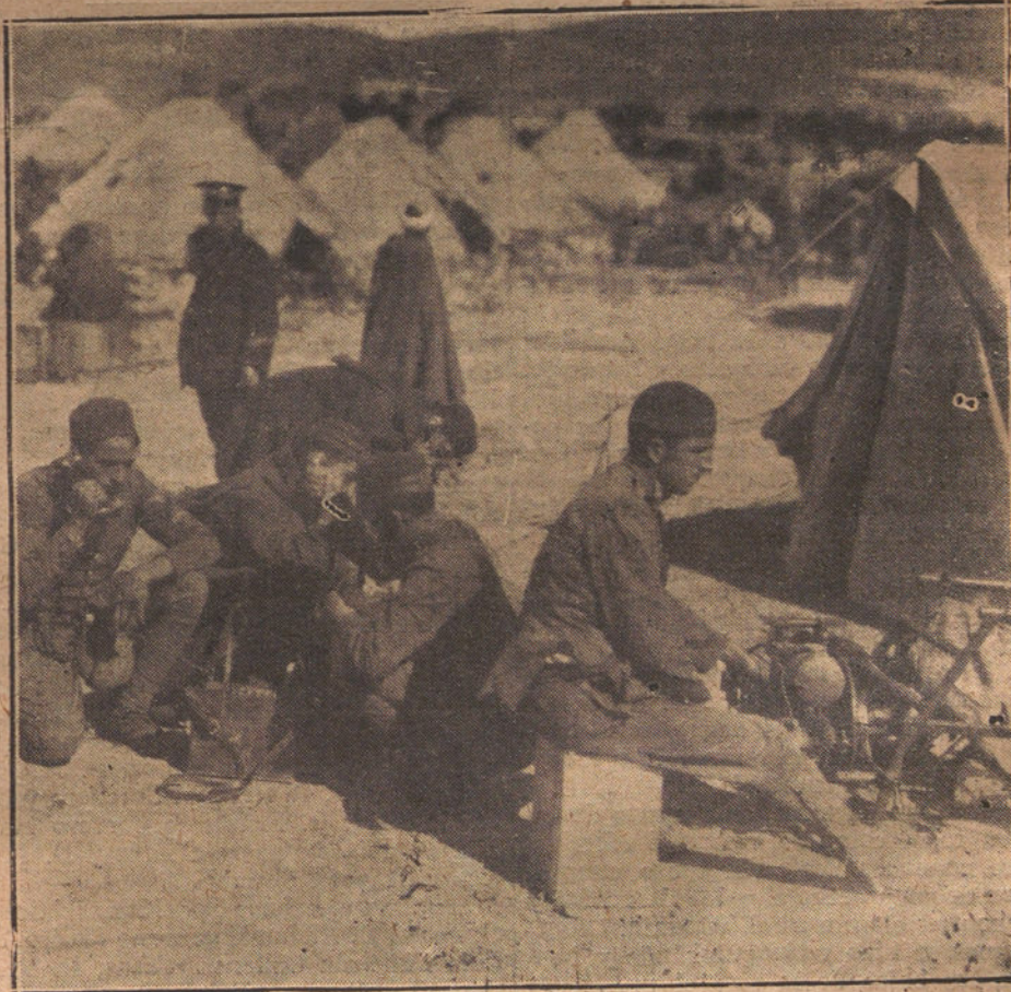
LA ESTACION DE TELEGRAFIA SIN HILOS DANDO CUENTA AL COMANDANTE GENERAL DE MELILLA DE HABER SIDO OCUPADA SIN NOVEDAD LA POSICION DE RAYEM

ADVERTIMOS AL PUBLICO QUE NO DE VOLVEMOS LOS ORIGINALES QUE ES PONTANEAMENTE SE NOS REMITAN, Y QUE, EN NINGUN CASO, MANTENDREMOS CORRESPONDENCIA ACERCA DE ELLOS