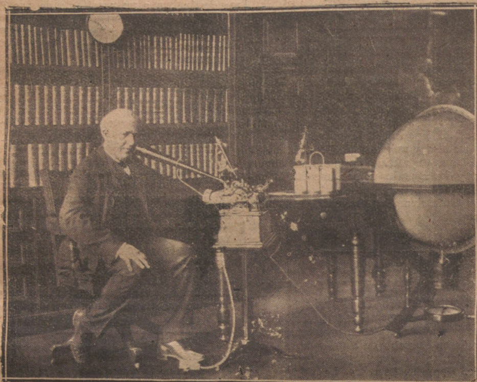
EDISON, EN SU DESPACHO, TRABAJANDO ANTE EL «DICTOFONO», APARATO DE SU INVENCIÓN