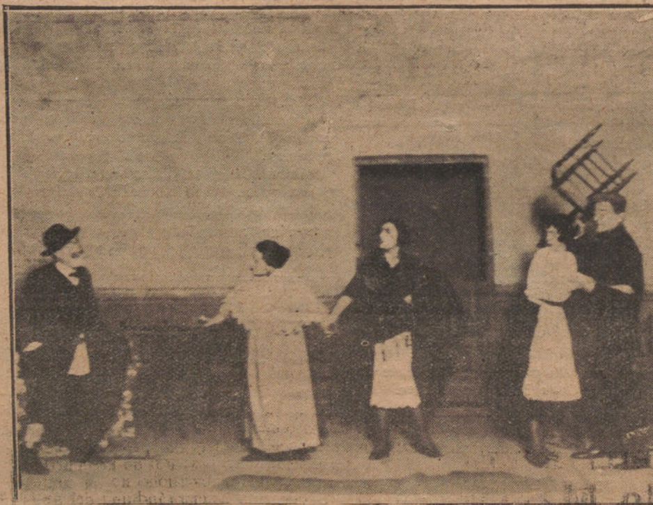
UNA ESCENA DE «SALUSTIANO ESTÁ EN UN BRETE», QUE SE REPRESENTÓ AYER POR PRIMERA VEZ EN EL CÓMICO