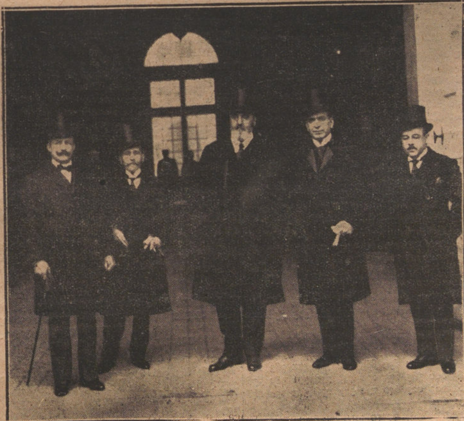
LOS SEÑORES QUE COMPONEN LA MESA DE LA JUNTA INTERNACIONAL DE BIBLIOGRAFIA Y TECNOLOGIA HISPANO-AMERICANAS AL SALIR DE PALACIO EN LA MAÑANA DE HOY, DESPUES DE SER RECIBIDOS POR SU MAJESTAD EL REY

Enviamos nuestro pésame a su viuda e hijos.