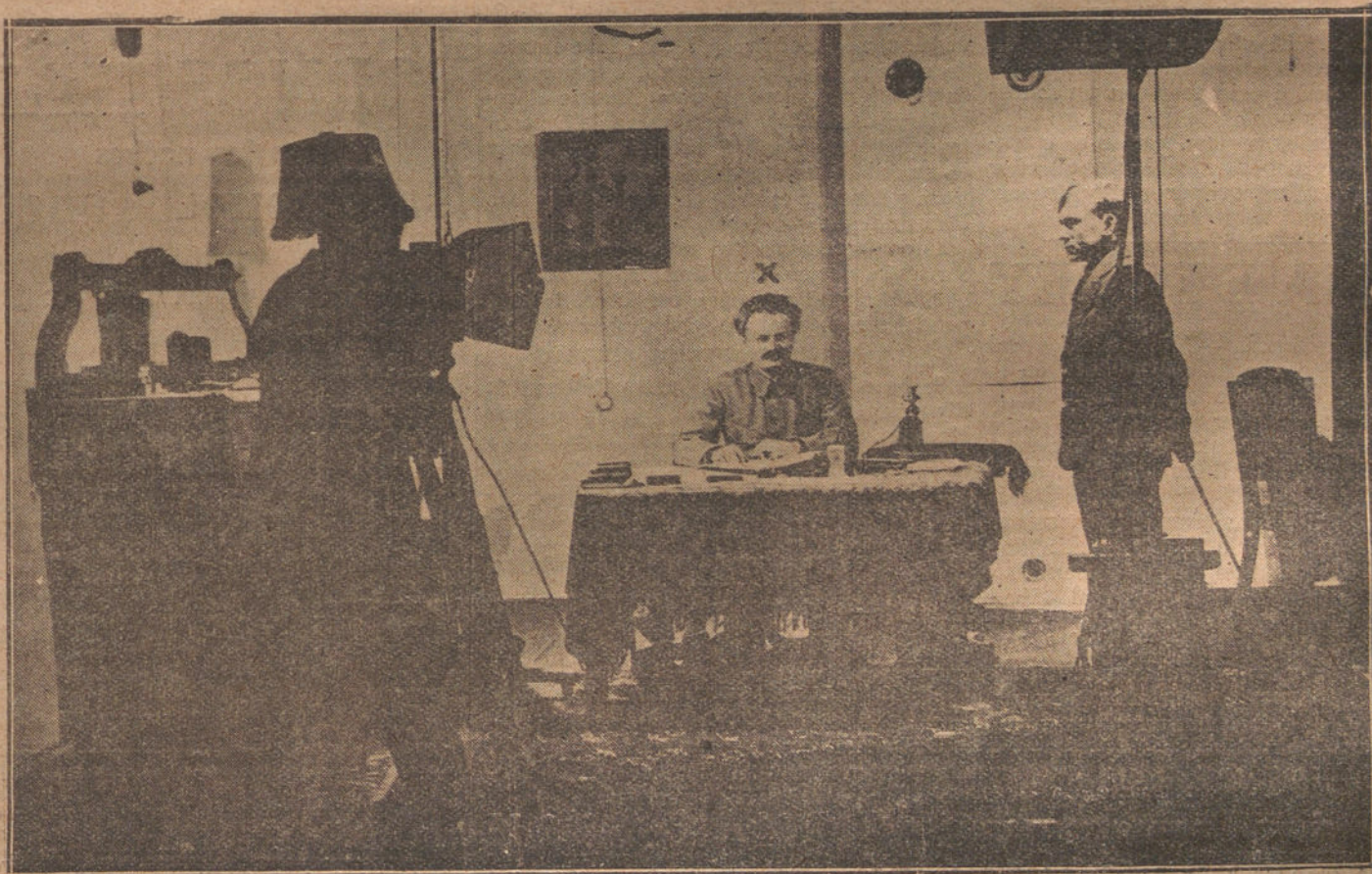
MOSCÚ (RUSIA).—INTERESANTE FOTOGRAFIA DE TROTSKY (X), MINISTRO DE LA GUERRA DE LOS SOVIETS, EN EL MOMENTO DE SER «FILMADO» POR UN OPERADOR DE CINEMATÓGRAFO EN SU DESPACHO