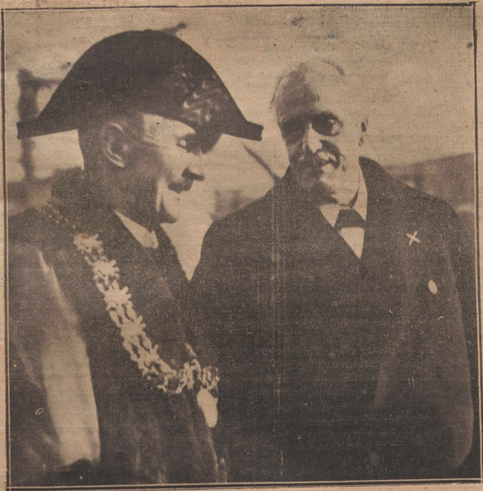
SANTHAMPTON (INGLATERRA).—EL ALCALDE DE LA CIUDAD, LORD LEE, A BORDO DEL TRANSLANTICO «AQUITANIA», RECIBIENDO A MR. BALFOUR (X) A SU REGRESO DE LA CONFERENCIA DE WASHINGTON