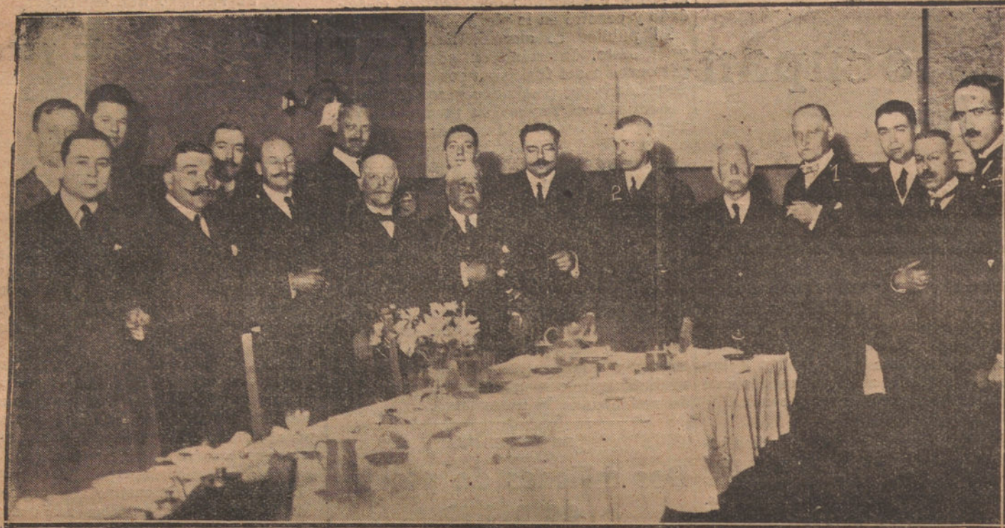
INAGURACION DEL CLUB ANGLO-AMERICANO.—1, MR. HOWARD, EMBAJADOR DE INGLATERRA.—2, MR. CYRUS E. WOOD, EMBAJADOR DE LOS ESTADOS UNIDOS