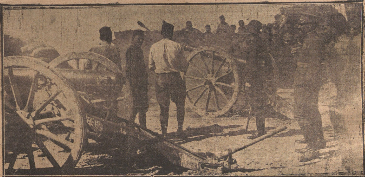
UNA BATERIA BOMBARDEANDO LOS PUEBLOS Y POSICIONES OCUPADOS POR EL ENEMIGO

Endériz está siendo muy visitado. Es de esperar la inmediata intervención del ministro de Gracia y Justicia para que el distinguido compañero sea puesto en libertad sin dilaciones.