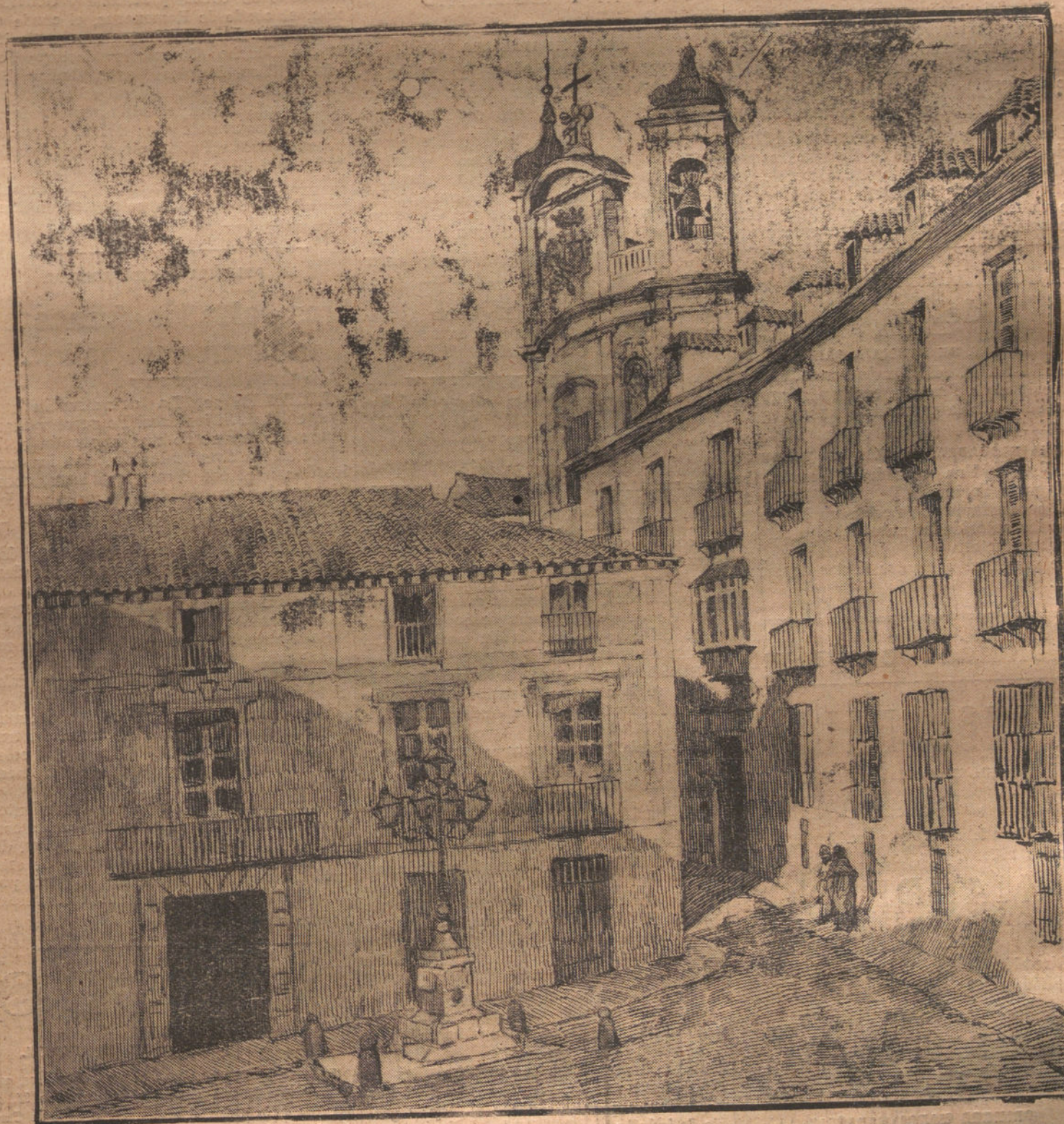
LA CALLE DEL SACRAMENTO (Dibujo de Alejandro Sánchez Felipe)