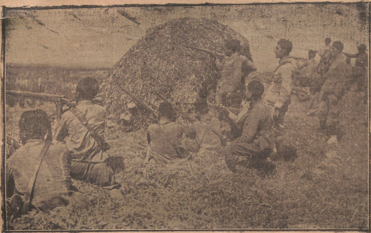
FUERZAS DE REGULARES EN UNO DE LOS ULTIMOS COMBATES