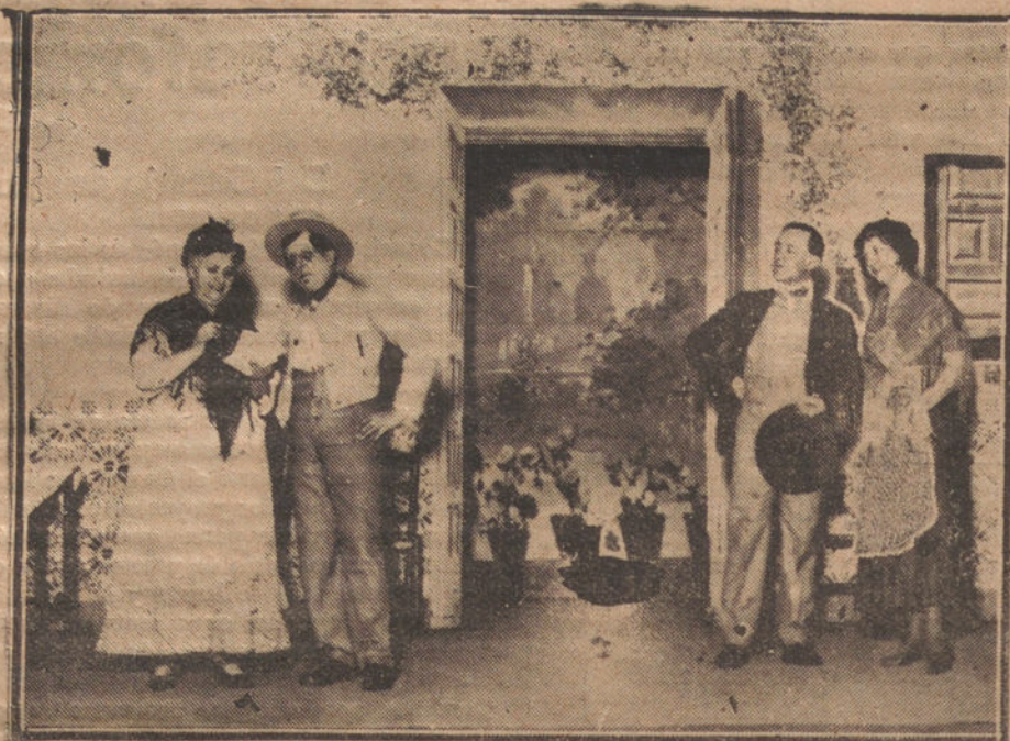
UNA ESCENA DEL ENTREMÉS «TE TENGO COMPARAITA...» ESTRENADO AYER EN EL TEATRO ESPAÑOL

Ultimamente se repuso «El estigma», el famoso drama de Echegaray, y en el se ha revelado como actriz de positivo talen-