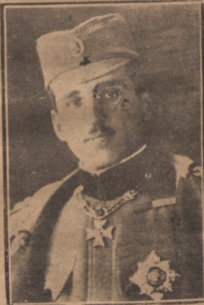
EL REY ALEJANDRO DE SERBIA, QUE CONTRAJO MATRIMONIO CON LA PRINCESA MARIA DE RUMANIA

LONDRES 23. Según el «Morning Post», el grupo bancario londinense encargado de efectuar las negociaciones con el fin de consentir a Grecia un préstamo de quince millones de libras esterlinas ha renunciado a ocuparse de esta cuestión, por no haber dado su consentimiento a este préstamo los Estados Unidos.