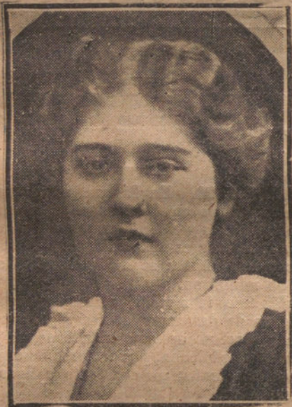
LA PRINCESA MARIA DE RUMANIA, QUE HA FIRMADO SUS ESPONSALES CON EL REY ALEJANDRO DE SERBIA