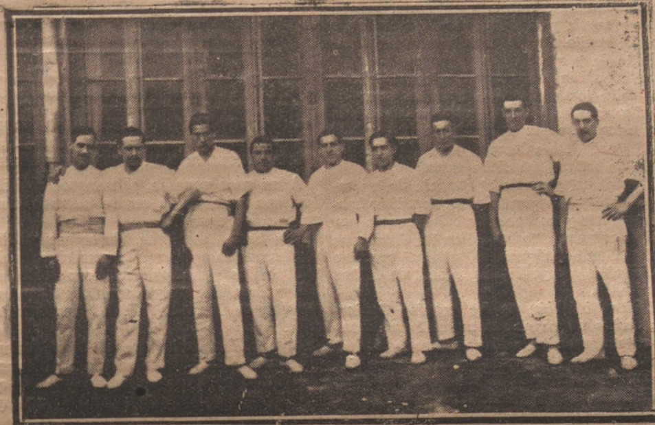
GRUPO DE LOS JUGADORES QUE ACTUALMENTE JUEGAN LOS PARTIDOS EN ESTE FRONTON