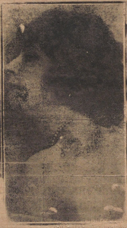
LA PRIMERA ACTRIZ DEL TEATRO ESPAÑOL, CARMEN RUIZ MORALES, QUE HA GANADO EL IMPORTE DE SU BENEFICIO EN LOS NIÑOS HAMBRIENTOS DEL PUERTO RUSO.