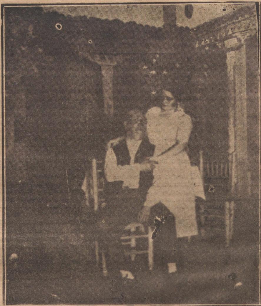
UNA ESCENA DE "EL NUMERO 15", SAINNETE ESTRENADO AYER POR LA TARDE EN EL TEATRO DE APOLLO

medo espantoso la penitencia del público, bueno y señor de todos nosotros.