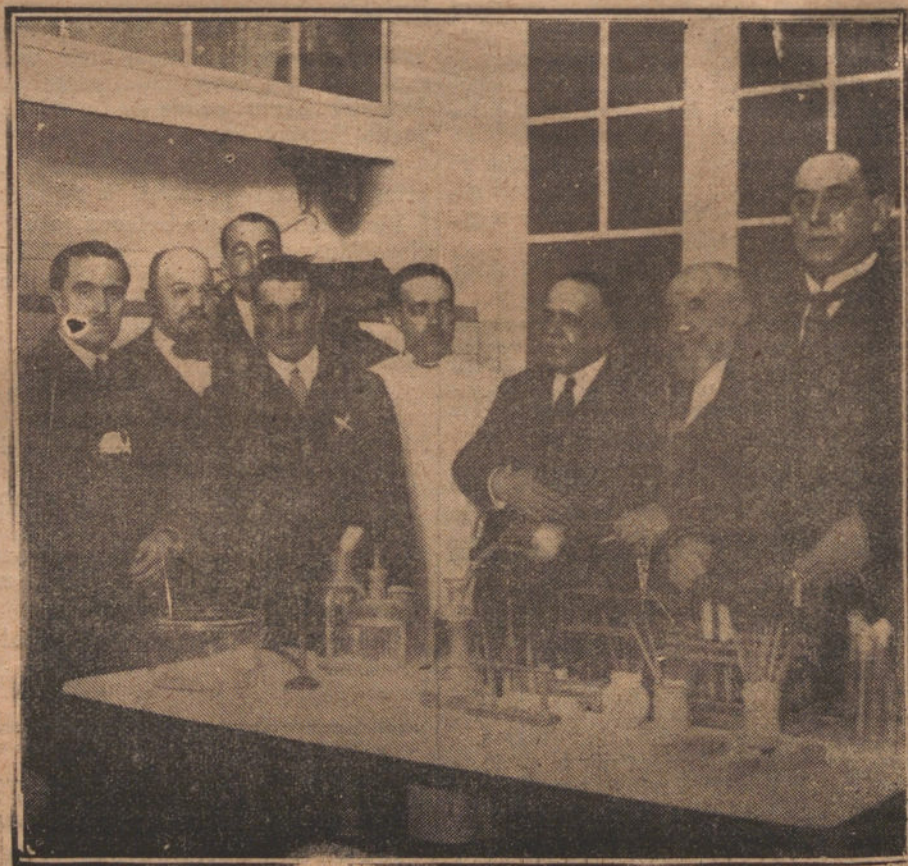
VISITA DEL ALCALDE AL LABORATORIO MUNICIPAL