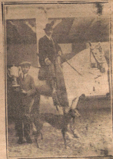
LA GALGA «SERRANA», GANADORA DE LA COPA ALBURQUERQUE EN EL CAMPEONATO DE ALGETE

Su Majestad la Reina Doña Victoria honró con su asistencia el selecto concurso, y entre otras personalidades presenciaron las pruebas el príncipe D. Raniero, los duques de Alburquerque, las duquesas de Algete, la Victoria y el Infantado y los marqueses de Villabragima.