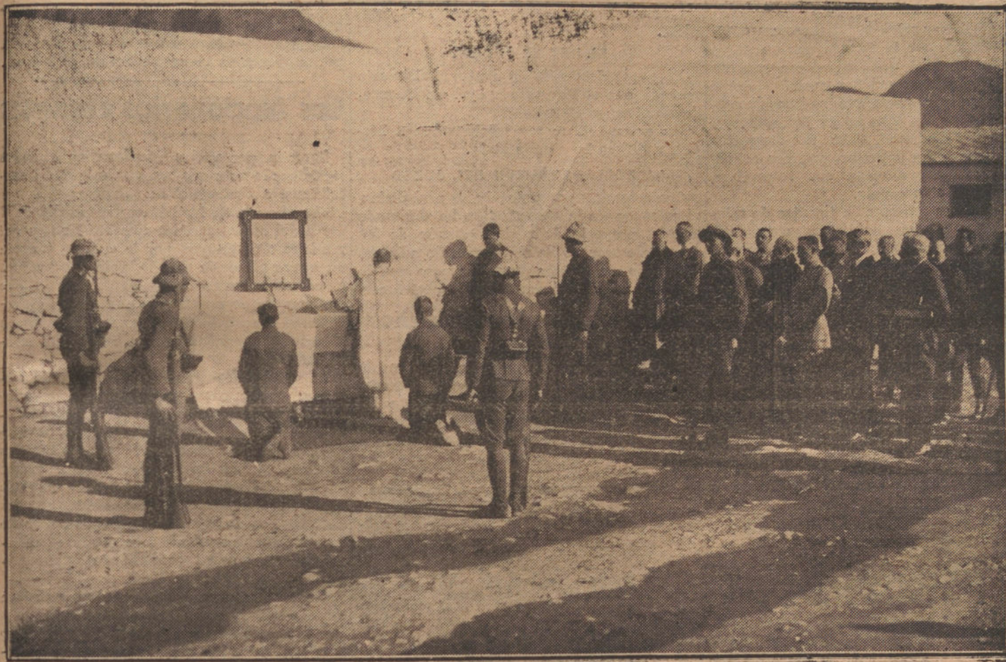
LOS AGREGADOS MILITARES DE LAS NACIONES EXTRANJERAS OYENDO MISA EN EL CAMPAMENTO DEL ZAIO