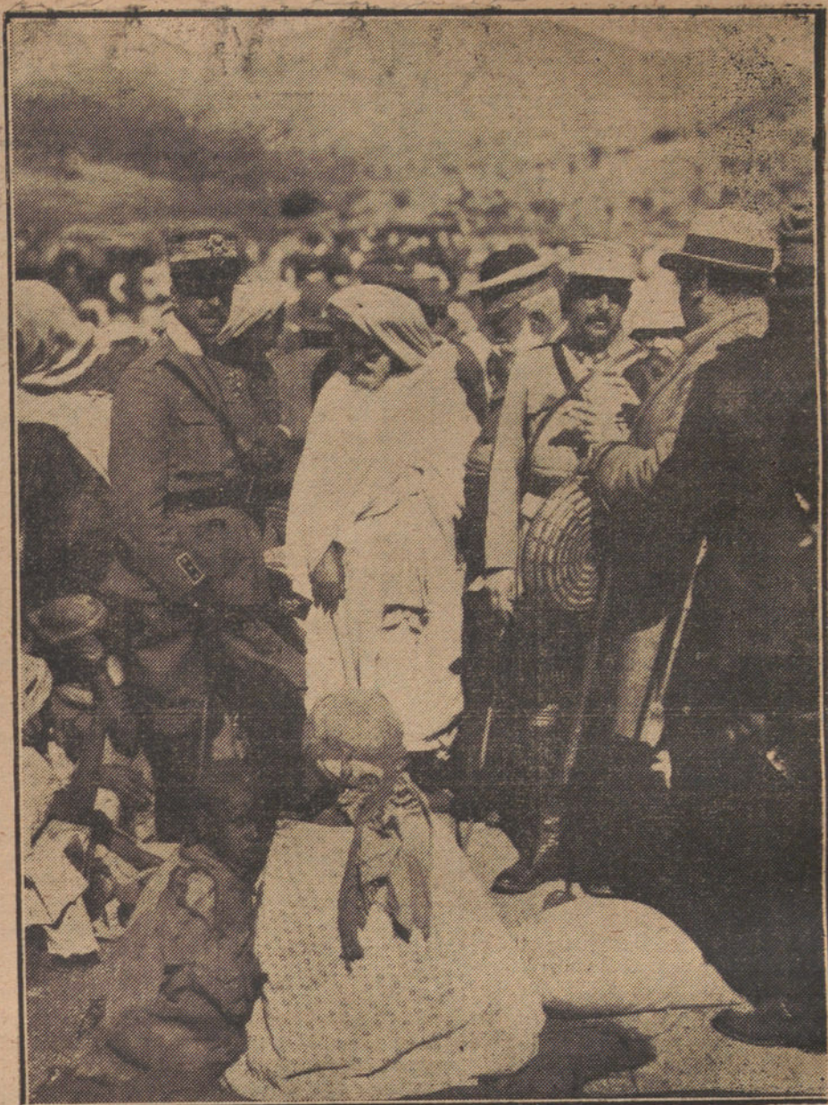
LOS AGREGADOS MILITARES VISITANDO EL ZOCO DEL HAD DE SIERRAHIA, EN QUEBDANA