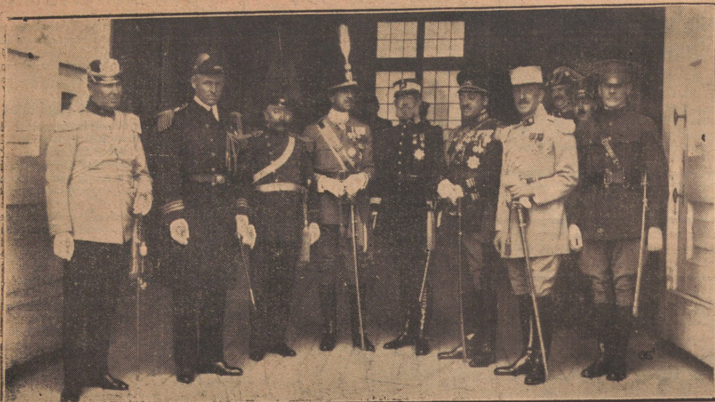
LOS AGREGADOS MILITARES DE LAS NACIONES ACREDITADAS EN ESPAÑA, QUE HAN ESTADO EN MARRUECOS, AL SALIR HOY DE PALACIO DESPUES DE CUMPLIMENTAR A SU MAJESTAD