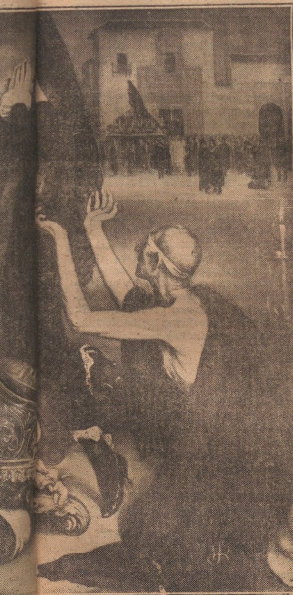
ROMERO DE TORRES