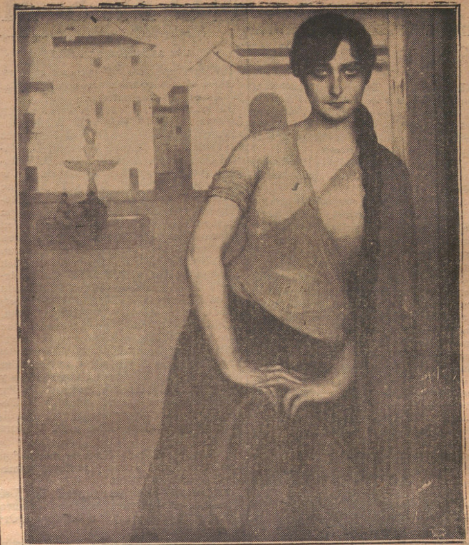
LA HERMANA DE CARMEN.—(Cuadro de Romero de Torres.)

Los empleados de la prisión se dieron cuenta de lo que ocurría y pidieron auxi-