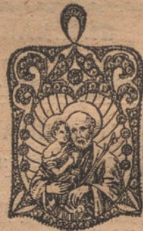
Núm. 3.—Medalla 91 fil. intes y dia- mantes. Pt. 450.