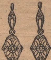
Núm. 2.—Pendientes 4 brillantes y diamantes. Pt. 300.