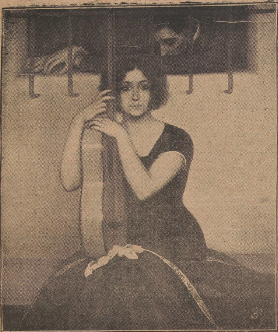
LA CARCELERA.—(Cuadro de Romero de Torres.)