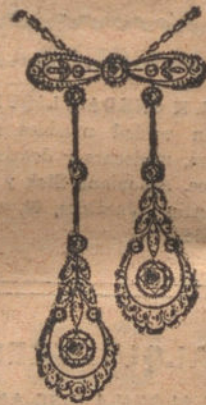
Núm. 5.—Penden- tif 7 brillantes y diamantes. Ptas. 675.