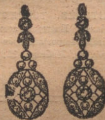
Núm. 4.—Pendien- tes 8 brillantes y diamantes. Ptas. 400.