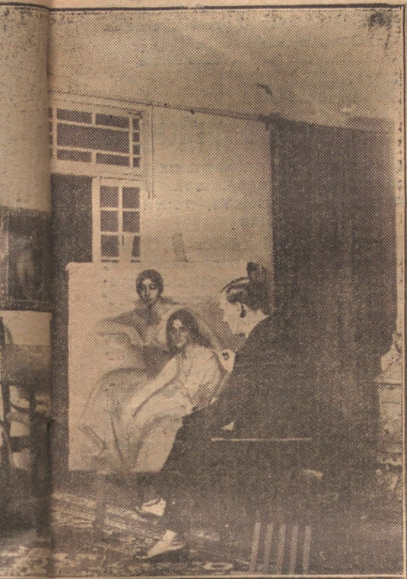
RO DEIN SU ESTUDIO