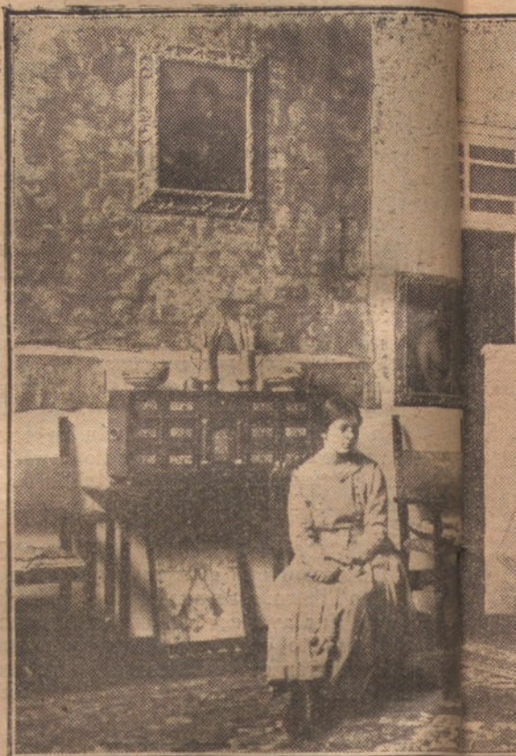
ROMERO DE TORRES EN SU