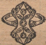
Núm. 6.—Sortija 3 brillantes y dia- mantes. Ptas. 275.