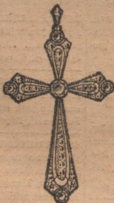
Núm. 1.—Cruz 5 brl- llantes y diamantes. Ptas. 550.

con brillantes de primera calidad :-: Diamantes rosas de Holanda :-: Monturas de platino fino y oro de ley 18 quilates, contrastado.