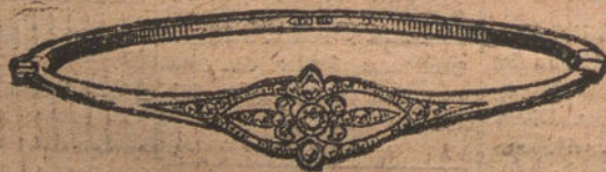
Núm. 9.—Pulsara 3 brillantes y diamantes. Ptas. 300.