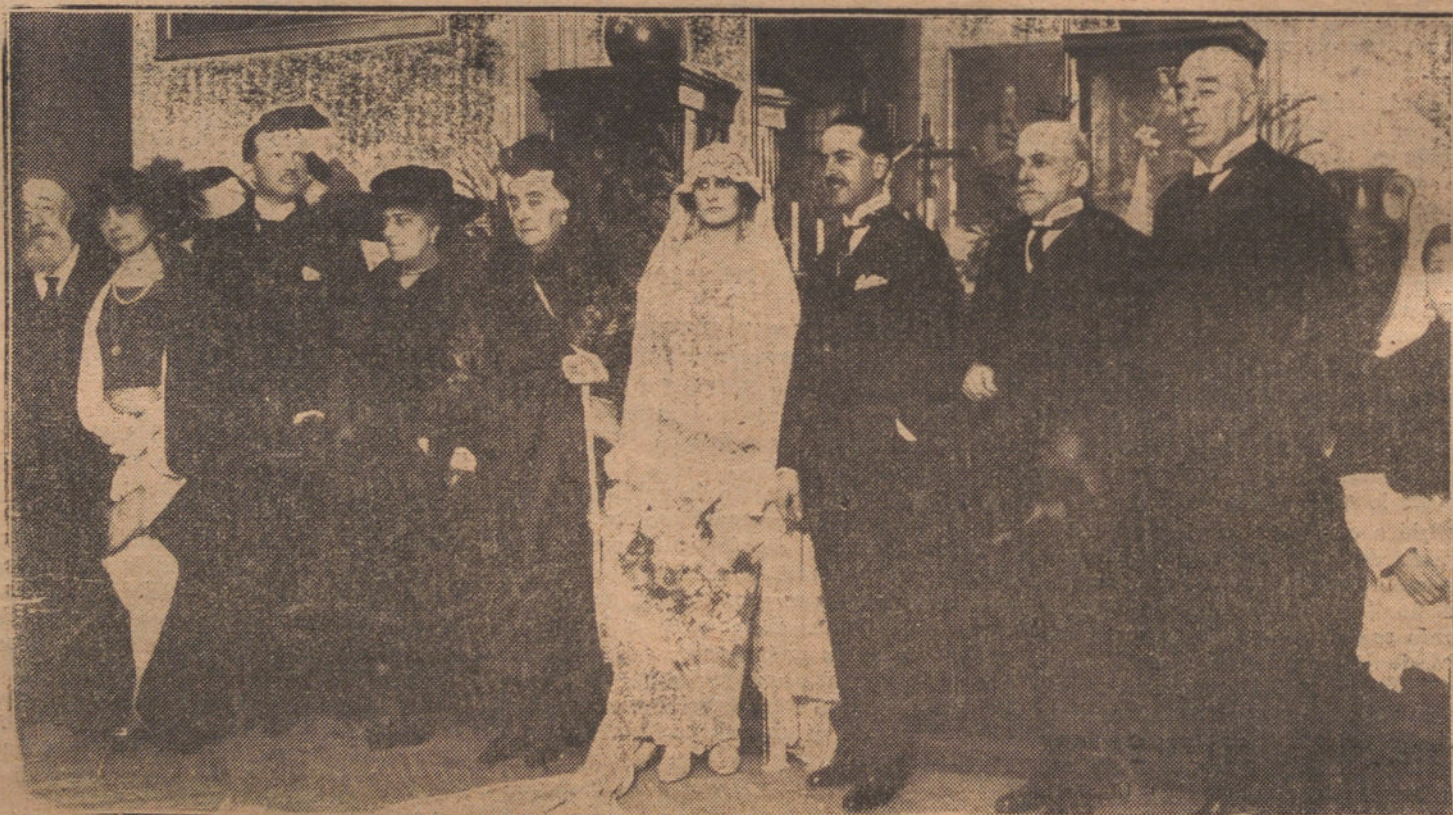
BODA DE LA SEÑORITA ISABEL FERNANDEZ VILLAVERDE CON EL CONDE DE ORIZABA, A LA QUE ASISTIO SU ALTEZA REAL EL INFANTE DON FERNANDO