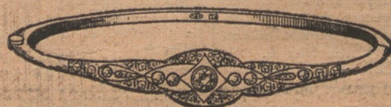
Núm. 10.—Pulsara 5 brillantes y diamantes. Ptas. 375.