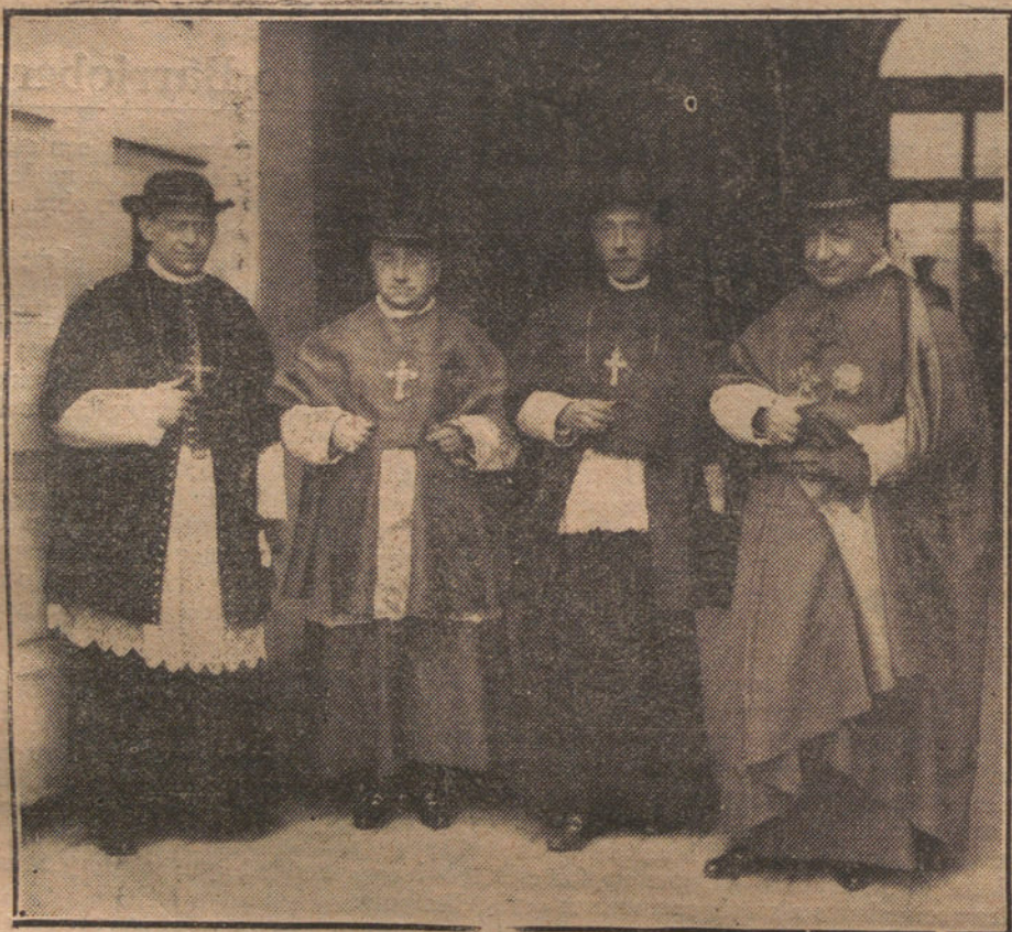
LA COMISION DE PRELADOS ESPAÑOLES, PRESIDIDA POR EL OBISPO DE MADRID-ALCALA, QUE HA VISITADO HOY A DON ALFONSO PARA DARLE CUENTA DE LA GRAN CAMPAÑA SOCIAL EMPLEADA