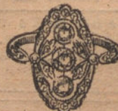
Núm. 8.—Sortija 3 brillantes y dia- mantes. Ptas. 300.