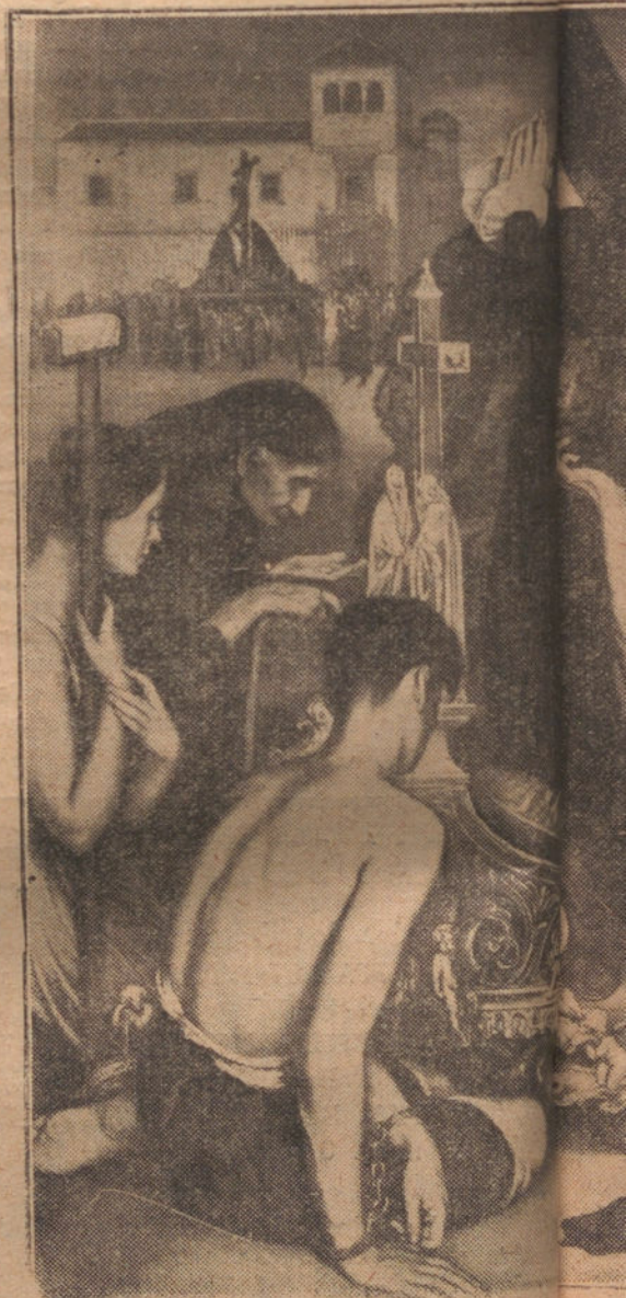
LA SARTA.—Romero de Torres

La llegada de un señor, que va a comprar un cuadro, viene a calmar la excitación, y todo se vuelve aparentar seriedad en las modelitos. Mariquilla va descorrien-