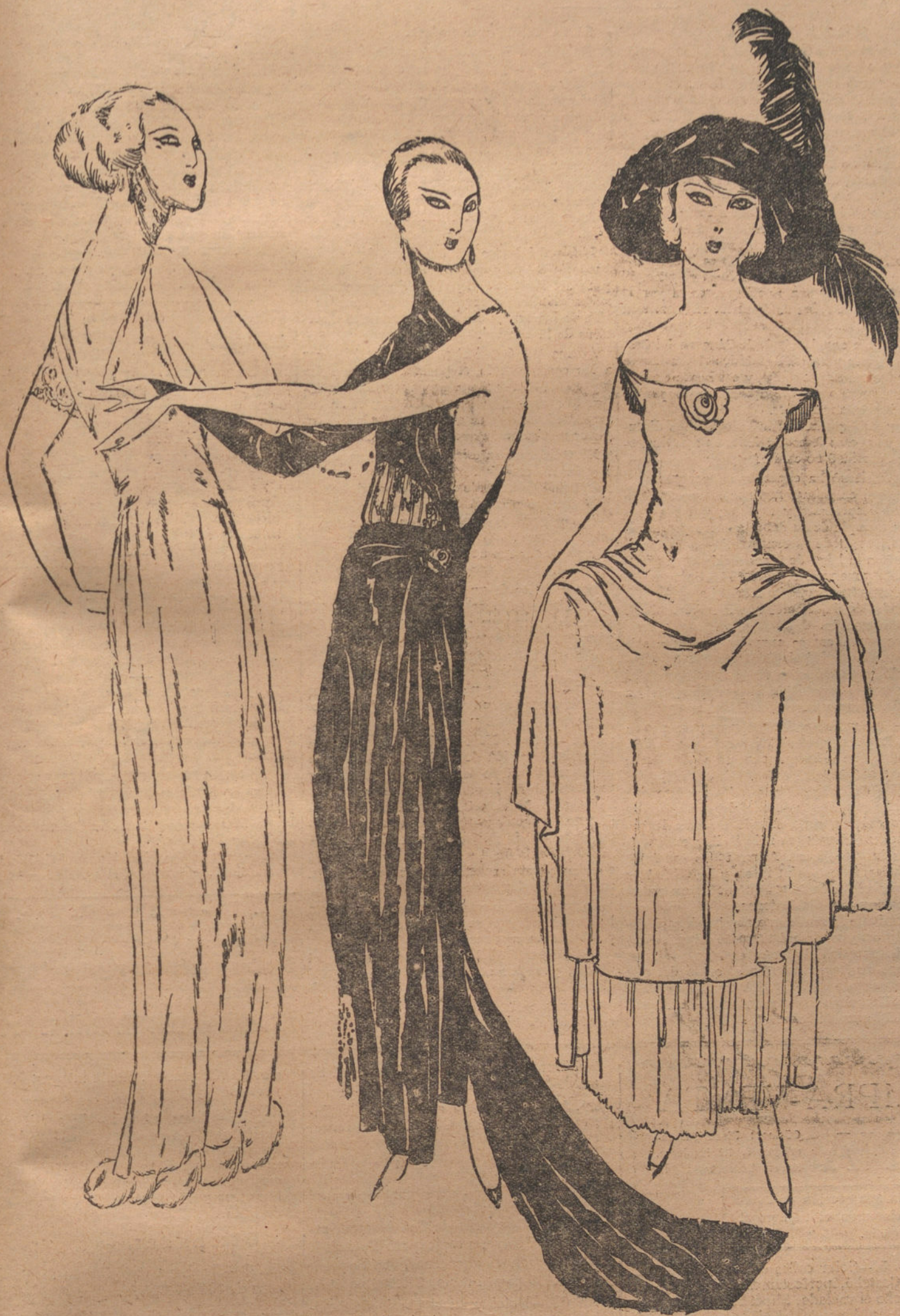
Una encantadora rubia, moldeada en blando tisú de plata, bordeado de chinchillas; oax con un curioso traje de terciopelo verde esmeralda y chantilly negro, y una hija espiritual de Orouse, con su atavío Luis XV, de terciopelo rosa y crespón rosa, harían difícil la tarea de un nuevo París, que quisiese entregarse la manzana de oro a estas tres diosas modernas.

La moda creada y dirigida por José Zamora