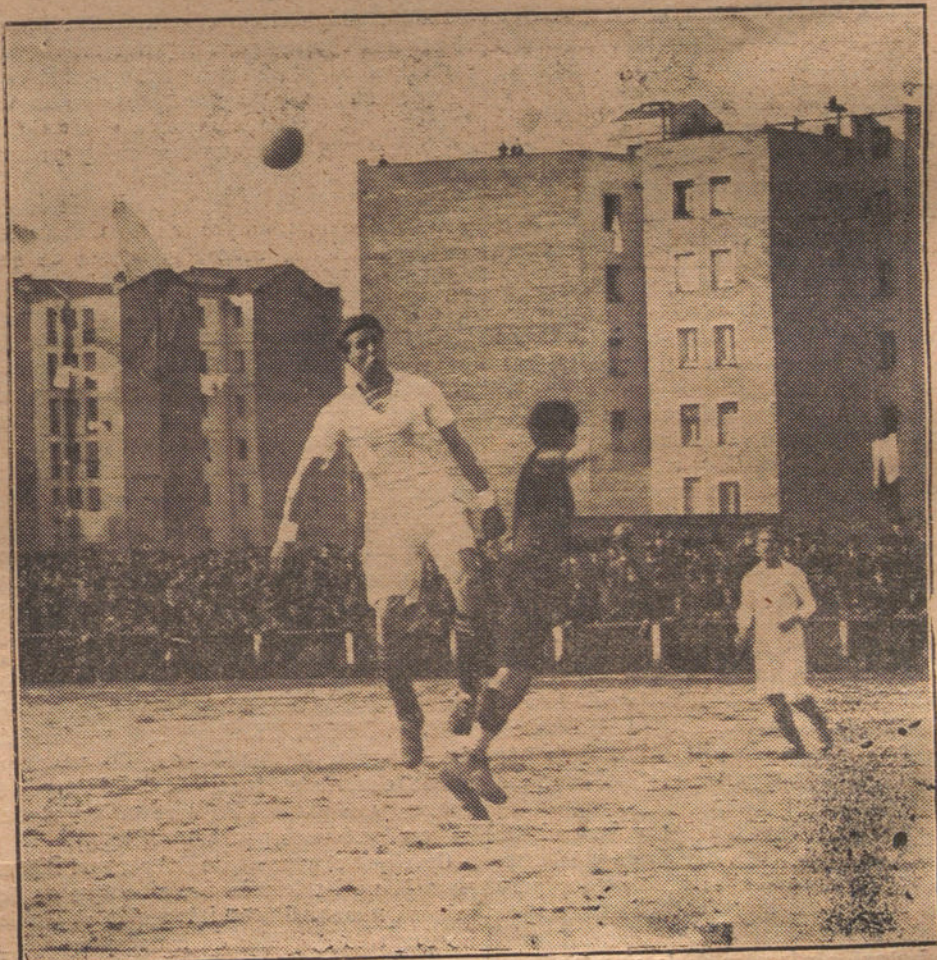
DOS MOMENTOS INTERESANTES DEL PARTIDO DE «FOOT-BALL» DE AYER, EN EL QUE EMPATARON LOS EQUIPOS DE MADRID Y BARCELONA