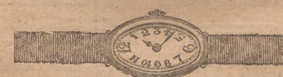
Núm. 4.—Ovalado, ancora de forma, oro de ley 18 quilates con pulsera de moiré. Ptas. 275.