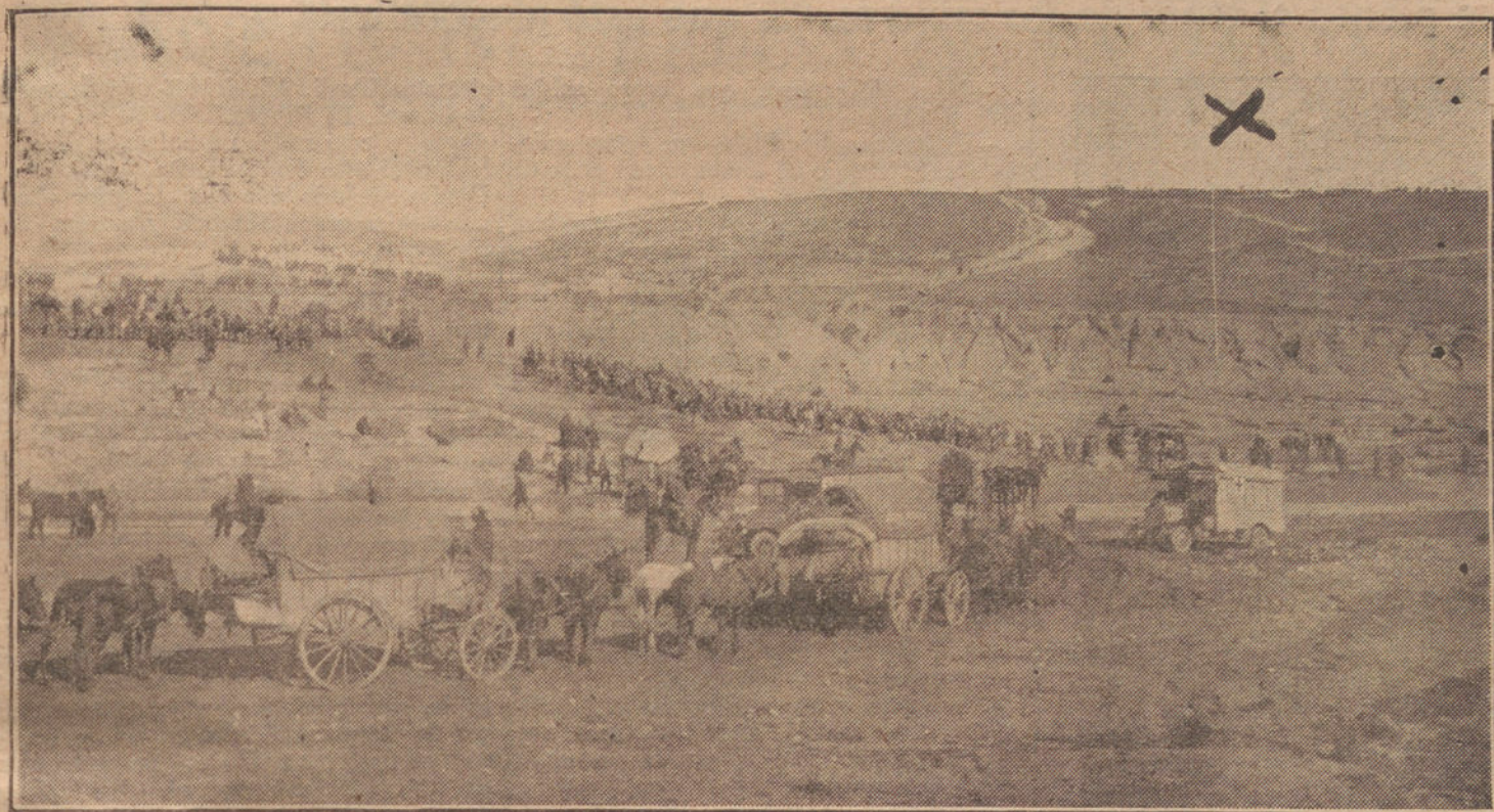
LAS OPERACIONES EN BENI-SAID.—LA COLUMNA DEL GENERAL CABANELLAS PASANDO EL RIO KERT PARA ENTRAR EN KANDUSSI (X), POSICION OCUPADA YA POR LA VANGUARDIA

¿Dispone Abd-el-Krim de cinco mil hombres?