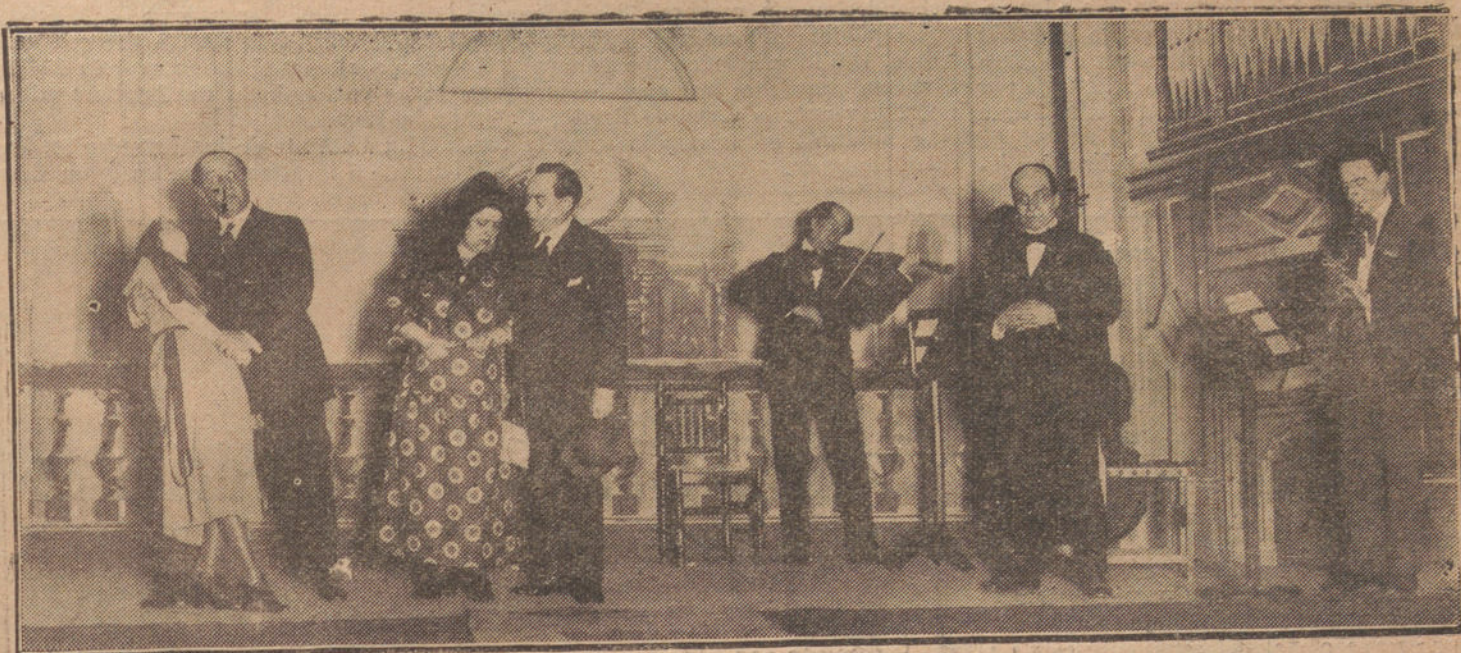
UNA ESCENA DE «MIMOSA», QUE SE ESTRENA ESTA NOCHE EN EL TEATRO REY ALFONSO

Prensa nos diga que en «Mimosa» no se resuelve ningún problema.