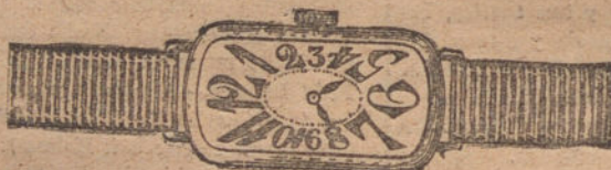
Núm. 1.—Ancora de forma, oro de ley 18 quilates con pulsera de moiré. Ptas. 175.

Formas modernas y elegantes.—Máquinas finas de precisión.—Garantía efectiva de buena marcha por cinco años.