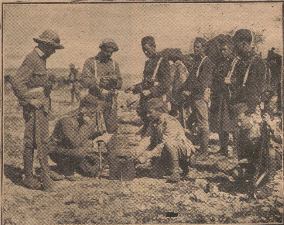
LA OCUPACION DE KANDUSSI.—TRANSMITIENDO AL GENERAL EN JEFE EL TELEFONO EN QUE SE LE COMUNICA LA OCUPACION

De las señoras asociadas, sólo están invitadas las damas enfermeras, que asistirán de uniforme.