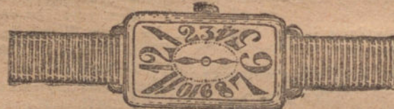
Núm. 2.—Rectangular, ancora 10 rubíes, oro de ley 18 quilates con pulsera de moiré. Ptas. 200.