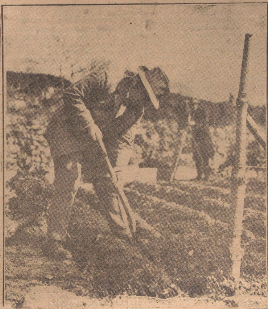
LLOYD GEORGE CULTIVANDO SU HUERTO

Las tropas dispararon, resultando muertos 20 indígenas y heridos 30.