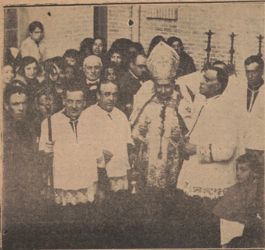
ACTO INAUGURAL DEL GRUPO DE CASAS BARATAS EN LOS CUATRO CAMINOS.— EL OBISPO DE MADRID-ALCALA BENDICIENDO LAS CASAS