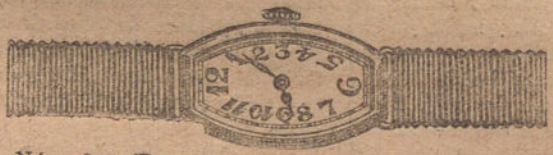
Núm. 3.—Tonneau, ancora de precisión, oro de ley 18 quilates con pulsera de moiré. Ptas. 250.