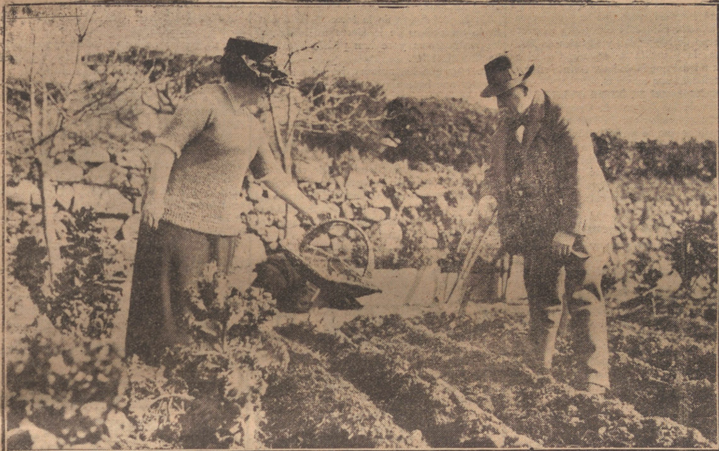
LLOYD GEORGE, ACOMPAÑADO DE SU ESPOSA, RECOGE LA COSECHA DE PATATAS POR EL CULTIVADO.

La figura de Lloyd George, el gran gobernante inglés, es una de las que más se destacan en la política mundial.