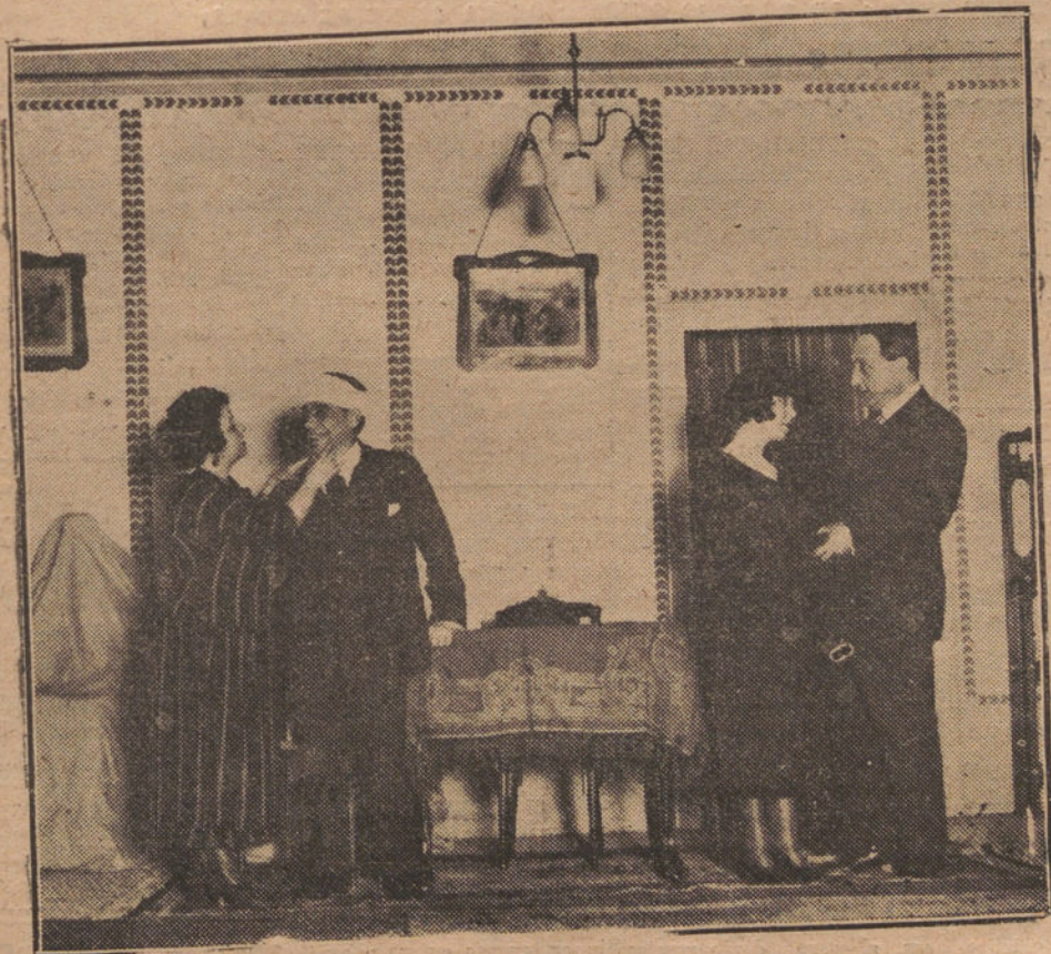
OTRA ESCENA DE «MIMOSA»

RECORDAMOS A NUESTROS LECTORES QUE NO DEVOLVEMOS LOS ORIGINALES QUE SE NOS ENVIEN ESPONTANEAMENTE, NI SOSTENEMOS CORRESPONDENCIA A CERCA DE ELLOS