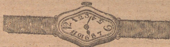
Núm. 5.—Festoneado, ancora de precisión, oro de ley 18 quilates con pulsera de moiré. Ptas. 300.