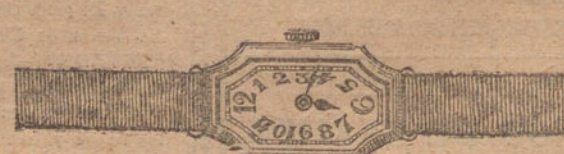
Núm. 6.—Ancora de precisión, oro de ley 18 quila- tes con pulsera de moiré. Ptas. 325.