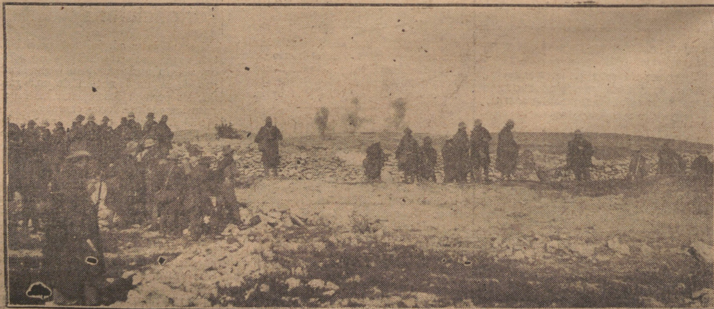
LAS GUERRILLAS PREPARADAS PARA LANZARSE AL ASALTO, MIENTRAS LA ARTILLERIA BATE LAS COLUMNAS ENEMIGAS.

LONDRES 20. Telegramas llegados de Ahmedabad anuncian que el jefe nacionalista Gandhi ha sido condenado por los Tribunales a seis años de prisión común. En previsión de la actitud que puedan adoptar los indígenas se han tomado toda clase de medidas.