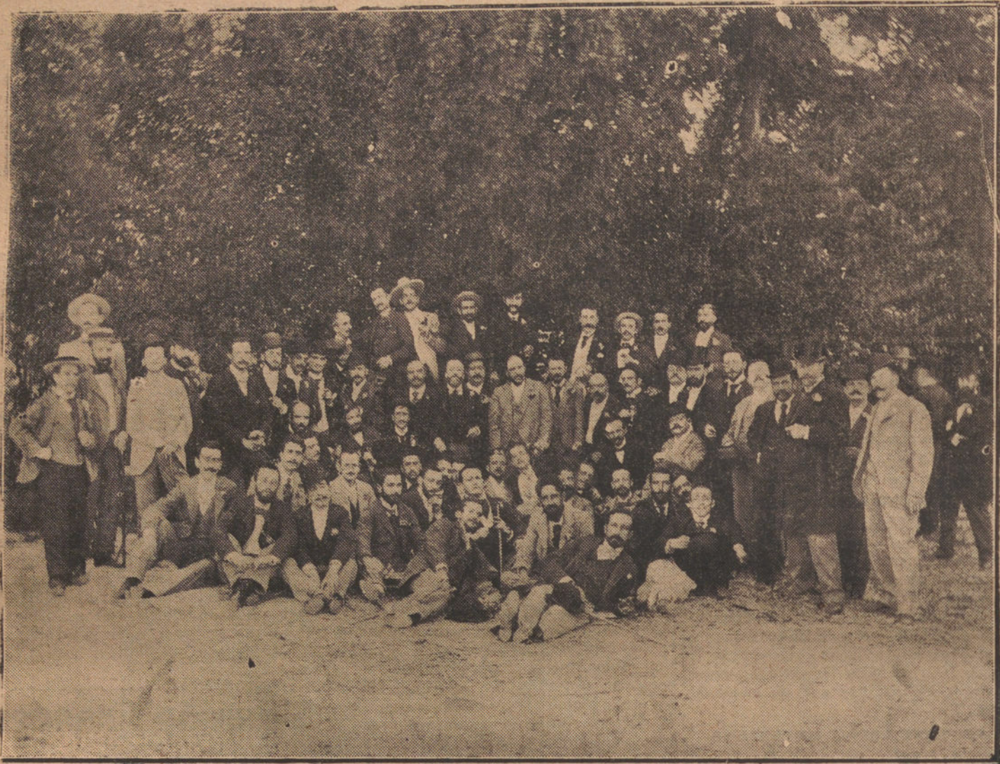
UN BANQUETE AL MAESTRO CHAPI