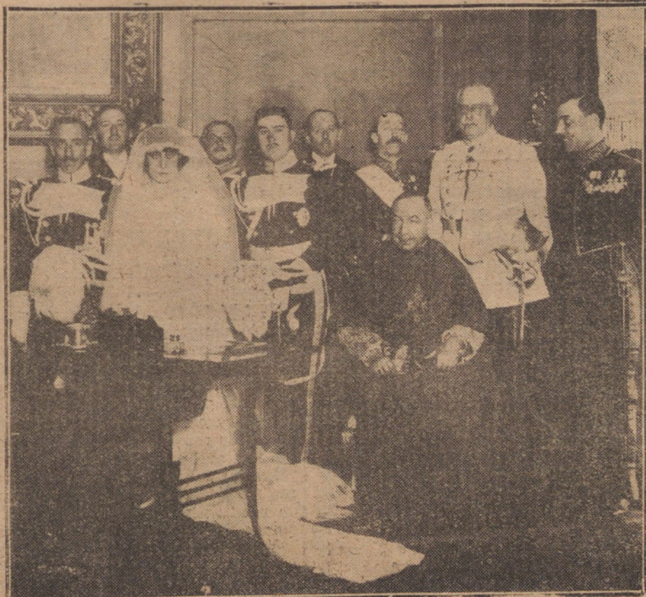
BODA DE LA CONDESA DE CABRILLAS, HIJA DE LOS DUQUES DE AVEYRO, CON EL CONDE DE VILLAMENA, HIJO DE LA CONDESA VIUDA DE FLORIDABLANCA