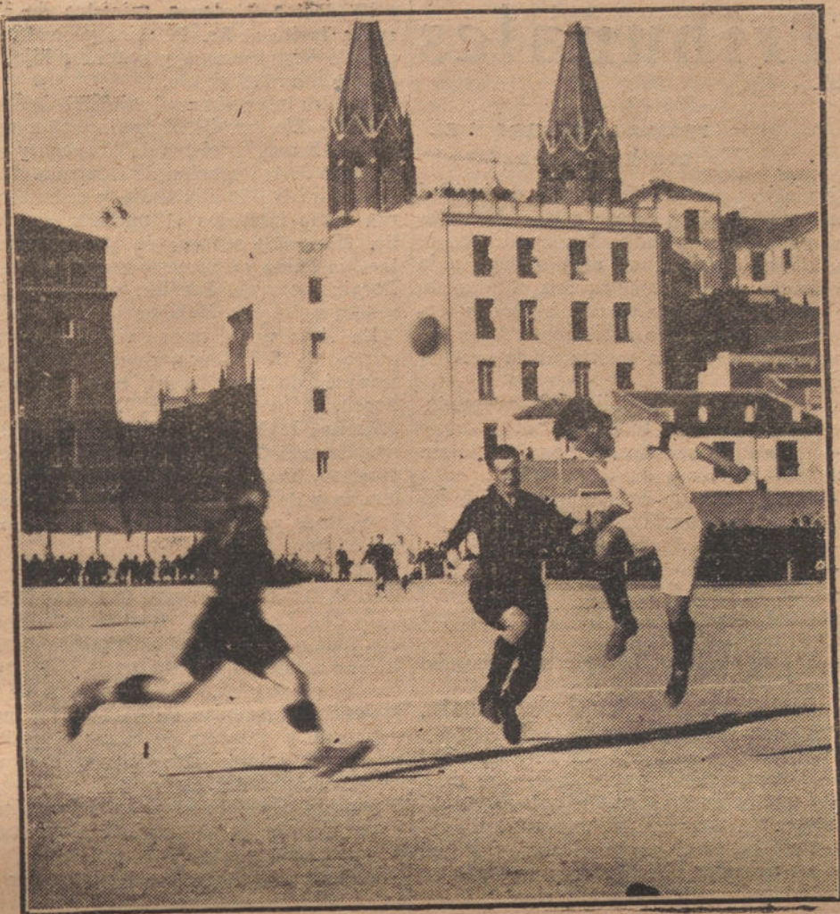
UNA JUGADA INTERESANTE