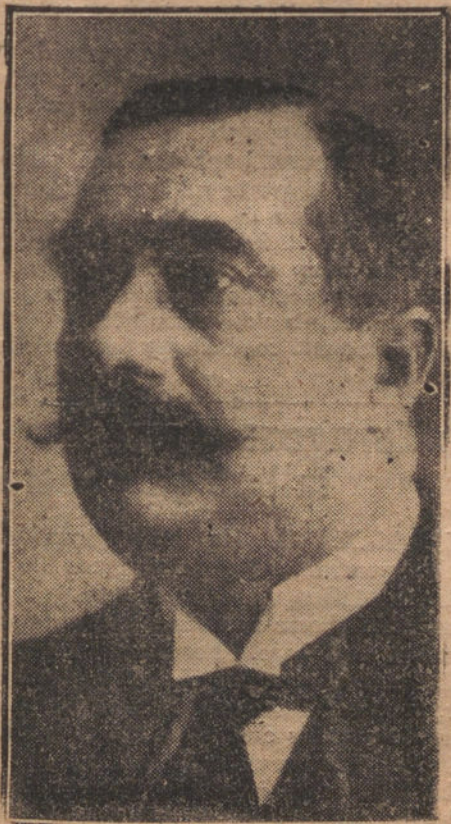
EL NUEVO ALCALDE DE MADRID, SEÑOR GARAY

Dado en Palacio a veintuno de marzo de mil novecientos veintidós.—ALFONSO.—El ministro de la Gobernación, Vicente de Pineda.