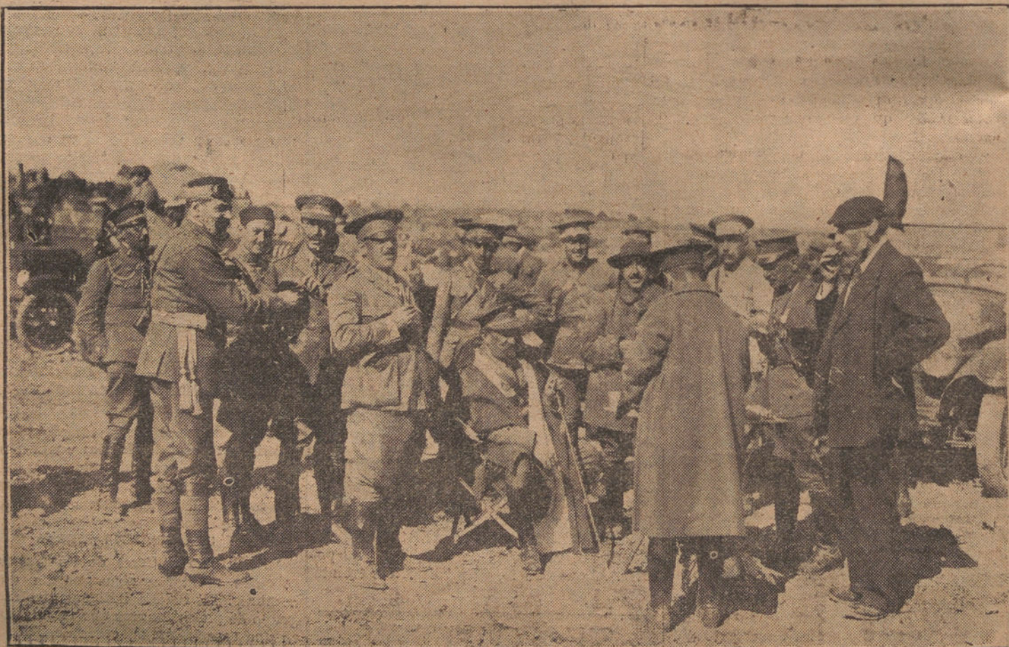
EL ALTO COMISARIO Y EL COMANDANTE GENERAL DE MELILLA, CONFERENCIANDO CON LOS JESES DURANTE UN DESCANSO EN LAS OPERACIONES