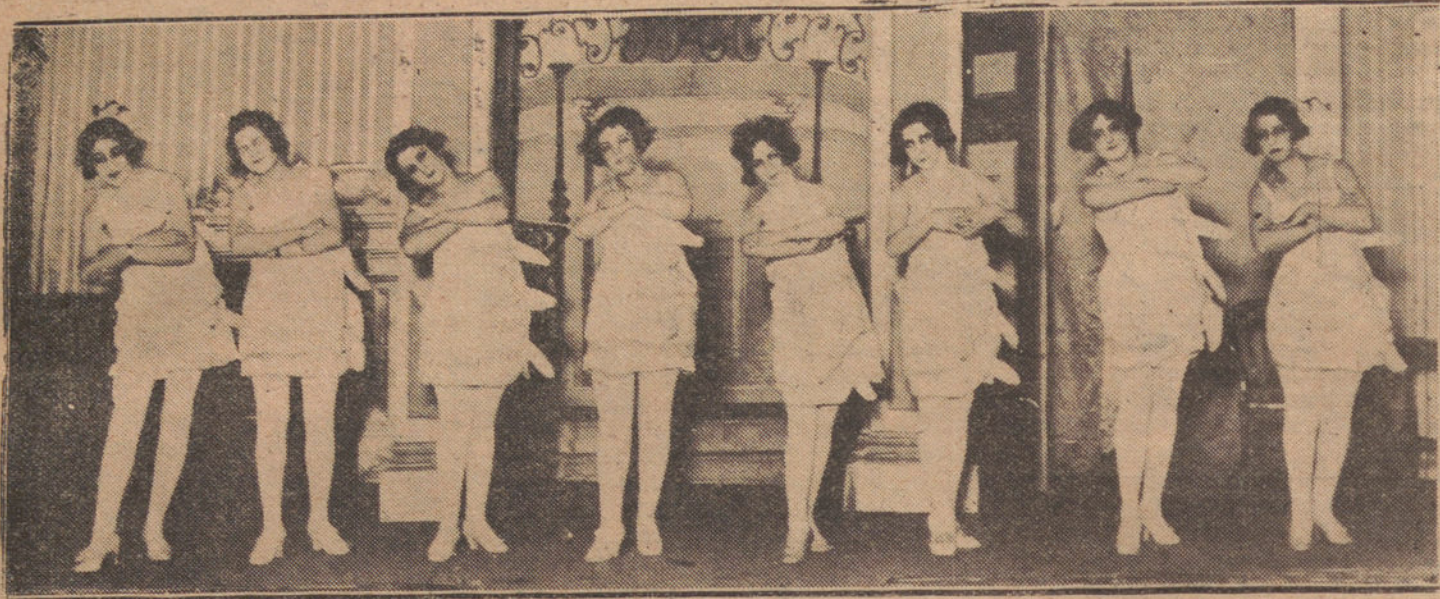
UNA ESCENA DE LA OBRA «LA SEÑORA DE CABEZA», ESTRENADA ANOCHE EN MARTÍN