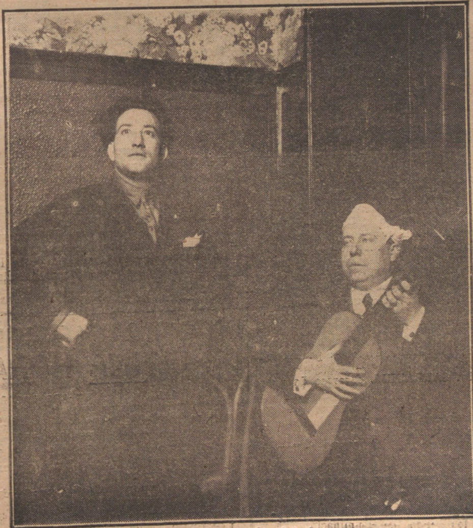
DOS GLORIAS ESPAÑOLAS DE ARTZ LIRICO: EL MAESTRO LUNA Y MIGUEL FLETA