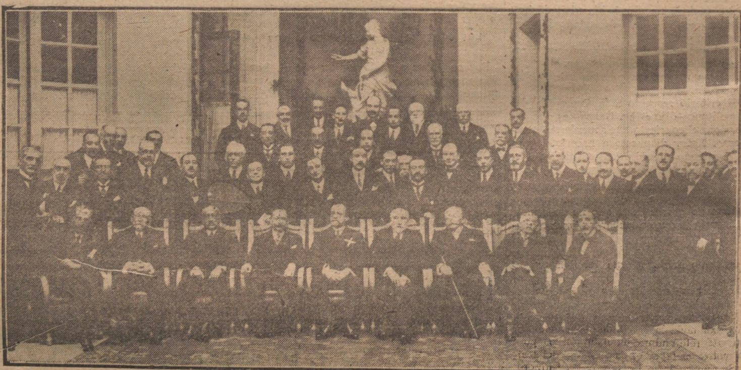
BANQUETE CON QUE LOS PARLAMENTARIOS GALLEGOS HAN OBSEQUIADO HOY EN EL HOTEL RITZ, AL PRESIDENTE DEL CONGRESO, CONDE DE BUGALLAL