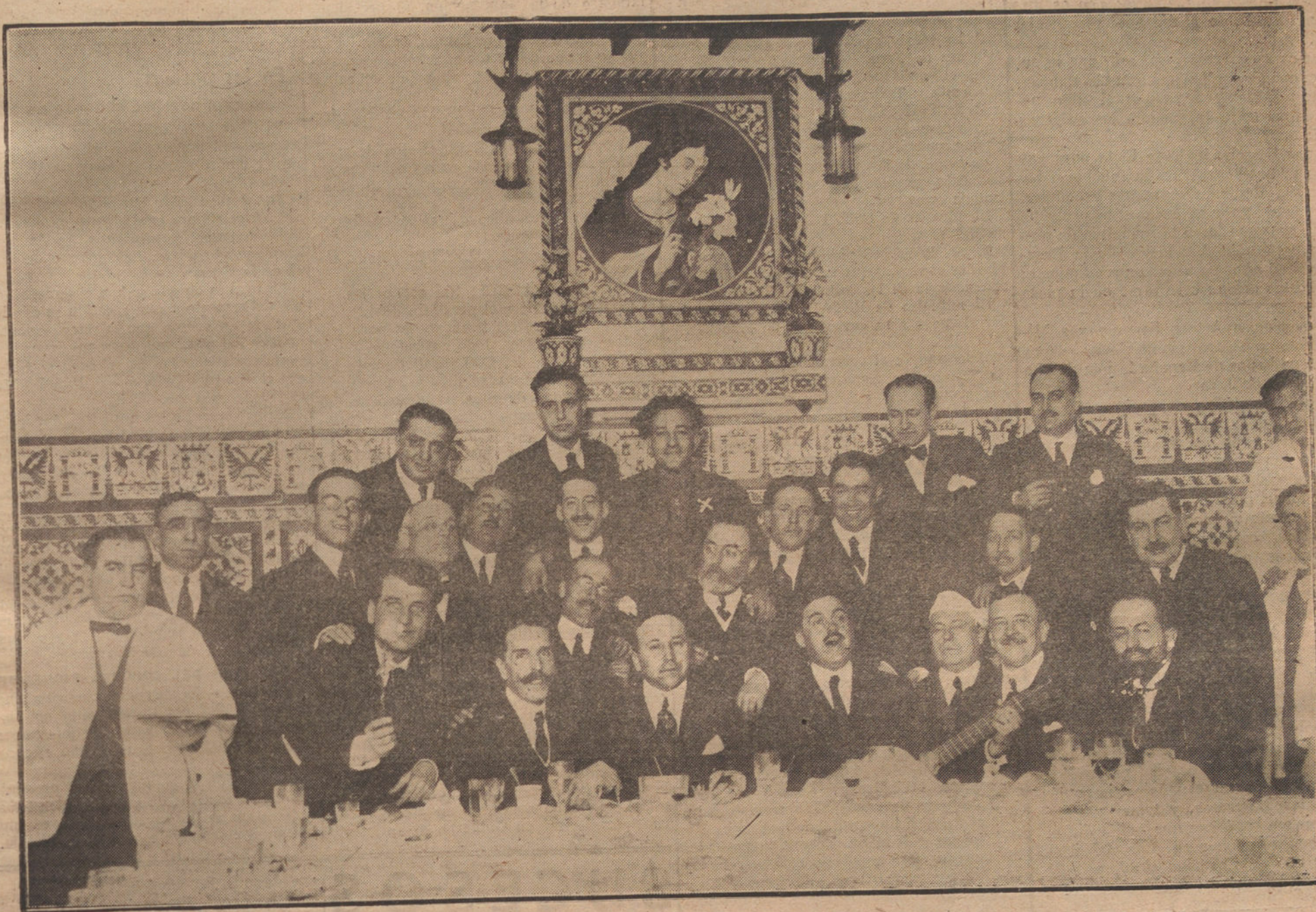
EL GRAN TENOR MIGUEL FLETA, RODEADO DE LOS ASISTENTES A LA CASTIZA FIESTA DE ANOCHE