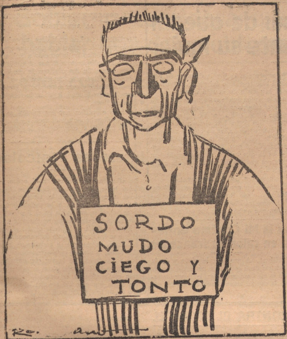
El pueb'o de Madrid (Apunte al natural)