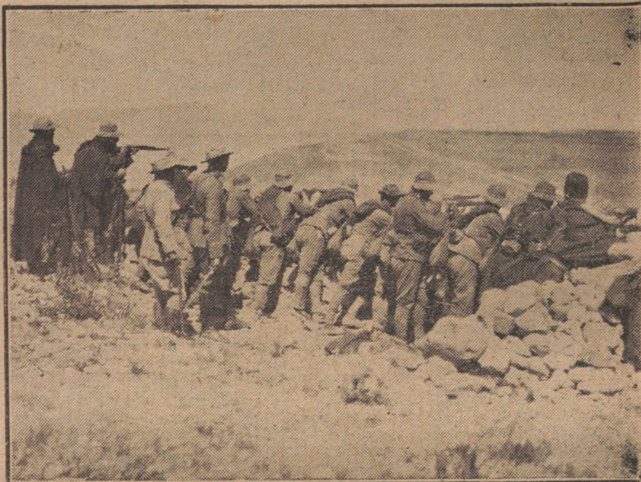
NUESTROS SOLDADOS DISPARANDO SOBRE EL ENEMIGO DESDE UNA DE LAS TRINCHERAS TOMADAS A LA BAYONETA