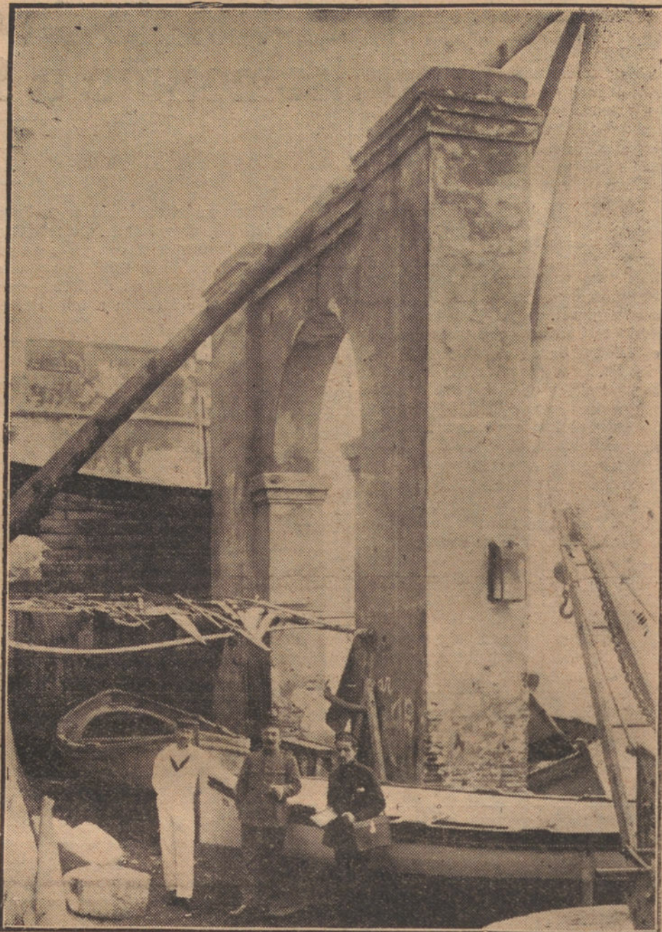
VISTA DEL DESEMBARCADERO DE LA PLAZA