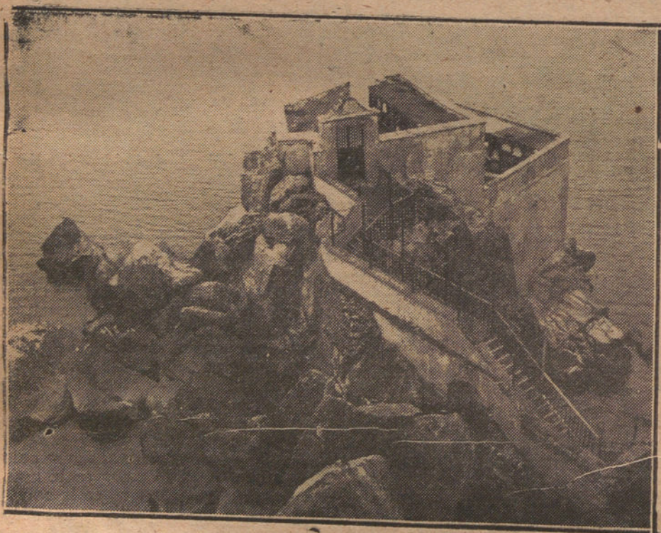
EL CEMENTERIO DE ALHUCEMAS, SITUADO EN EL EXTREMO MAS AVANZADO DEL PENON