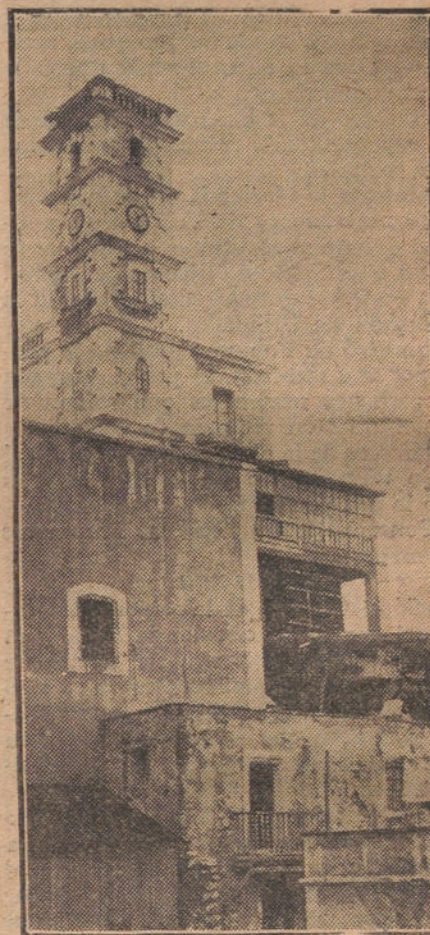
LA TORRE DEL PEÑON, QUE HA SUFRI- DO ALGUNOS DESPERFECTOS A CAUSA DEL CAÑONEO ENEMIGO

No comparto el criterio de Trueta: «Dichoso aquel que no ha visto más río que el de su patria y duerme, anciano, a la sombra de pequeño jugaba.»