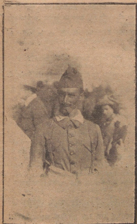
EL HEROICO COMANDANTE DEL TERCIO, SEÑOR FONTANES, MUERTO EN EL COMBATE DE AMBAR