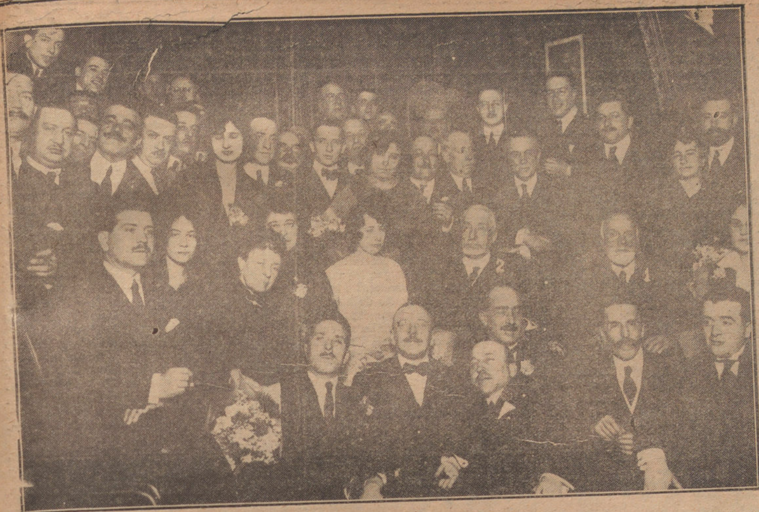
GRUPO DE PERSONALIDADES QUE, PRESIDIDAS POR DON ARMANDO PALACIO VALDES (1) Y DON ANGEL PULIDO (2), SE REUNIERON EL SABADO EN EL CENTRO ASTURIANO PARA COMER UNA «FABADA»

NUEVA YORK 27. El horario de verano entrará en vigor en Chicago y Nueva York a las doce de la noche del último domingo del mes de abril, y se volverá a la hora normal el último domingo del mes de septiembre.