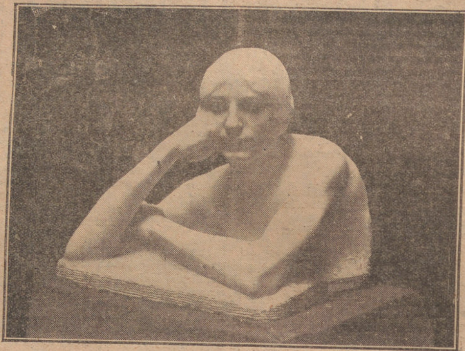
«MI DISCURSO EN MÁRMOL», BUSTO REGALADO POR INURRIA A LA ACADEMIA DE BELLAS ARTES

Pero no. Si Inurria ha entrado en la Academia, porque este era un homenaje que se le debía a su gloriosa vida de artista magnífico, hay que esperar que la Academia, todo lo que la Academia tiene de tiesura, de frialdad, de cosa muerta e insensible, no entrará nunca en él. Porque Inurria, cordobés como Séneca, como Góngora, como Romero de Torres y como Lagartijo, (¿no recordáis aquella portentosa estatua suya, que era la glorificación del torero?), lleva en el alma y en la sangre un febril desasosiego que le hará huir de academicismos peligrosos, y que servirá para que su personalidad se destaque siempre vigorosa y multiforme, plena de anhelos no