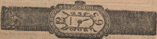
Núm. 5.—Reloj de platino y oro ley 18 quilates con brillantes. Ptas. 1.175