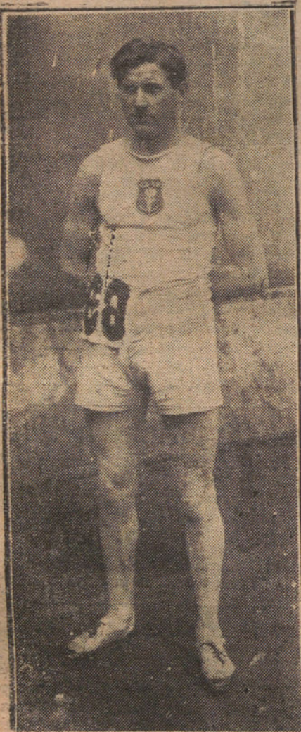
SAN SEBASTIAN.—SCHUERMOL, DEL EQUIPO FRANCÉS, QUE LLEGO EN PRIMERO LUGAR A LA META

El alcalde repartió los premios, dirigiendo un cariñoso saludo a los corredores.