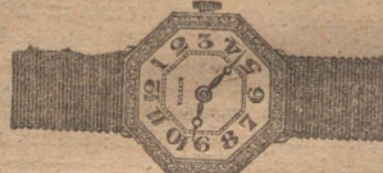
Núm. 3.—Reloj de platino y oro de ley 18 quilates con diamantes rosas. Ptas. 600.