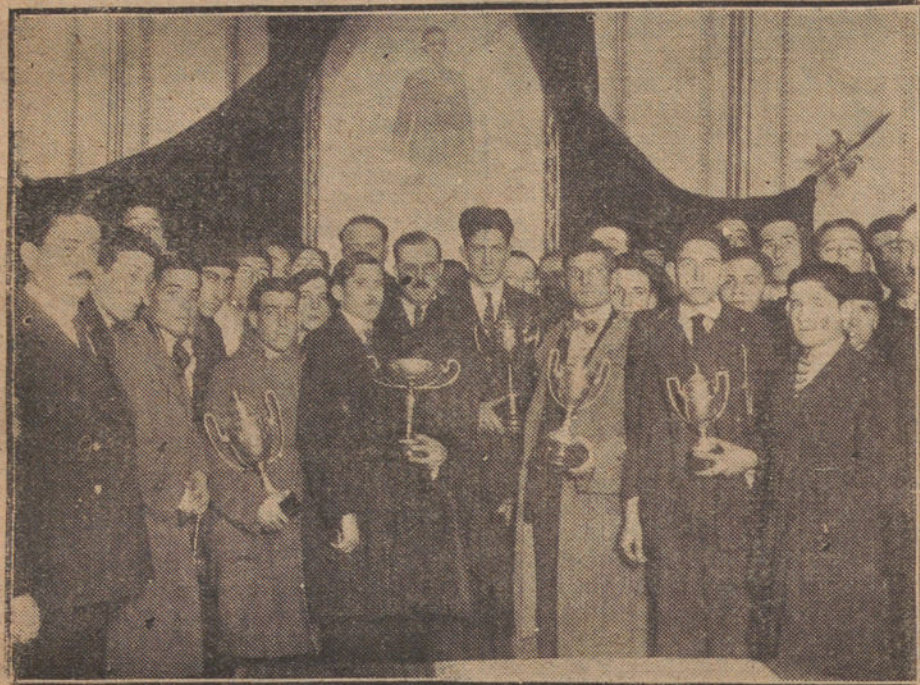
REPARTO DE PREMIOS A LOS VENCEDORES EN LA PRUEBA, CELEBRADO EN EL AYUNTAMIENTO