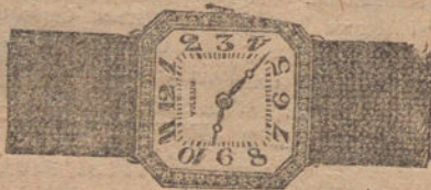
Núm. 2.—Octógono de platino y oro de ley 18 quilates con diamantes rosas. Ptas. 525.

Formas modernas.—Ancoras de precisión con brillantes y diamantes finos.