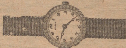
Núm. 1.—Reloj de platino y oro de ley 18 quilates con diamantes rosas, pulsera de moiré. Ptas. 475.