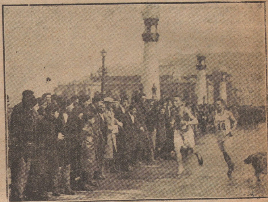
SAN SEBASTIAN.—LOS CORREDORES PASANDO POR EL PUENTE DEL PRINCIPE DE ASTURIAS

que no lo tomara a chacota, porque un árbitro había ya salido a tiros del campo, y a otro, a quien quisieron pinchar la barriga, acabaron atizándole dos garrotazos.