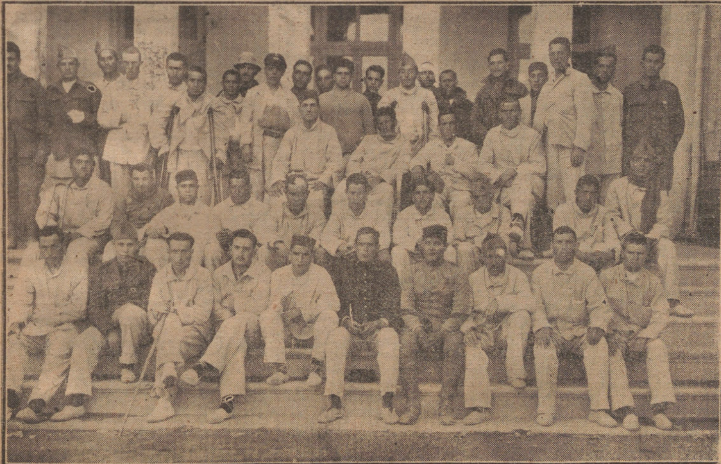
SOLDADOS DEL TERCIO Y DE OTROS CUERPOS, CONVALESCIENTES EN EL HOSPITAL DE LA CRUZ ROJA, DE MELILLA, DE LAS HERIDAS QUE RECIBIERON EN LOS ÚLTIMOS COMBATES

Este, con su amabilidad habitual, charló un rato con los periodistas. «Manzanita», que andaba por allí, y que tenía el afán de hacerse grato a Su Majestad, abrumó a Don Alfon- so con frases obsequiosas, con alabanzas adictivas y con halagadores comentarios a