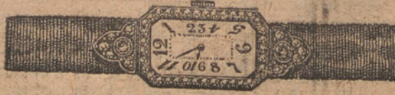
Núm. 6.—Reloj de platino y oro ley 18 quilates con brillantes y diamantes. Ptas. 1.250.