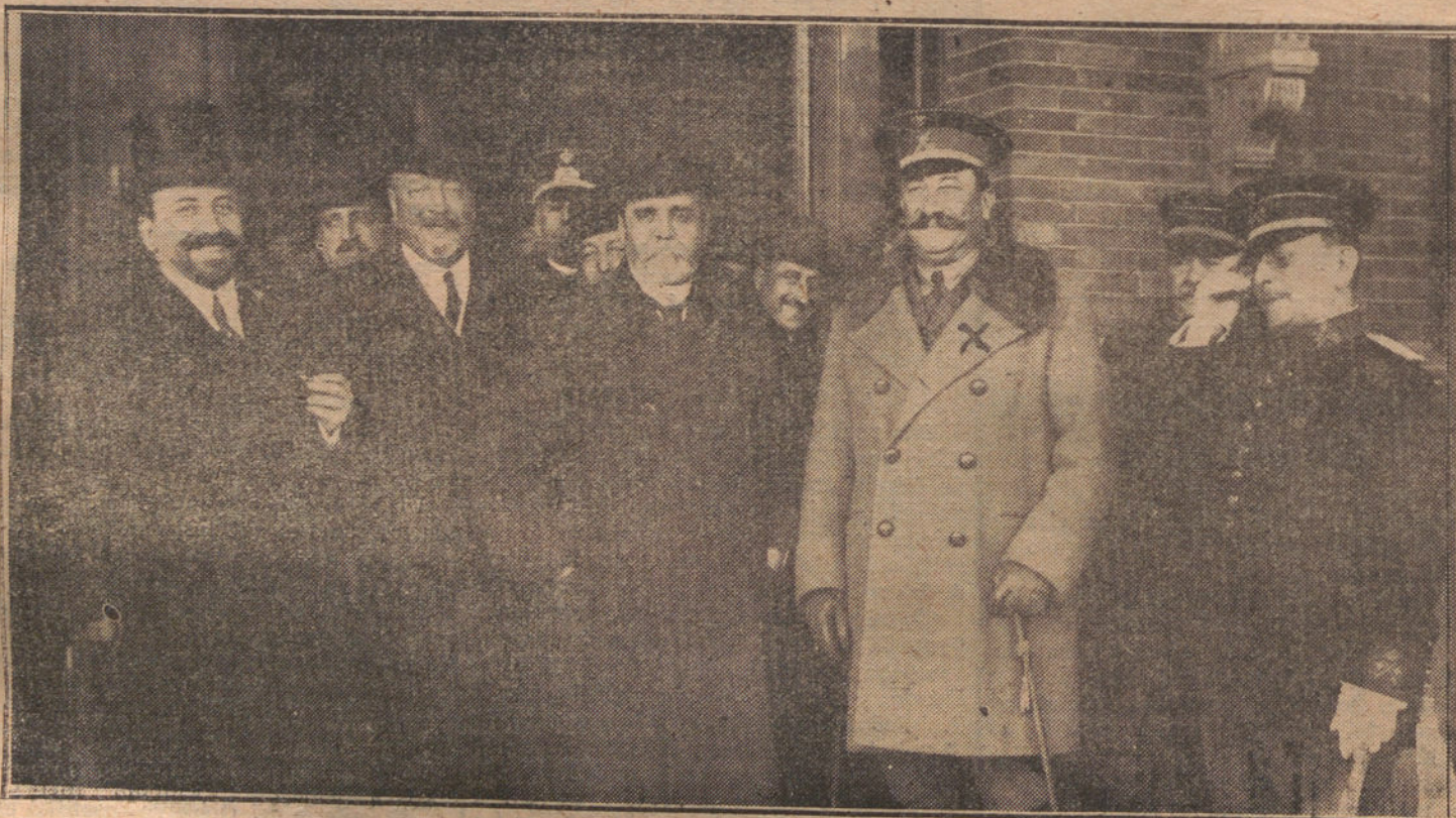
EL GENERAL BERENGUER (X) A SU LLEGADA HOY A MADRID, CON LOS SEÑORES SANCHEZ GUERRA, OLAGUER, ORDOÑEZ Y FERNANDEZ PRIDA, QUE ACUDIERON A RECIBIRLE.