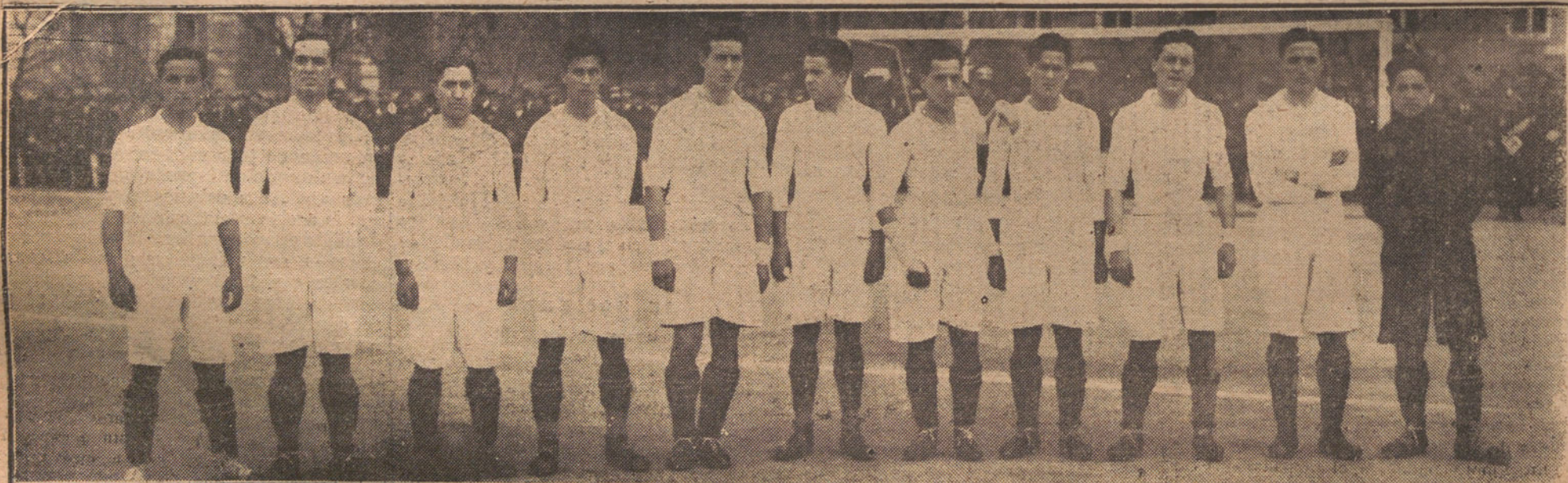
EL EQUIPO REAL-MADRID F. C. GANADOR DEL INTERESANTE PARTIDO DE «FOOT-BALL» JUGADO AYER CONTRA EL ARENAS, DE BILBAO (Fot. Vid.)

TODA LA CORRESPONDENCIA DEBE DIRIGIRSE AL GERENTE DE «LA TRIBUNA»