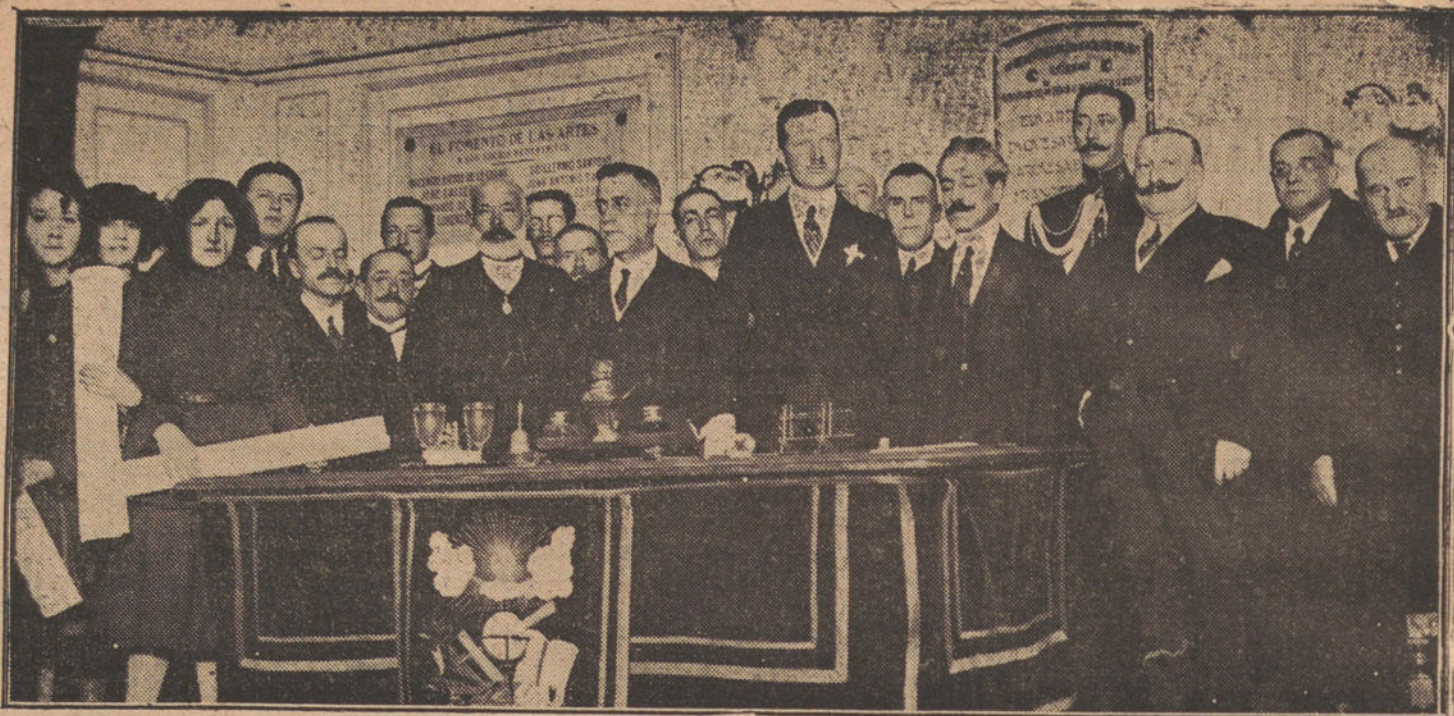
SU ALTEZA REAL EL INFANTE DON FERNANDO (X), CON EL MINISTRO DE INSTRUCCIÓN PÚBLICA, PRESIDENDO EL REPARTO DE PREMIOS DEL FOMENTO DE LAS ARTES