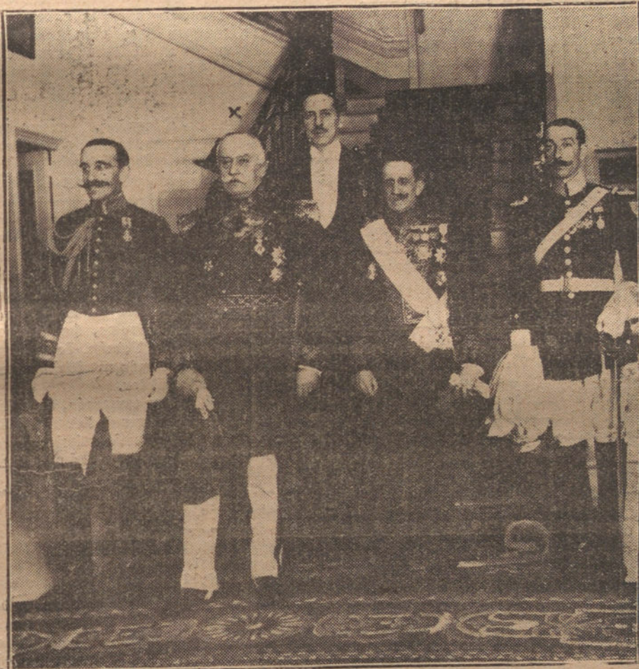
EL CONDE DE ORLOWSKY, MINISTRO PLENIPOTENCIARIO DE POLONIA, QUE HA HECHO ENTREGA DE LAS INSIGNIAS DEL AGUILA BLANCA A SU MAJESTAD EL REY

EL NUMERO DEL TELEFONO DE «LA TRIBUNA» ES EL M.21-21. LLAMENOS SIEMPRE QUE NECESITE ALGO DE NUESTRO PERIODICO