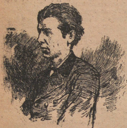
EL POETA BARTRINA