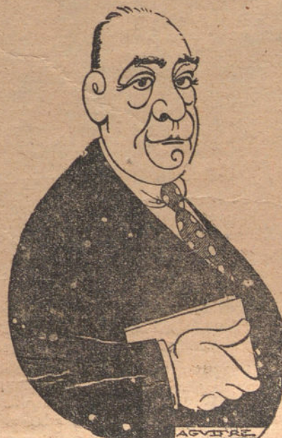
EL ILUSTRE NOVELISTA PED. O MATA