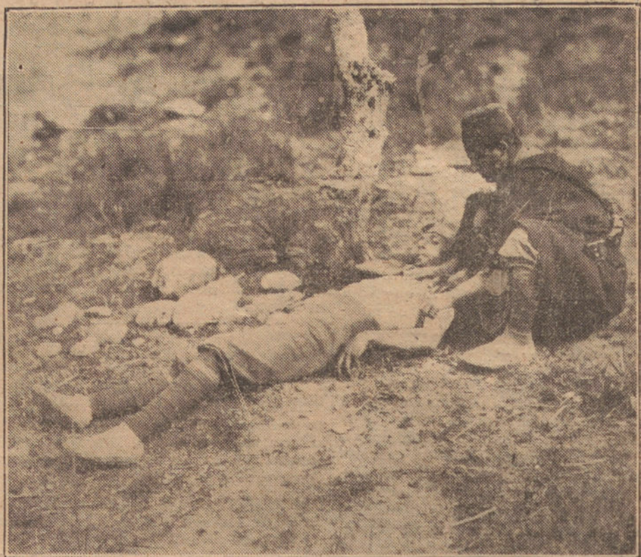
UN MORO DE LA POLICIA INDIGENA AUXILIANDO A UN LEGIONARIO, HERIDO EN UNO DE LOS ULTIMOS COMBATES