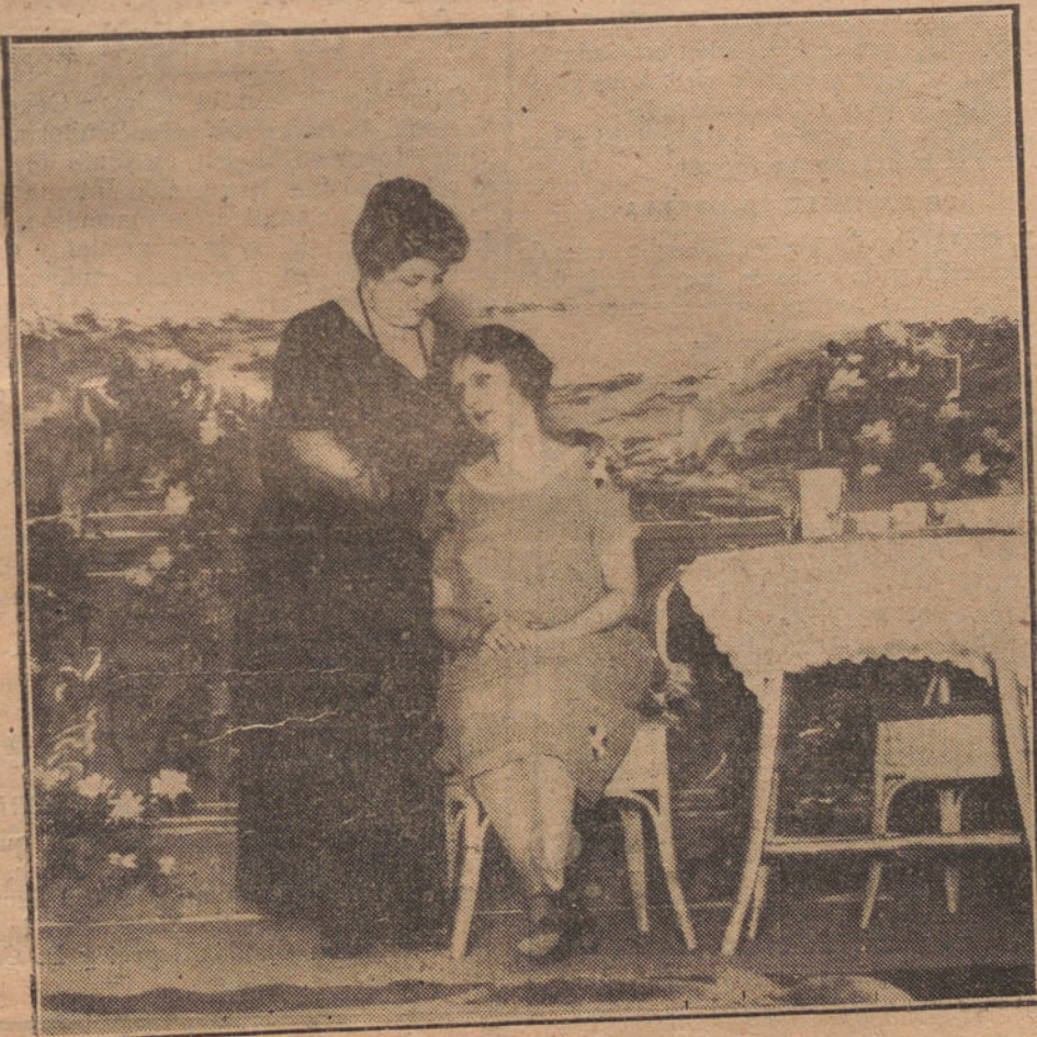
UNA ESCENA DE «LA EXTRAÑA AVENTURA DE MARTÍN PEQUET», QUE SE ES- TRENA ESTA NOCHE EN «EL REY ALFONSO»

—Cualquiera la tiene. —Y que se pasa uno entonces un trago acibarado. —Pero Arniches quiere que su «Mala hora» le valga muchos miles de pesetas y más palmas que las que se han vendido en el mundo desde que Jesús entró en Jerusa- lén en un pollino. —Entonces, ¿«La mala hora»?... —Es una obra de la modalidad de «La chica del gato», escrita por D. Carlos para