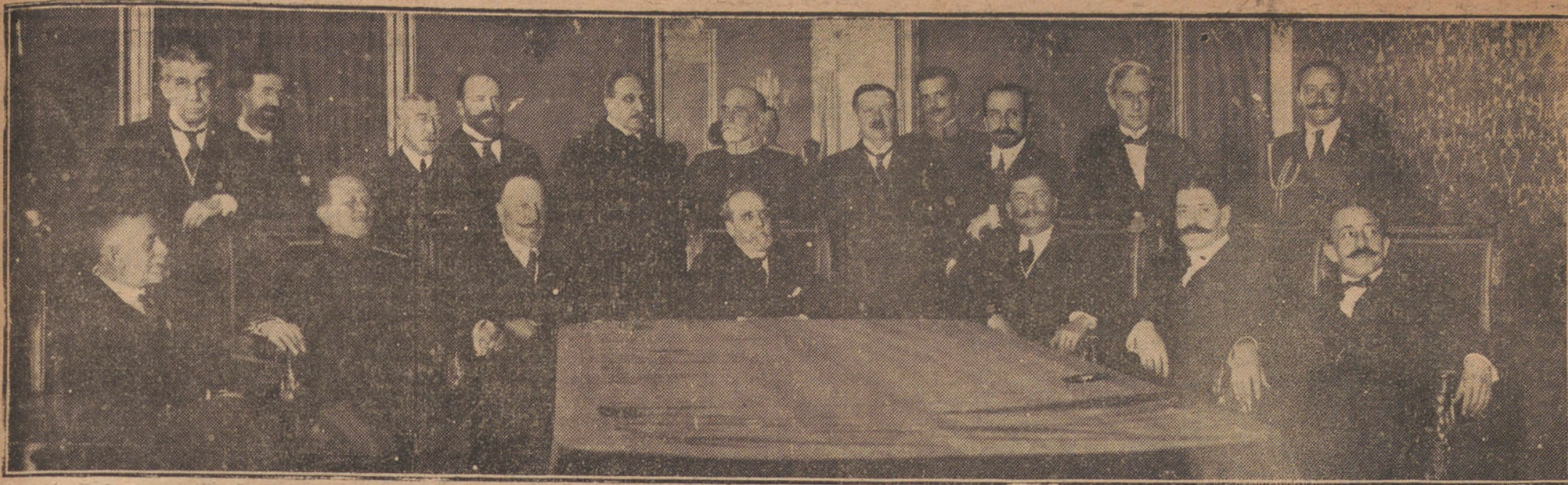
EL GENERAL BERENGUER EN UNA DE SUS CONFERENCIAS CON EL GOBIERNO Y CON LOS JEFES DE ESTADO MAYOR DEL EJERCITO Y DE LA ARMADA