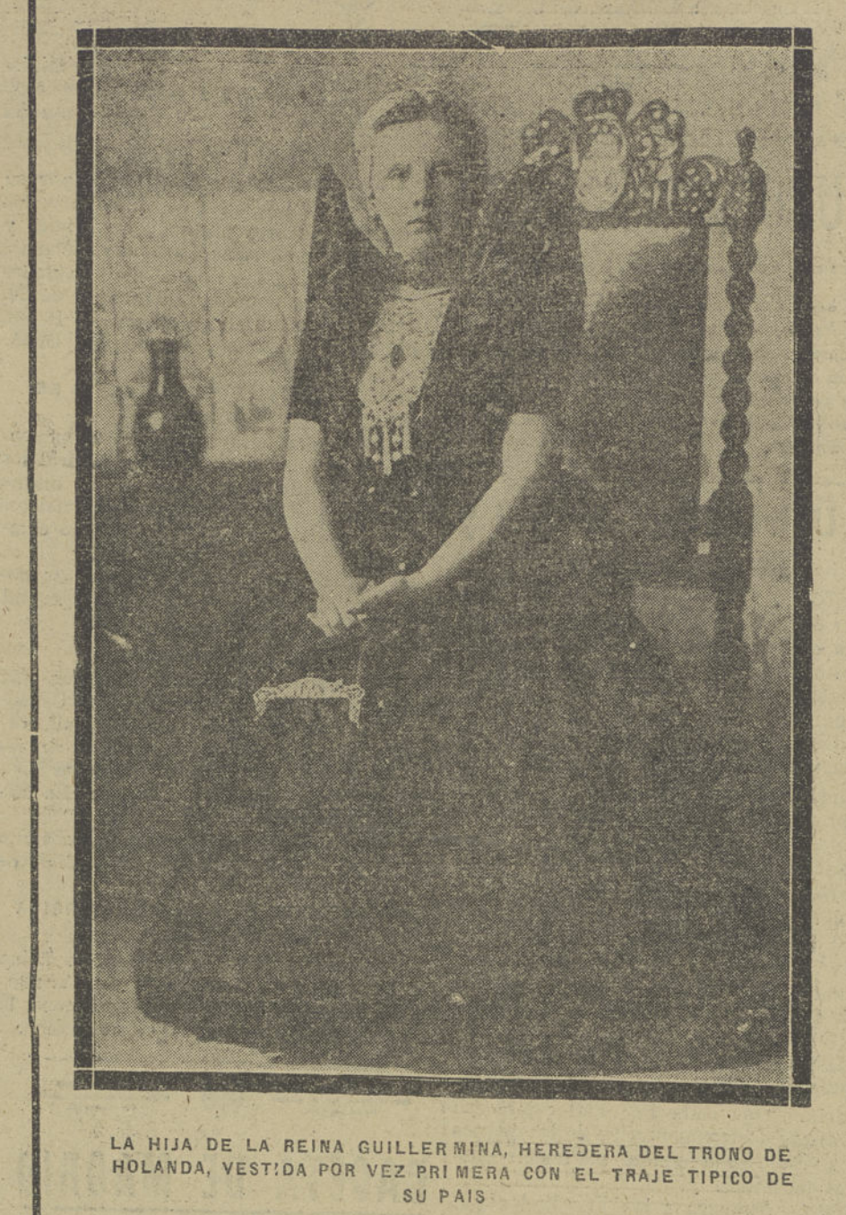
LA HIJA DE LA REINA GUILLERMINA, HEREDERA DEL TRONO DE HOLANDA, VESTIDA POR VEZ PRIMERA CON EL TRAJE TÍPICO DE SU PAÍS

La Agrupación de Limpiadores de la Federación de empleados y obreros del Ayuntamiento de Madrid ha designado una Comisión que instruya expediente con motivo de las manifestaciones hechas por el Sr. Alvarez Herrero en la última sesión del Ayuntamiento relativas a ofertas de dinero para la adjudicación de ciertas plazas. La Junta directiva ha solicitado de su similar de la Casa del Pueblo que designe otra Comisión que se sume a aquella para actuar de acuerdo en esta gestión moralizadora. Es propósito de los iniciadores presentar la oportuna denuncia en los Tribunales de Justicia si de las actuaciones resultasen pruebas fehacientes o indicios de delito y solicitar del Ayuntamiento la expulsión del funcionario, empleado u obrero que resulte culpable.