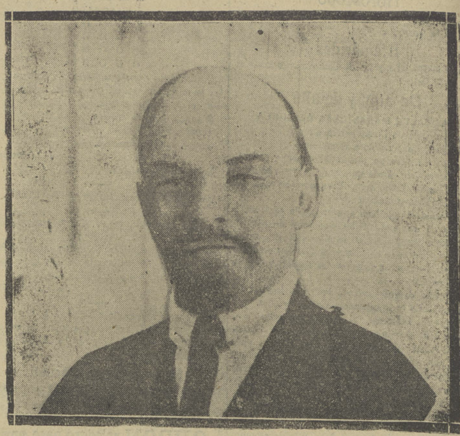
LENIN, EL PRESIDENTE DEL GOBIERNO DE LOS SOVIETS, CUYO ESTADO DE SALUD INSPIRA SERIOS TEMORES

—¡Oh, sí! ¿Cómo no! Pero... yo soy menos romántica que mi hermana. He leído todos sus libros y ya sé que usted escribe por usted, ¡vamos!—corrigió sonriente—, por sus novelas, una verdadera pasión. A mí me marca a veces de tanto hablarla de ellas.