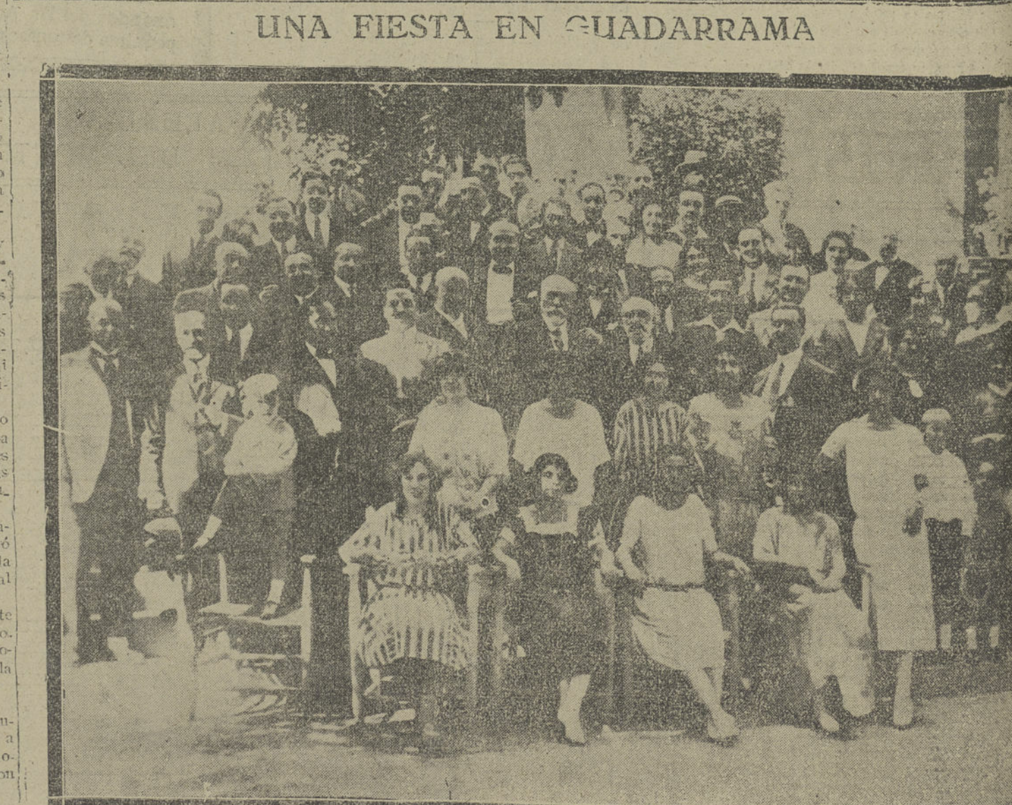
Algunos de los asistentes a la Fiesta Internacional de la Temporada en el Bosque de la Alameda.

Harto hubo de llorar el alma de enamorada doncella la espición que el clérigo mostrara a sus amores con el caballero D. Gonzalo; muchas y ardientes lágrimas vertieron