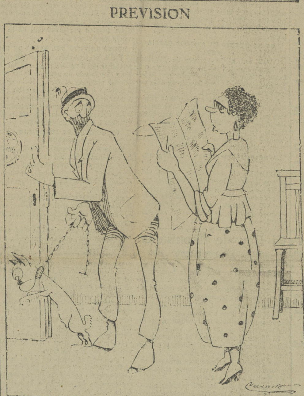
LA MUJER (AL MARIDO QUE SALE A LA CALLE).—SI ACASO, TOMAS LECHE, NO VAYAS A DARLE A BEBER A LA PERRITA, PORQUE HAY MUCHAS INTOXICACIONES.

RECORDAMOS A NUESTROS LECTORES QUE NO DEVOLVEMOS LOS ORIGINALES QUE SE NOS ENVÍEN ESPONTANEAMENTE. NI SOSTENEMOS CORRESPONDENCIA ACERCA DE ELLOS