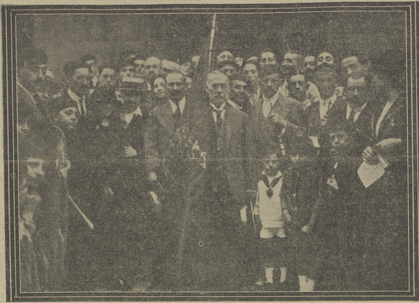
LA COLONIA NAVARRA SALIENDO DE LA IGLESIA DEL BUEN PASTOR, DESPUES DE HABERSE CELEBRADO UNA SOLEMNE FUNCIÓN RELIGIOSA EN HONOR DE SAN FERMIN

Con motivo del carácter técnico del problema es más que probable que en estas conversaciones tomen parte los peritos y que las negociaciones diplomáticas se prolonguen algún tiempo y se haga necesaria una nueva reunión de los ministros que han de tratar el asunto.»