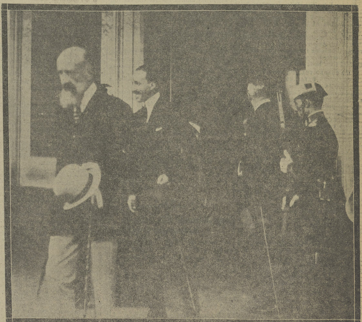
S. M. al llegar a la capital donostiarra.