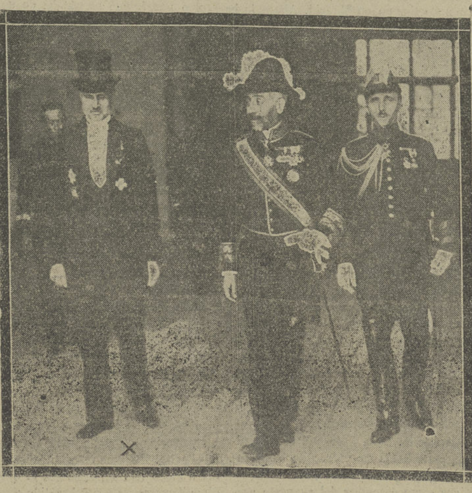
EL NUEVO EMBAJADOR DE AUSTRIA, BARON DE EICHOFFEN, QUE HA PRESENTADO A SU MAJESTAD EL REY SUS CARTAS CREDENCIALES