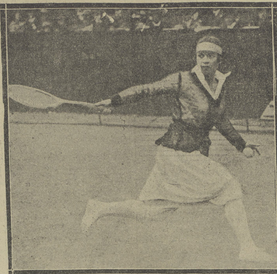
Miss Mallory (norteamericana)

Recordamos a nuestros lectores que no olvidemos los originales que se nos envían espontáneamente, ni sostenemos correspondencia acerca de ellos. Por tanto, son inútiles cuantos ruegos o reclamaciones se nos formulan sobre los mismos.