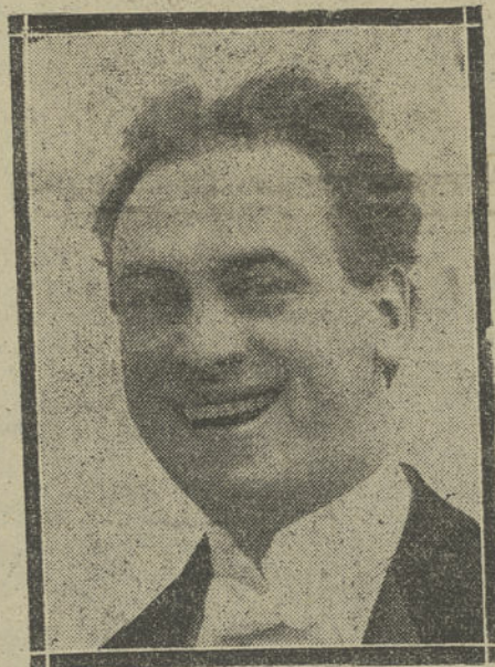
NOTABILISIMO ILUSIONISTA QUE ACTUA EN EL TEATRO DE LA REINA VICTORIA