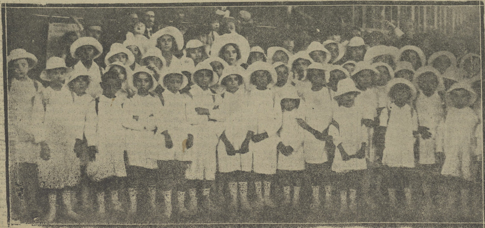
Niños de la colonia que envía al Sanatorio de Oza el Comité femenino de Higiene popular.