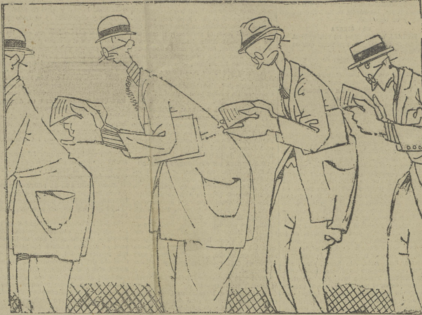
De periodistas que van a hacerle interviús a Burguete