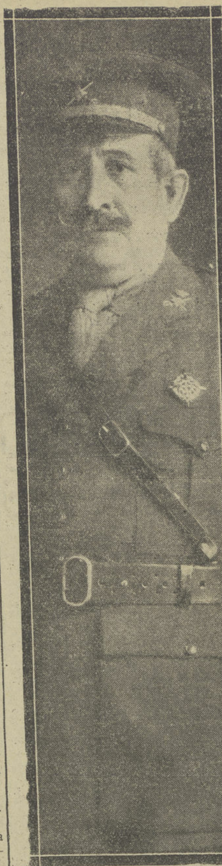
EL GENERAL BURGUETE Ultimo retrato del ilustre militar, alto comisario de España en Marruecos.

Desde entonces no venía a Roma el ras Makonnen, al que se espera con gran interés.