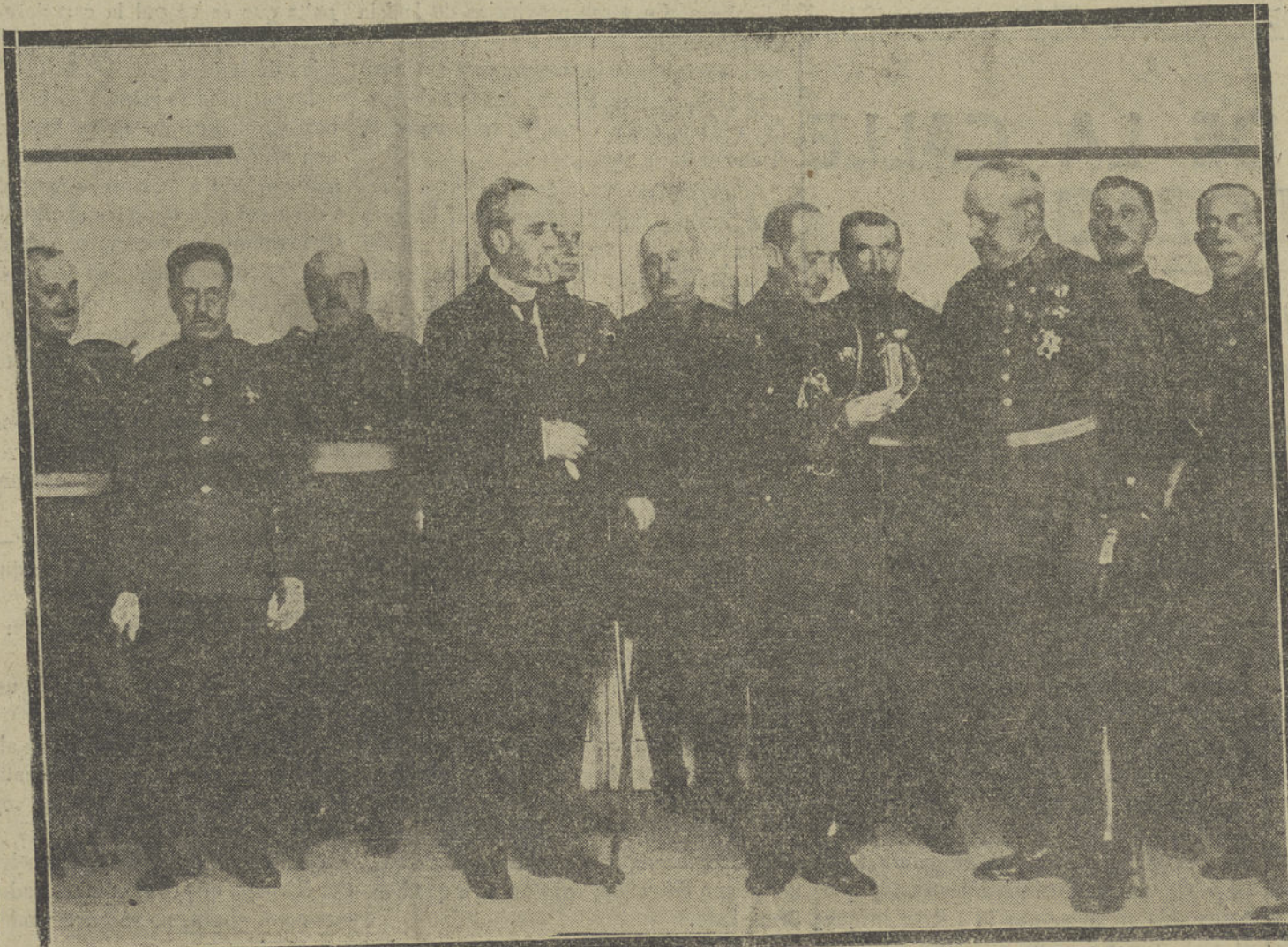
LOS JEFES Y OFICIALES DE ESTADO MAYOR ENTREGANDO AL SUBSECRETARIO DE GUERRA EL OBSEQUIO QUE LE DEDICA DICHO CUERPO